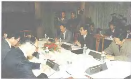
本台记者采访胡锦涛同志视察上海的情景 CCTV reporter interviewing Comrade Hu Jintao while he is reporting Shanghai