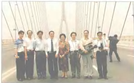
李锐同志视察上海时与本台记者在一起 Comrade Li Rui with CCTV Reporter in Shanghai