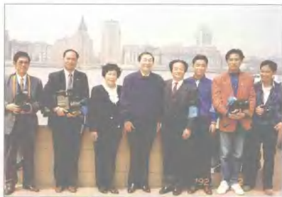
朱镕基同志与本台记者合影 A photo of ZHU Rongjun with CCTV Reporter