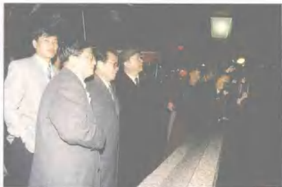
本台记者采访李瑞环同志视察上海的情景 CCTV reporter interviewing Comrade Li Rui while he is reporting Shanghai