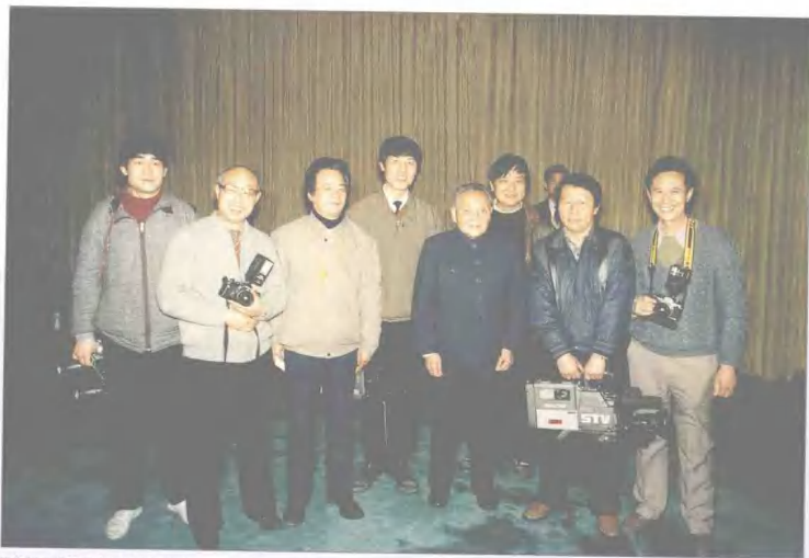
数位记者采访邓小平同志并留影 STV reporter interviewing Cassiniao Deng Xiaoping