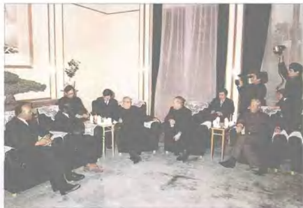
本台记者采访李先念重大外事活动 STV reporters reporting Comrade Li Xiaonian absoving foreigner