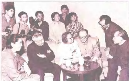
本台记者采访、拍摄邓颖超等党和国家领导人在沪的活动 STV reporters interviewing and reporting activities when Deng Yingchao and other national leaders are in Shanghai