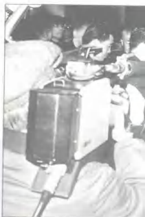
本台记者采访邓小平视察上海时的情景 STV reporter interviewing Chinese Daily Gaoxing when he is in