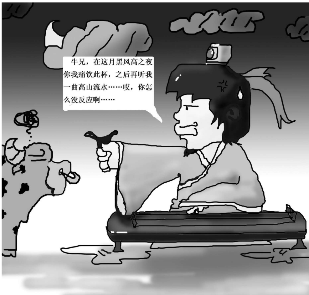
梁霄 08动画一班 指导老师:刘定禹

中国有句古话:无明月不登高楼,无知己不饮美酒。酒向知己饮,诗逢知音颂,凡事适时而定,高山流水知音难觅,更何况对牛弹琴呢?生活中,人们总是有太多精彩想与人分享,但要是找错了对象、找错了时间,反而引得一身烦恼……若是装腔作势,假意清高不更成了笑柄吗?