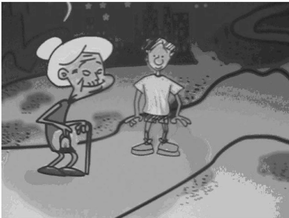
费霏 07 工设二班 指导老师:刘定禹

有一个盲人奶奶,晚上出门总提着一个明亮的灯笼。一个小孩看到了,很是奇怪,就问她:“你又看不见,为什么还要提着灯笼走路?”那个盲人奶奶认真回答道:“这个道理很简单,我提灯笼当然不是为自己照亮道路,而是为了给别人照亮,让他们能看见我,这样既帮助了别人,又保护了自己。”