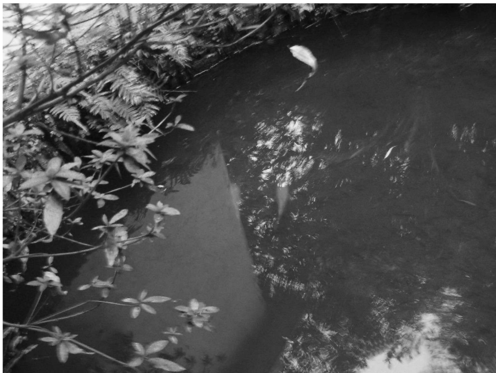
陈新华 07 材料物理二班 指导老师:练崇潮

看到照片中的两尾红鲤鱼,让我想起了《庄子·大宗师》有这么一则寓言:“泉涸,鱼相与处于陆,相响以湿,相濡以沫,不如相忘于江湖。与其誉尧而非桀也,不如两忘而化其道。”庄子提及这一自然现象是将它作为一个动物的行为来陈述的。他以平静淡定的口吻表达一种无心无情无牵挂的心灵境界。在现实生活中,人们往往舍本求末,几乎所有的人都明白它的意思,可是却忘了它本来的根源。庄子劝说人们相濡以沫不过是特殊场景下的特殊事件,并不是幸福的根源,幸福的根源应该是超逸于物外。