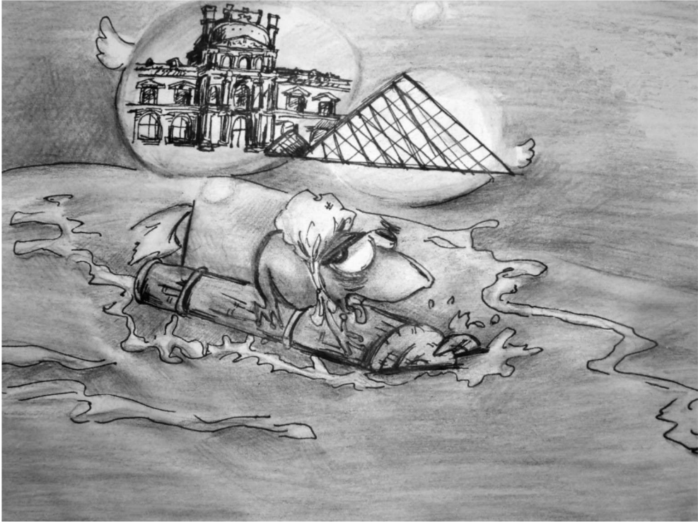
周霞 07 陶设一班 指导老师:刘定禹

我们总是花大量的时间去埋种理想的种子，一旦种子发芽长大，难免会披上现实的外衣。当我们背上理想，游在现实的长河中，是继续追寻理想还是选择随世浮沉？