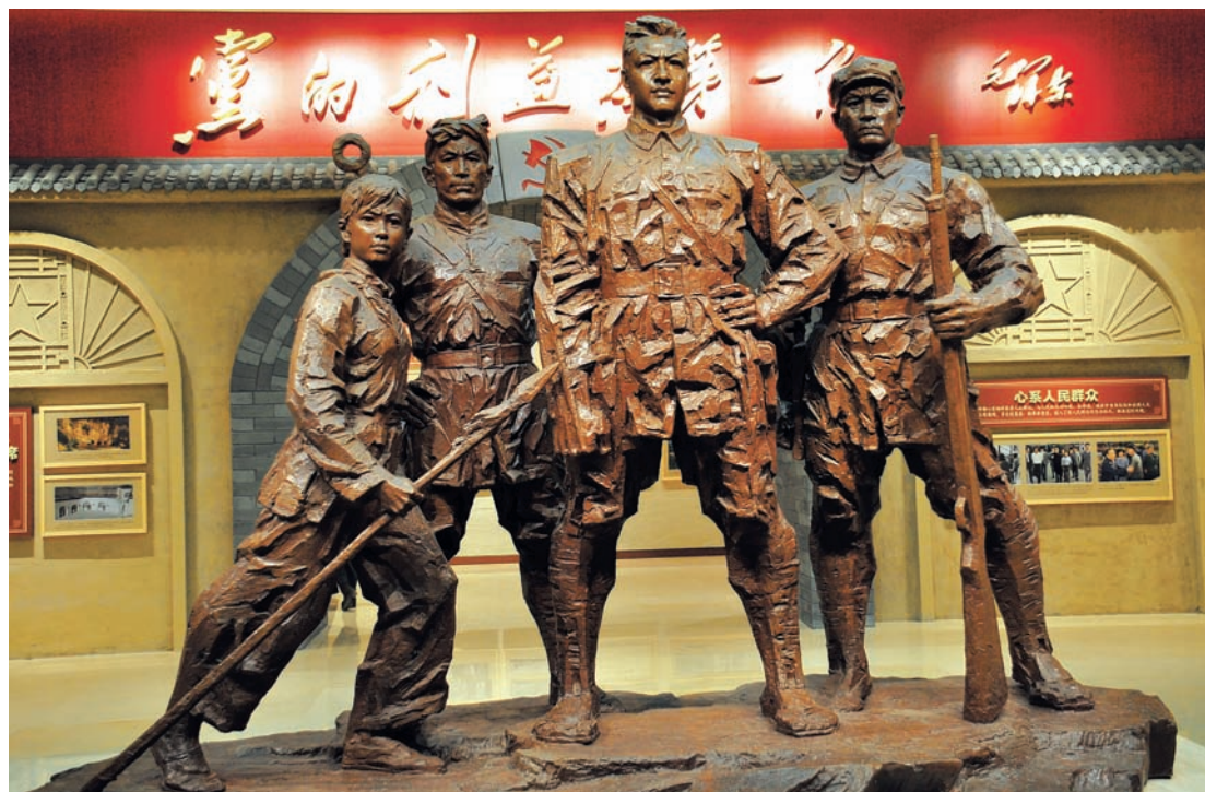
南梁革命纪念馆习仲勋雕塑