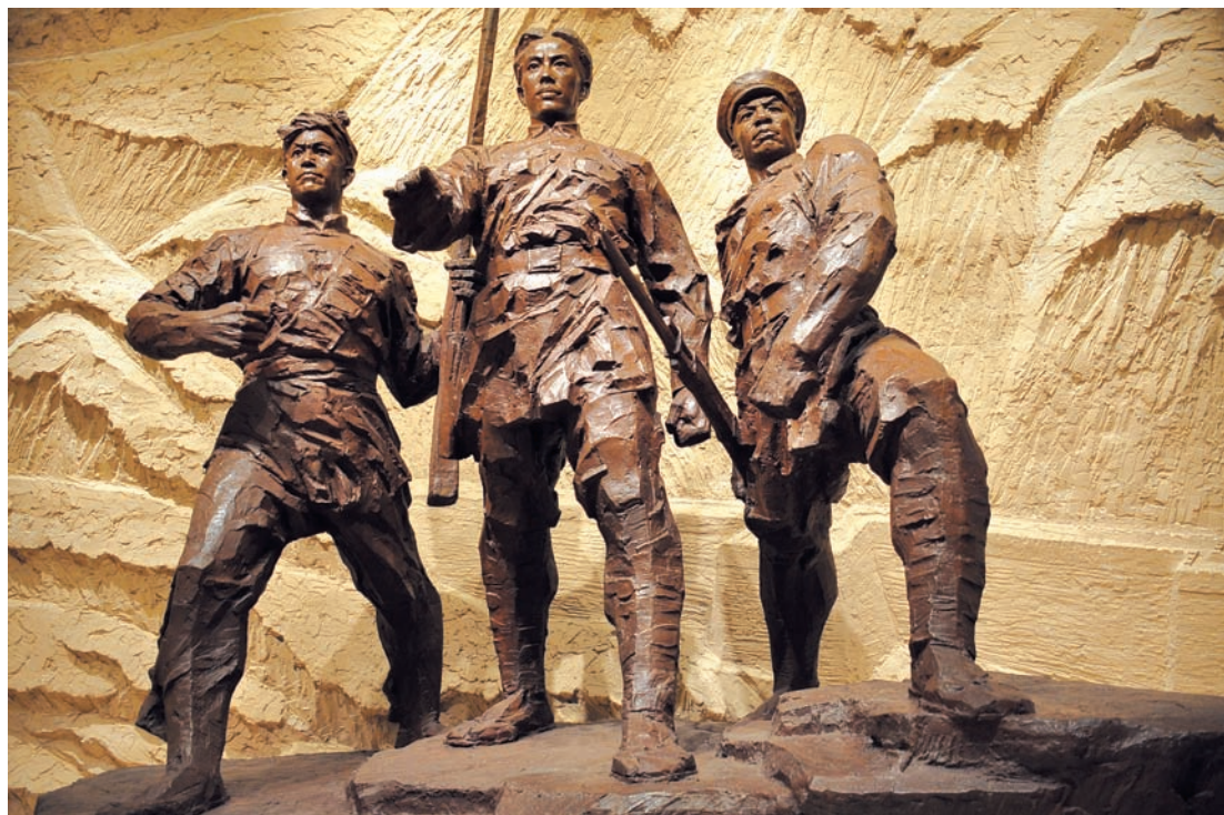
南梁革命纪念馆谢子长雕塑