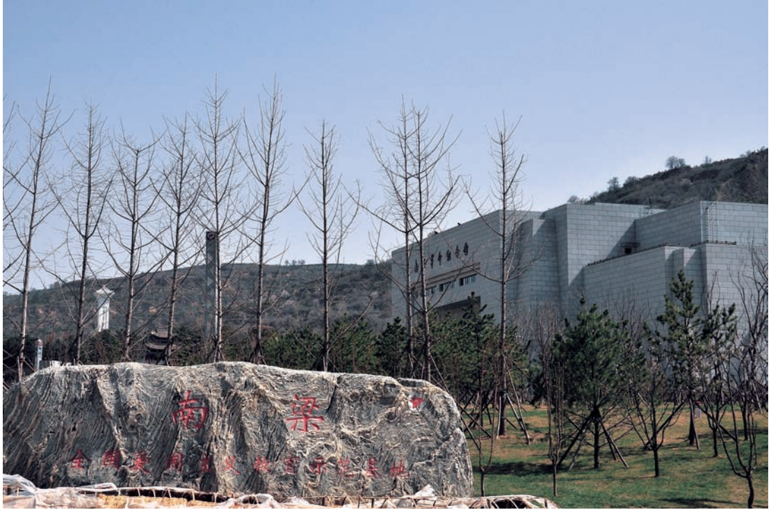
南梁:全国爱国主义教育示范基地