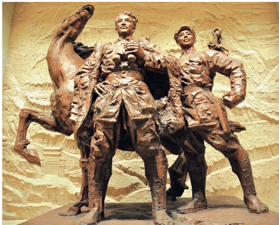
南梁革命纪念馆刘志丹雕塑