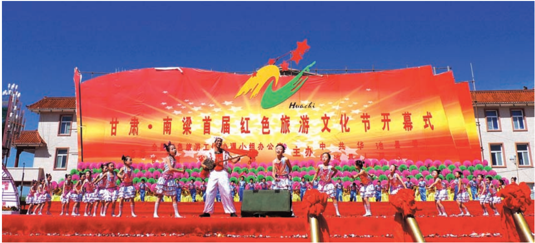
南梁说唱《华池赞》在甘肃·南梁首届红色旅游文化节开幕式上演出剧照