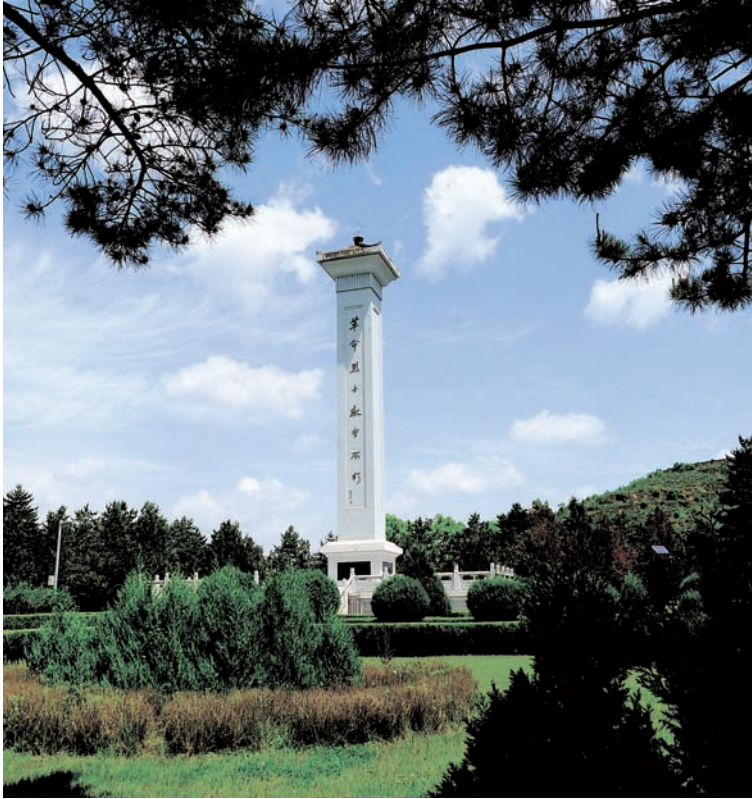
南梁革命烈士纪念碑