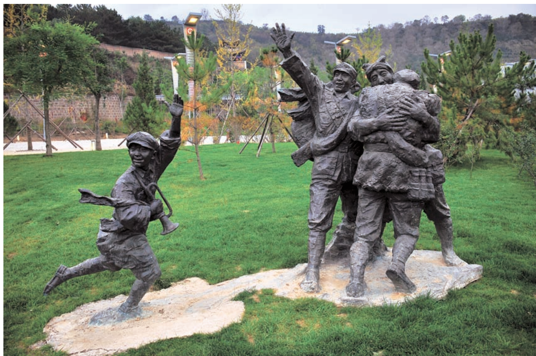
南梁革命纪念馆广场雕塑