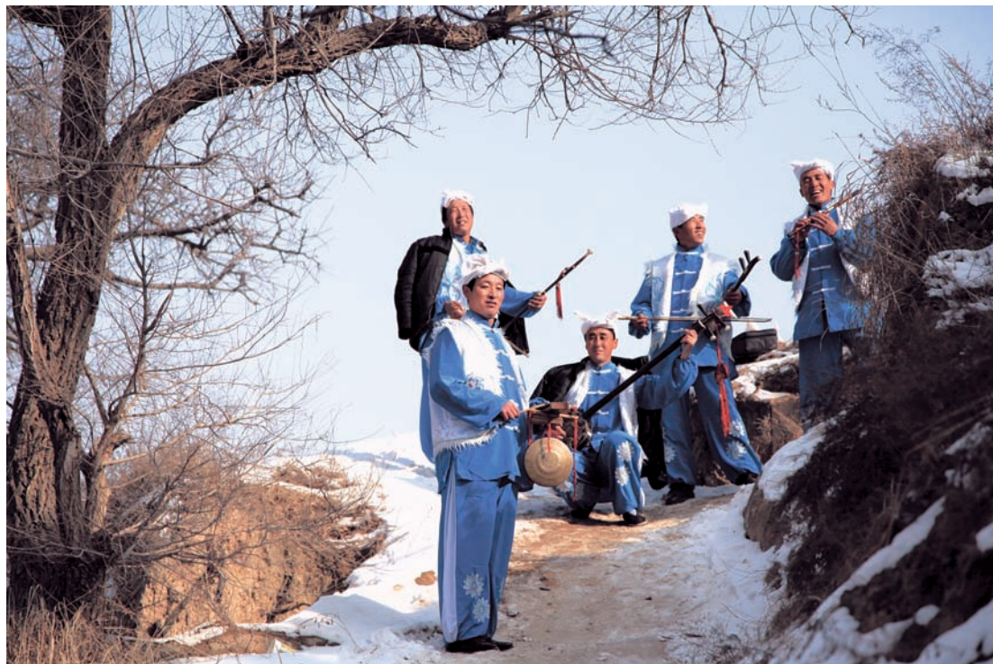
甘肃省非物质文化遗产南梁说唱传承人