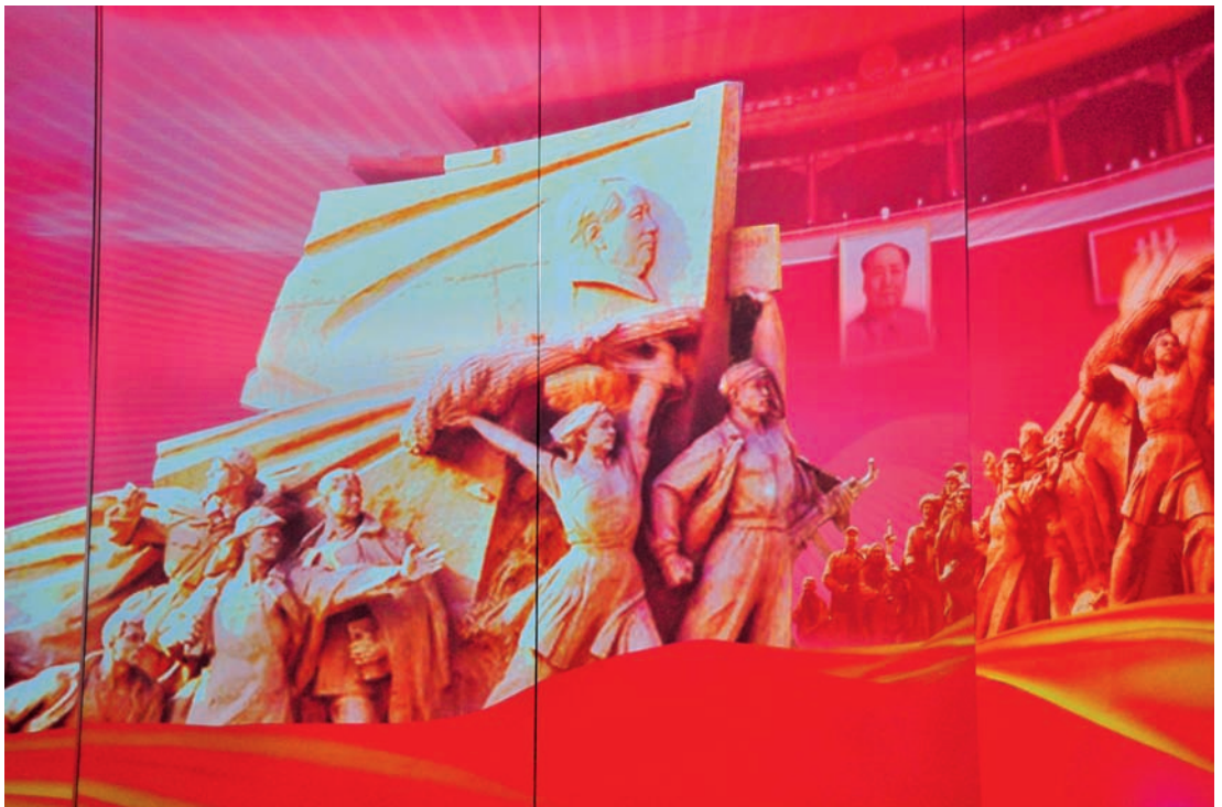
南梁革命纪念馆尾厅环幕《梦起南梁》场景之一