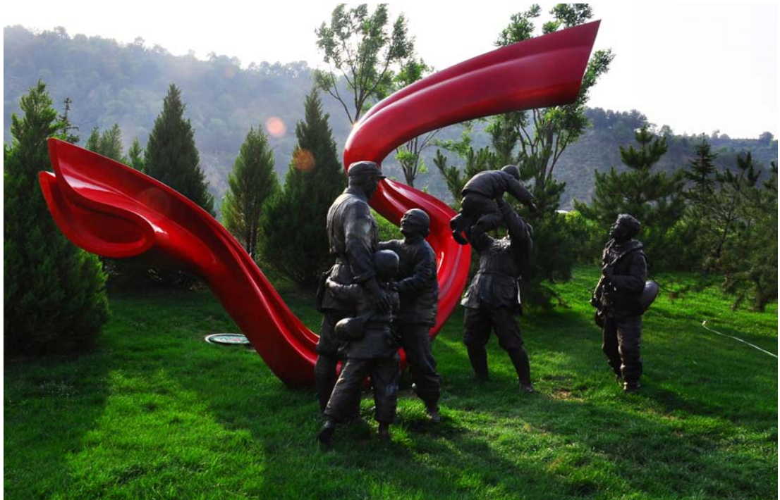
南梁革命纪念馆广场雕塑