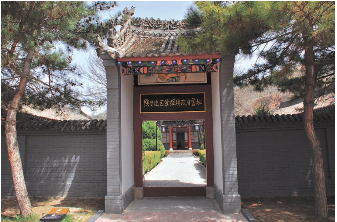
陕甘边苏维埃政府旧址