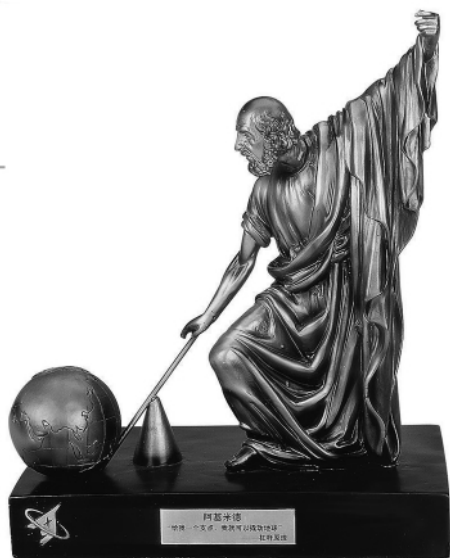
阿基米德撬动地球的雕像

阿基米德从小受过良好的教育，在他11岁时，家里就把他送到当时的世界学术中心亚历山大里亚学习。阿基米德最先是作为一个聪明