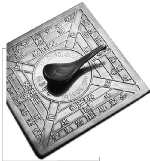
古老司南的复制模型