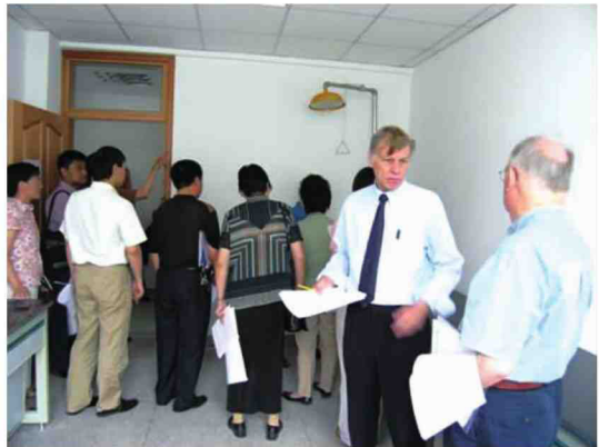
德国专家来中心考察交流