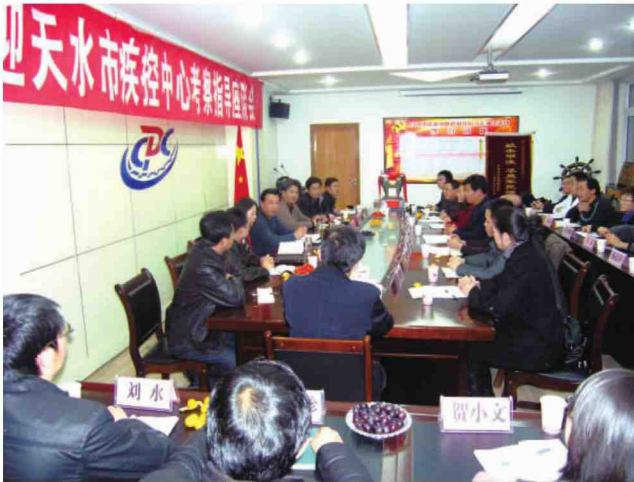
张掖市疾控中心来中心考察交流