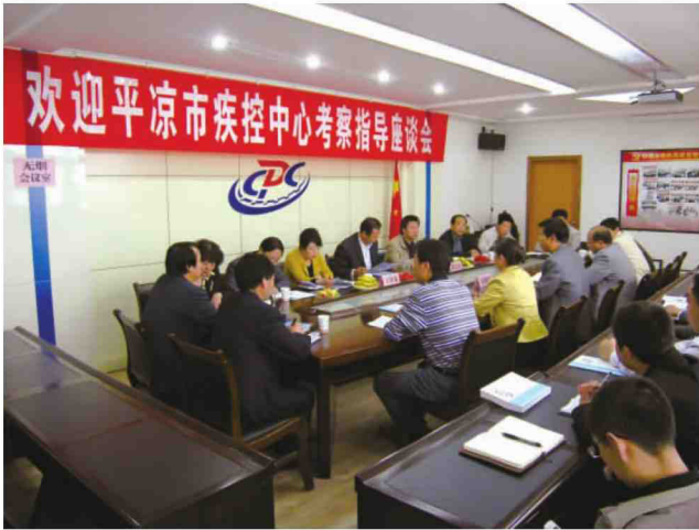
平凉市疾控中心来中心考察交流