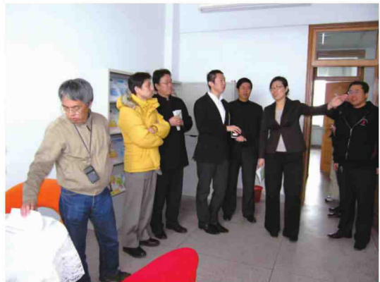
日本专家来中心考察交流