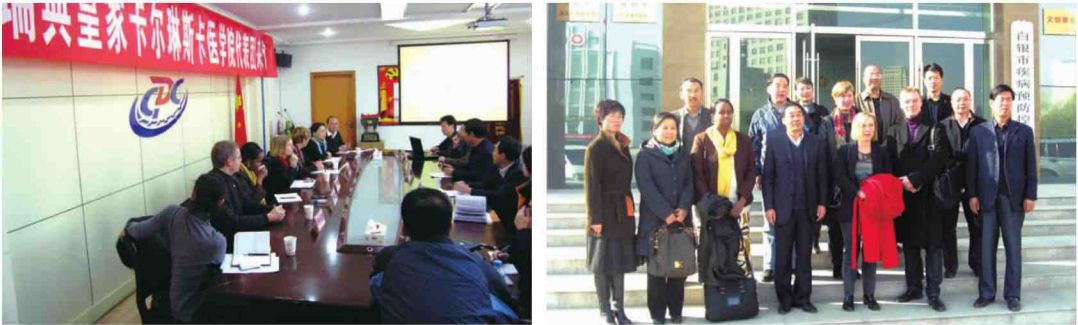
瑞典皇家卡尔琳斯卡医学院代表团来中心考察交流