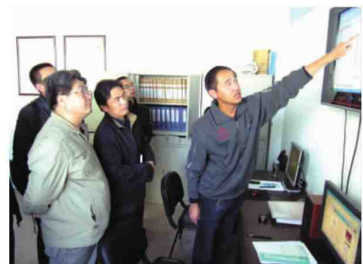
传防科科长介绍工作