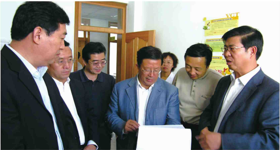
2006年甘肃省人民政府副省长李膺莅临中心视察指导