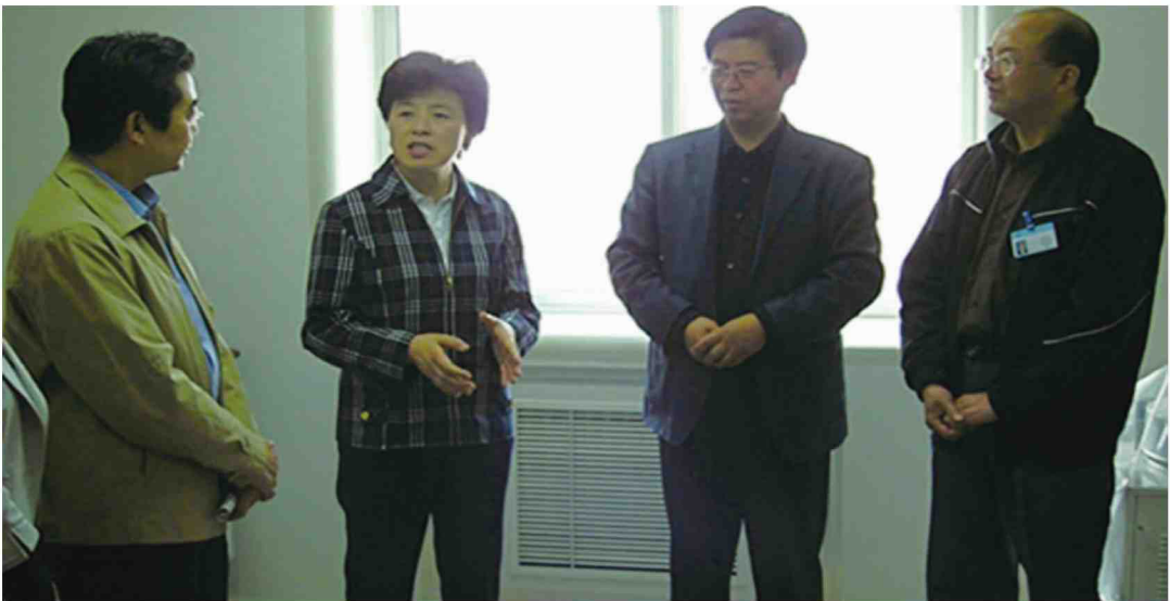
2009年甘肃省人民政府副省长咸辉莅临中心视察指导