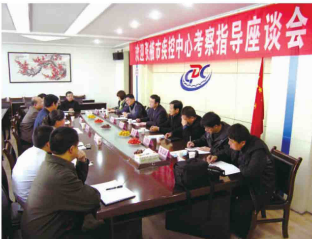
天水市疾控中心来中心考察交流