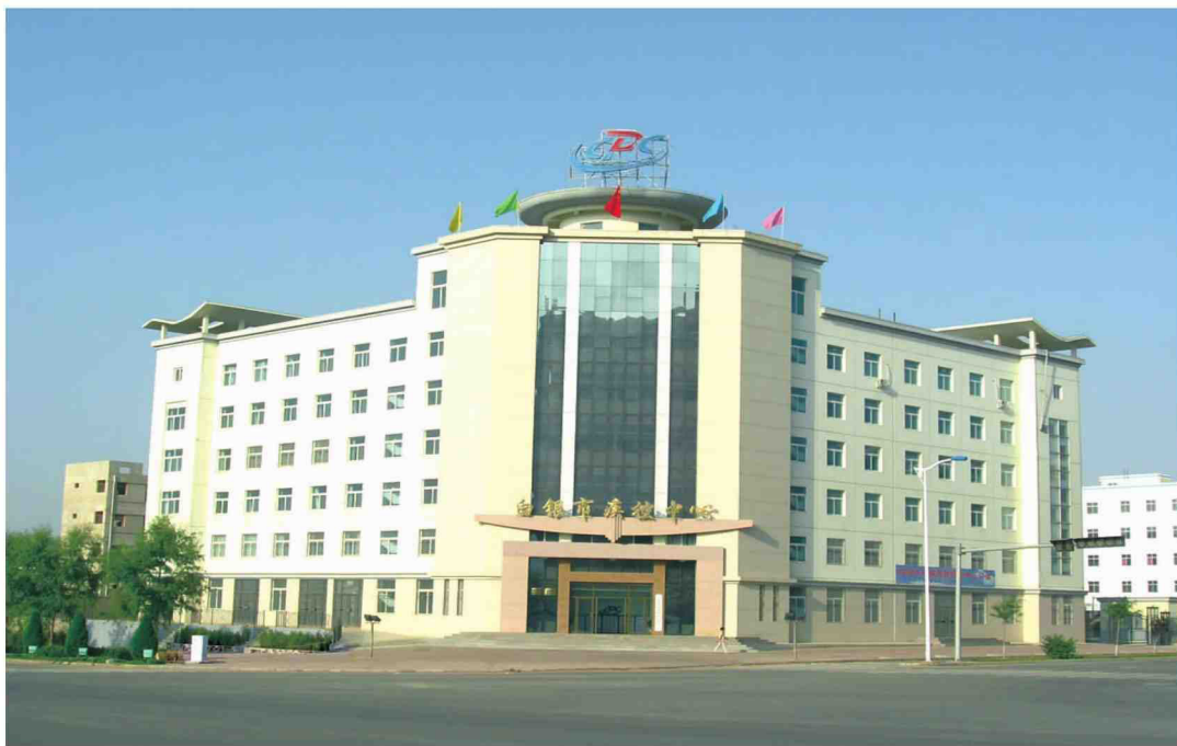
白银市疾控中心综合业务楼

综合业务楼建设时,白银市疾控中心严格按照标准实验室建设规范要求布局设置中心实验室,并且通过依托中央财政和省、市支持,积极争取国际、国内各类合作项目,特别是争取到中德财政贷款 83 万欧元项目支持以及自筹资金等多种方式,用于实验室建设、实验室生物安全和公共卫生检验检测仪器设备不断得到添置和补充,实验室能力得到加强。目前,中心共拥有 11 个专项实验室,并通过省级计量认证,检验检测技术成熟先进,通过强化内部建设、完善各项管理制度,加强质量体系规范化建设,大大增强了实验室的安全管理。中心实验室已成为甘肃省市州一流实验室,为疾控工作持续发展提供了强有力的技术支持。