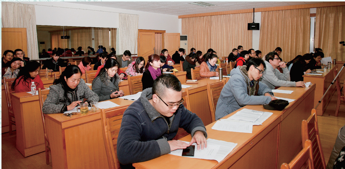
广西壮族自治区博物馆第六届学术研讨会会场盛况（二）