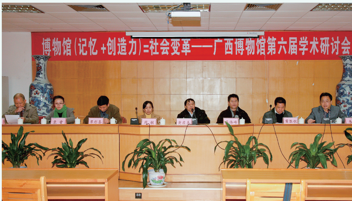
广西壮族自治区博物馆第六届学术研讨会开幕式主席台现场