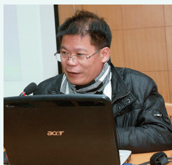
潘汁馆员做学术报告。