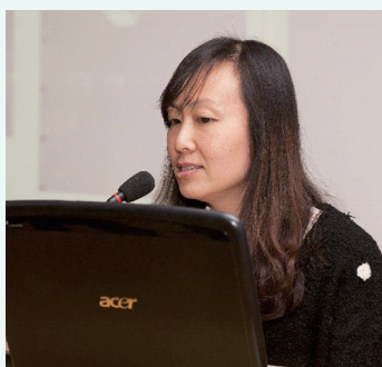
黄露馆员做学术报告。