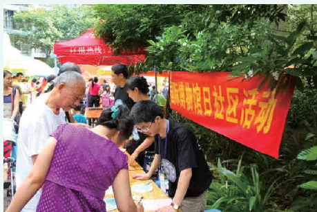
2013年5月18日，广西壮族自治区博物馆文物宣传队到锦绣江南小区开展文物图片展示宣传活动。