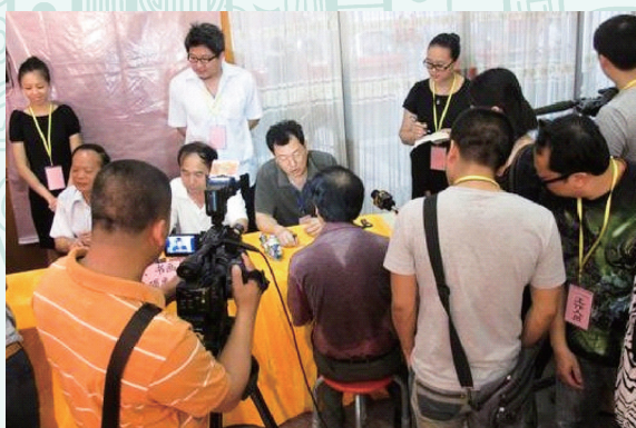
文物专家与文物收藏爱好者鉴赏玉石类藏品。