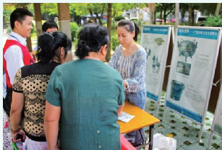
2013年9月28日，广西壮族自治区博物馆文物宣传队到新竹小区开展文物图片展示宣传活动。