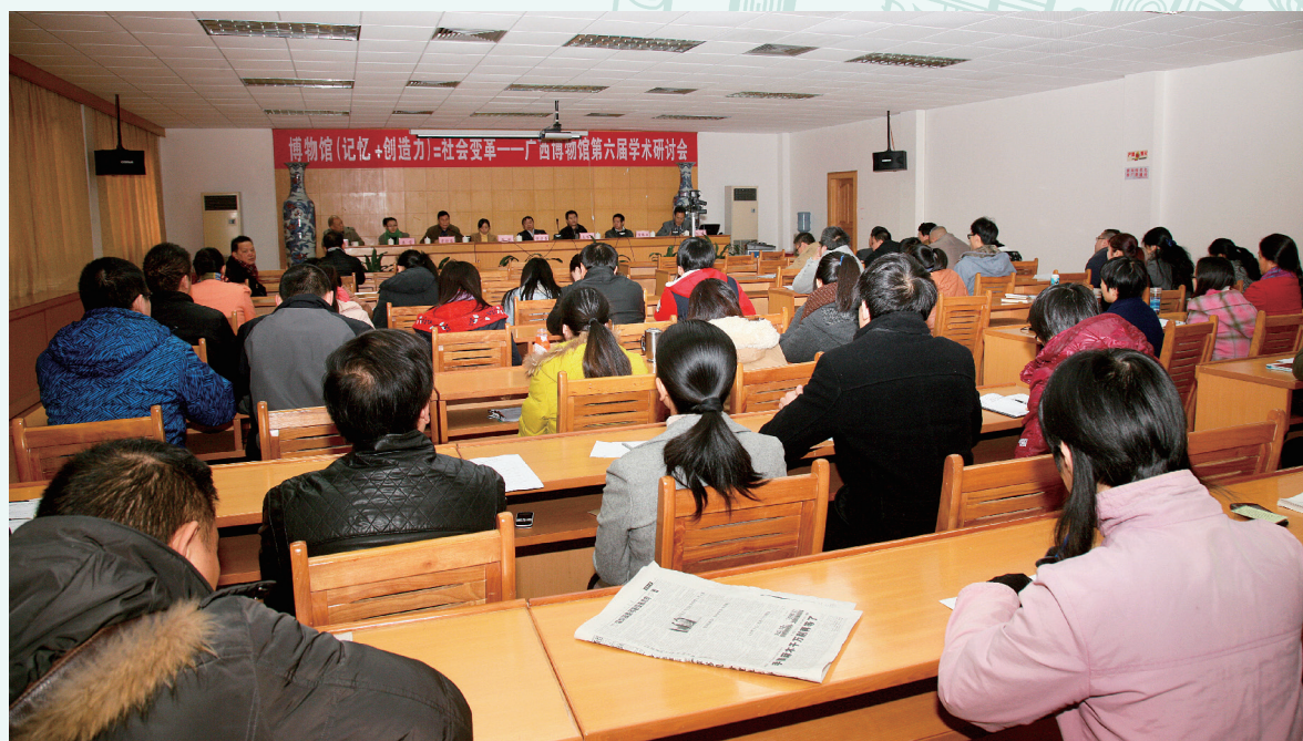
广西壮族自治区博物馆第六届学术研讨会会场盛况（一）