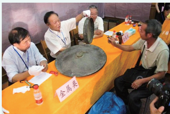
文物专家与文物收藏爱好者鉴赏金属类藏品。