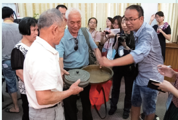
文物收藏爱好者进行现场鉴赏交流。