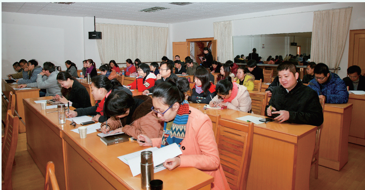
广西壮族自治区博物馆第六届学术研讨会会场盛况（三）