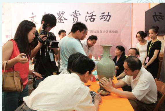
文物专家与文物收藏爱好者鉴赏陶瓷类藏品。