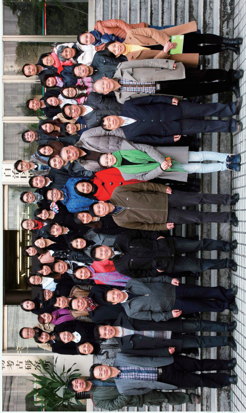
2013年广西壮族自治区博物馆第六届学术研讨会与会人员合影留念