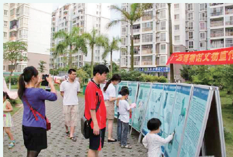
2013年4月20日，广西壮族自治区博物馆文物宣传队到在水一方小区开展文物图片展示宣传活动。