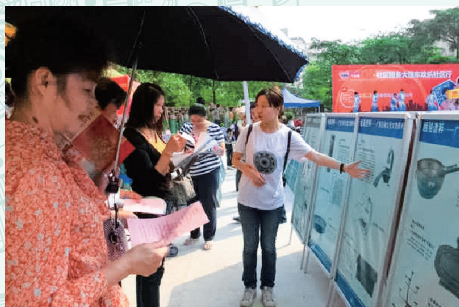
2013年3月30日，广西壮族自治区博物馆文物宣传队到新新家园小区开展文物图片展示宣传活动。