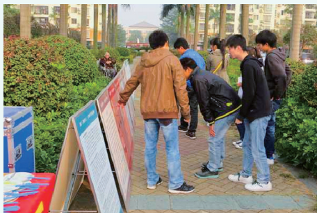
2013年12月7日，广西壮族自治区博物馆文物宣传队到金湾花城小区开展文物图片展示宣传活动。