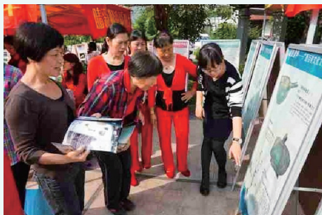
2013年10月28日，广西壮族自治区博物馆文物宣传队到葛村路石油小区开展文物图片展示宣传活动。