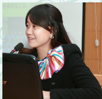
何乐思做学术报告。