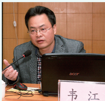
韦江研究馆员做学术报告。