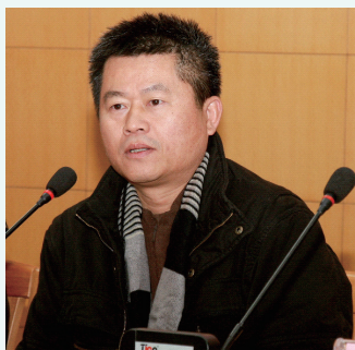
吴伟峰 (广西壮族自治区博物馆馆长)