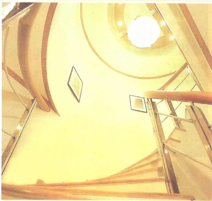
SPEND MONEY AT MAIN POINT