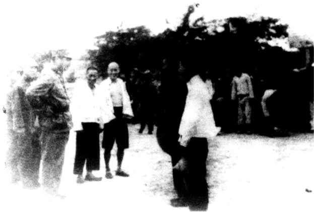
1938年6月16日，爱国将领冯玉祥在接官厅向民众宣传抗战救亡道理，其间当地联保主任王耀九送胞弟当兵，左一为冯玉祥。