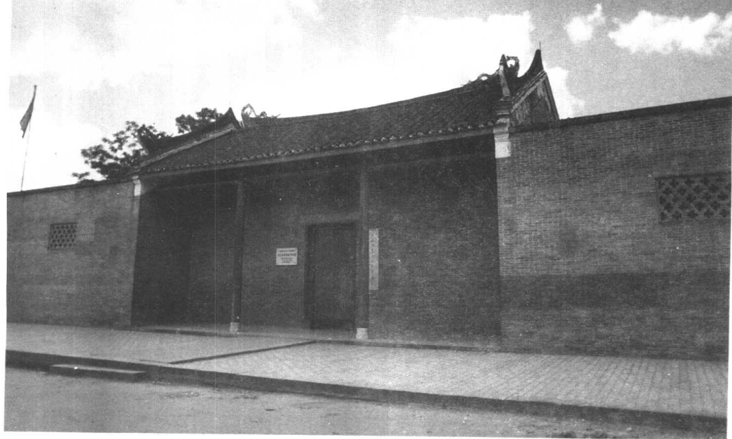
右江苏维埃政府旧址——恩隆县平马镇正学堂