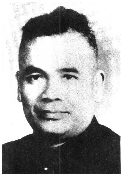
中共右江特委书记，右江 苏维埃政府主席雷经天