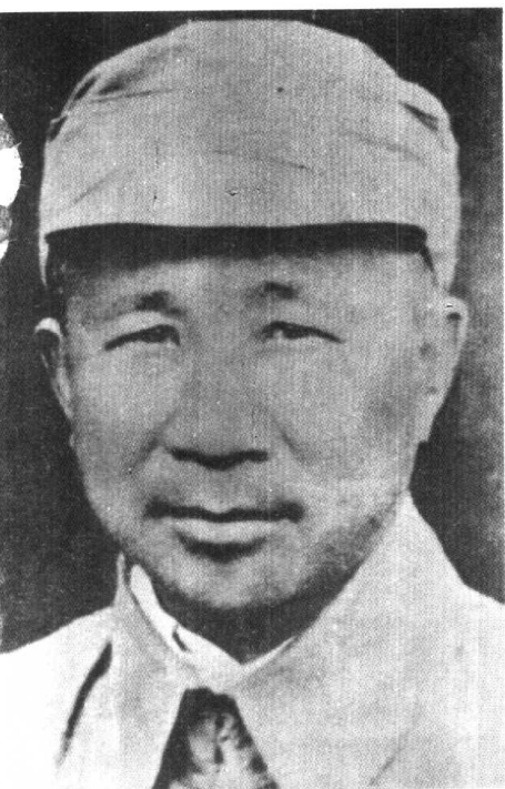
红七军军长张云逸