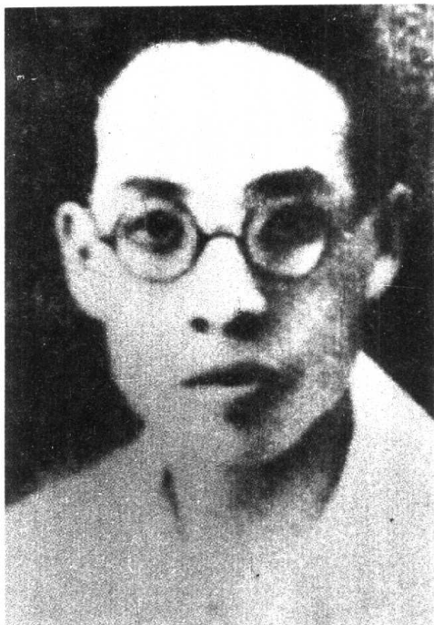
红七军政治部主任陈豪人