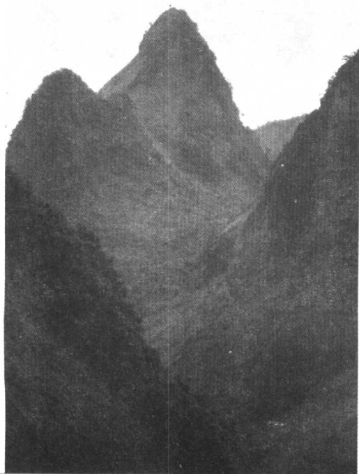
天峨县甘孟岭 战斗地点