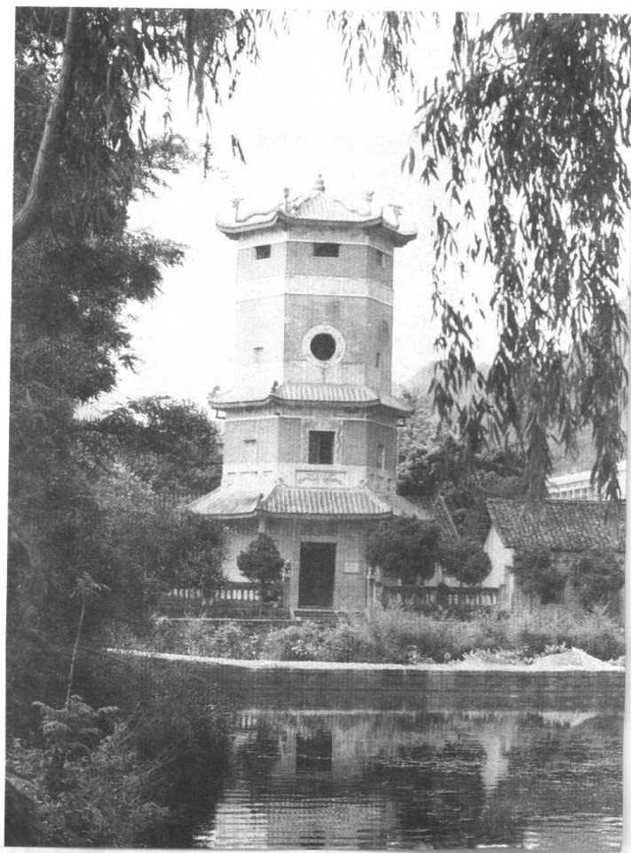
东兰县武篆魁星楼—— 红七军军部和右江苏维埃政府曾在此办公