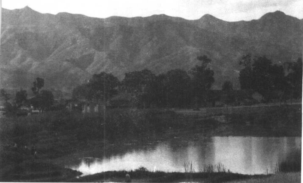
红七军与中央红军在江西省于都县桥头镇会师地点