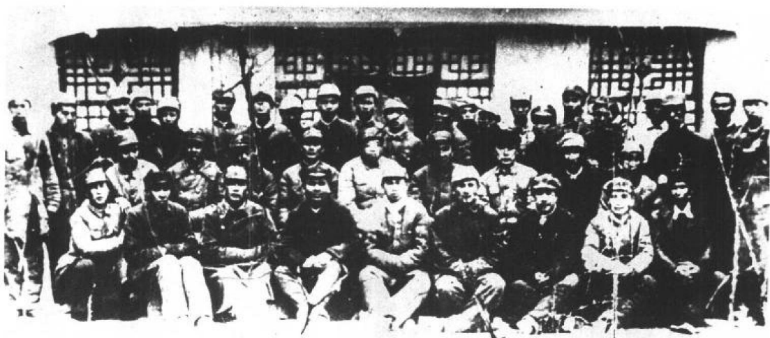
1945年朱德、彭德怀、陈毅等领导同志与在延安的红七军部分指战员合影：第一排左起：谢扶民、袁任远、陈漫远、雷经天、李天佑、谭余保、叶季壮、黄雨山、韦权；第二排左起④邓发⑤彭德怀⑥朱德⑦陈毅⑧云广英；后排左起①韦家规②乐少华③黄超⑤卢永克⑥李志明⑦覃延年⑧韦祖直⑩袁平；右起①陆秀轩②黄征、③莫文骅⑤吴西⑥文年生。