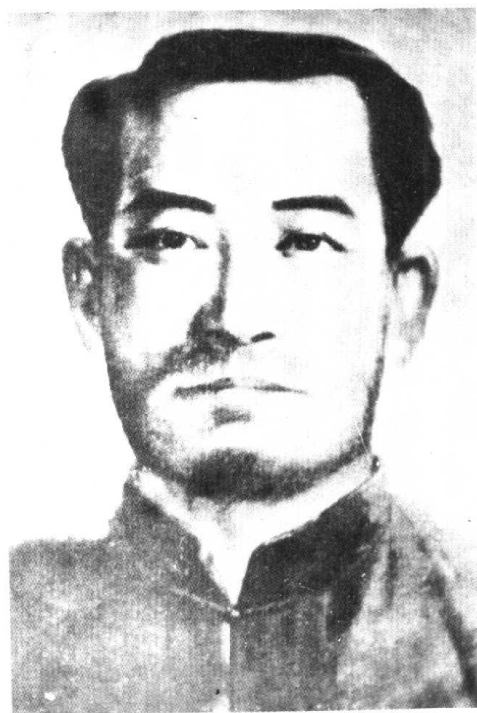
红七军二十一师师长，中华 苏维埃共和国临时中央政府 执行委员会韦拔群