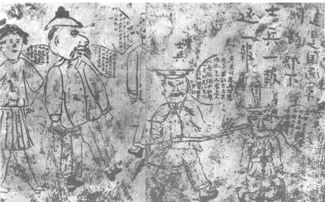
红七军在河池宿营地留存的宣传漫画