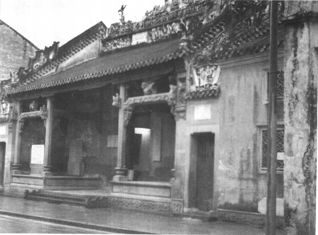
中国红军第七军军部旧址——百色粤东会馆