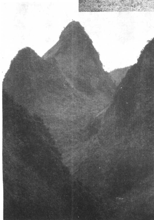
天峨县甘孟岭 战斗地点