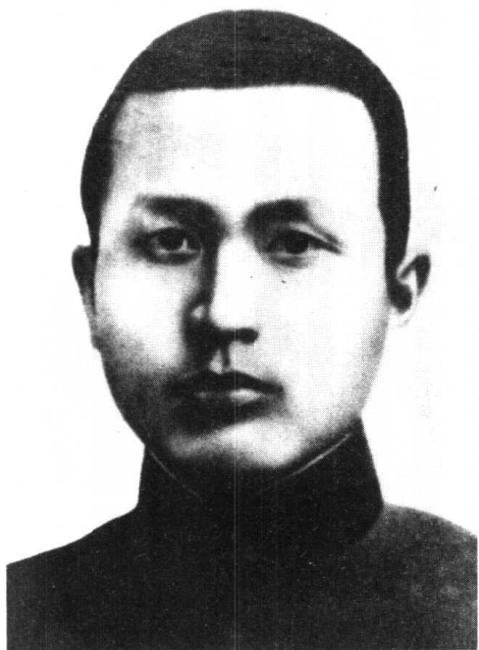
红七军红八军总指挥李明瑞