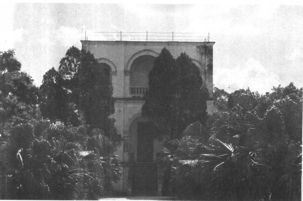
中国红军第八军司令部旧址——龙州瑞丰祥金库