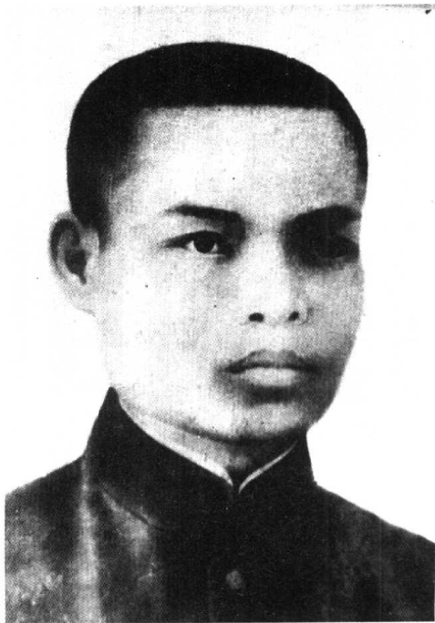
红八军军长俞作豫