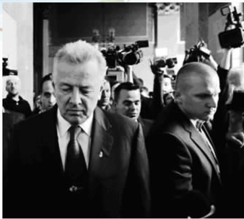
2012年4月2日,宣布辞职后的匈牙利总统施密特·帕尔黯然走出总统办公室。

一篇论文逼退一位总统。匈牙利泽梅尔魏斯大学认定匈牙利总统施密特·帕尔20年前的博士论文纯属抄袭,因此剥夺他的博士学位。一周后,施密特宣布辞去总统职位。