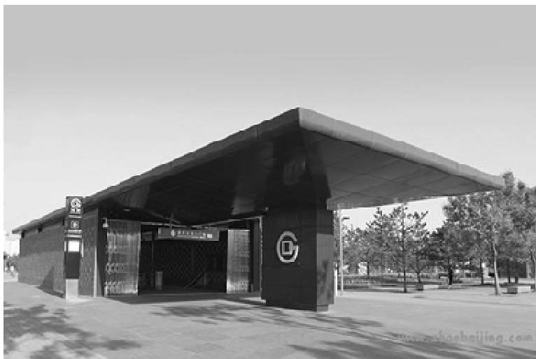
图 1-1 北京地铁车站

快捷、大运量是城市轨道交通的主要特点，线状构筑的轨道交通线路上的节点为载运乘客的轨道交通车辆提供了停靠点，这个节点就是轨道交通的车站（见图 1-1），为乘客提供上、下车与候车服务。地铁车站的设计要满足安全、迅速、方便组织乘客进出的特点，还要彰显出城市或区域的文化特点。本任务主要介绍了车站的基本组成、分类和功能，以及车站运营设备和设施的概况。