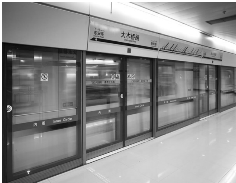
图 1-9 地铁屏蔽门

城市轨道交通站台安全门系统，安装于地铁、轻轨等交通车站的站台边缘，将轨道与站台候车区隔离，设有与列车门相对应，可多级控制开启与关闭滑动门的连续屏障，简称屏蔽门（见图 1-9）。