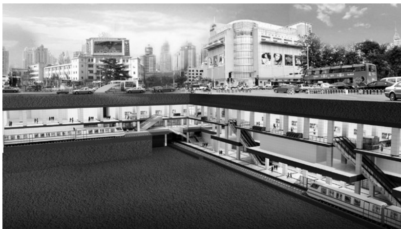
图 1-5 地下车站

地下车站除了其结构的特点以外，在防火、防灾及环控方面还有更特殊的要求，与地面站和高架站有着显著的区别。