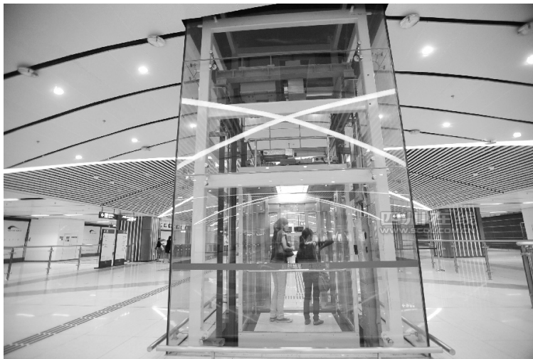
图 1-8 电梯

根据无障碍设计要求，在车站内，站厅层至站台层之间宜设垂直电梯，以方便残疾人及携带重行李的旅客通行。电梯的结构组成部分，可分为机械装置与电气控制系统两大部分。其中，机械装置包括曳引系统、导向系统、轿厢系统、重力平衡系统、厅轿门和开关门系统、机械安全保护系统等；电气控制系统主要包括控制柜、操纵箱等十多个部件和几十个分别装在各有关电梯部件上的电器元件。