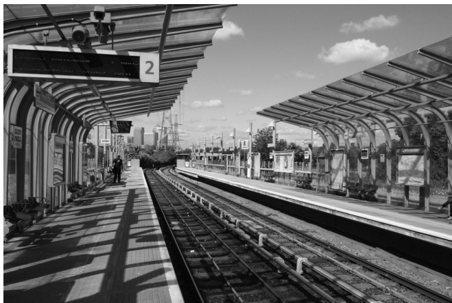
图 1-3 地面站

造价比较低，但会对轨道交通线路所经过区域造成分割，一般修建在用地面积受限制的区域。尤其是在城市中心范围内，已有的地面建筑往往难以改变，地面空间资源又十分有限。因此城市轨道交通车站常设置于地下或地上，其造价比地面站高。