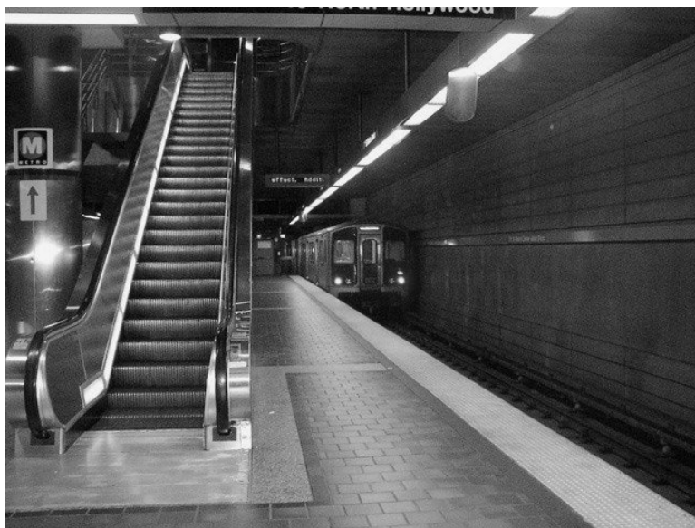
图 1-7 自动扶梯

在城市轨道交通车站中，自动扶梯的用途主要是解决乘客的快速疏散，即列车到达后，大量的乘客从候车站台向地面站厅疏散。由于车站的候车站台一般距离地面 5~7 m（浅埋式），甚至 7~10 m（深埋式），乘客上下只能依赖于楼梯，而自动扶梯则提供了一种自动输送乘客的能力，满足了乘客对乘降度的要求。自动扶梯是一台链式输送机 and 两台胶带式输送机组合而成的升降传送系统，用于在建筑物的不同楼层间连续运载人员上下。由于其结构特殊，无论从造型还是从工作特性都与单一的链式或胶带式输送机有很大的区别。