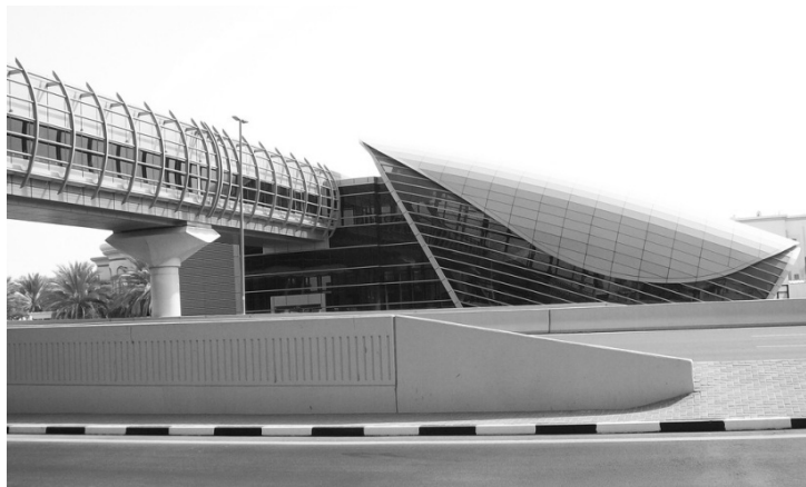
图 1-4 高架站

高架线路一般位于中心城外的地面上，其建筑风格应与周围环境相协调。高架线路一般建于城市道路的中心线，也可设置在绿化隔离带，从人行道进入高架车站的楼梯、天桥，之间可用作过街人行天桥之用。为了节省车站周边的地面资源，并充分利用线路与地面之间的垂直空间，高架站多采用双层设计，站台层在上方，站厅层在下方，也可以利用高架桥下的站外广场。由于设置在地面上，可不考虑环控系统。