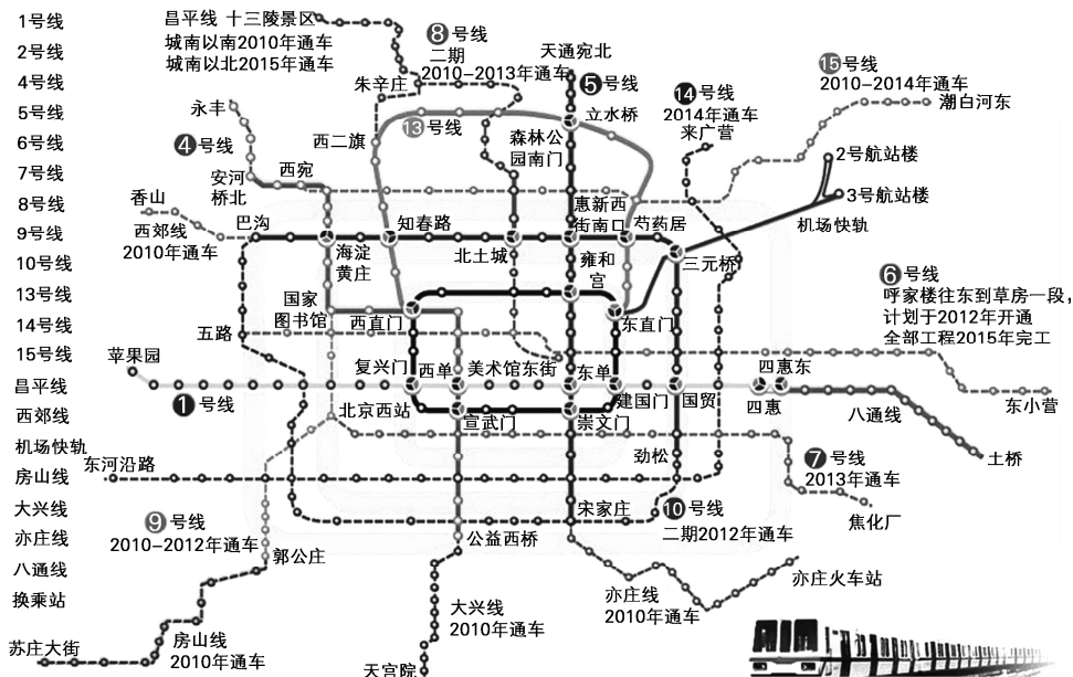
图 1-6 北京地铁线路

终点站是设在线路两端的车站。就列车上、下行而言，终点站也是起点站（或称始发站），终点站设有可供列车全部折返的折返线和设备，也可供列车临时停留检修。如线路远期延长后，则终点站变为中间站。图 1-6 为北京地铁线路图，图中对各相关作用站标注清晰。