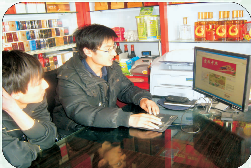
客户经理上门为卷烟零售户开展网上订货指导