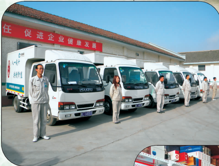
卷烟送货车辆整装待发