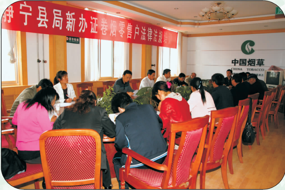
新办证卷烟零售户法律法规培训