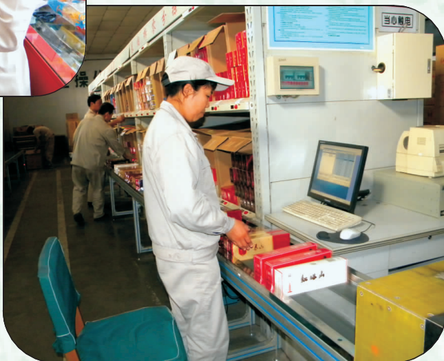
配送中心卷烟分拣线