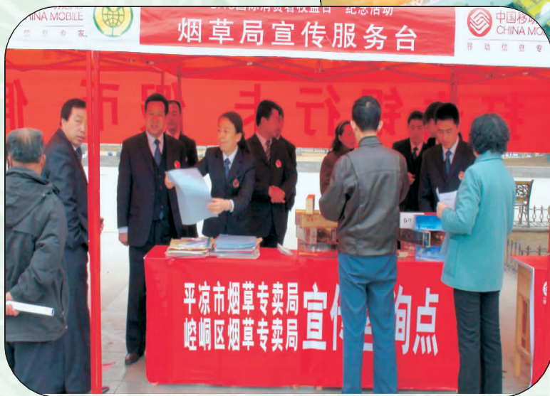
“3·15”专卖人员宣传烟草专卖法律法规