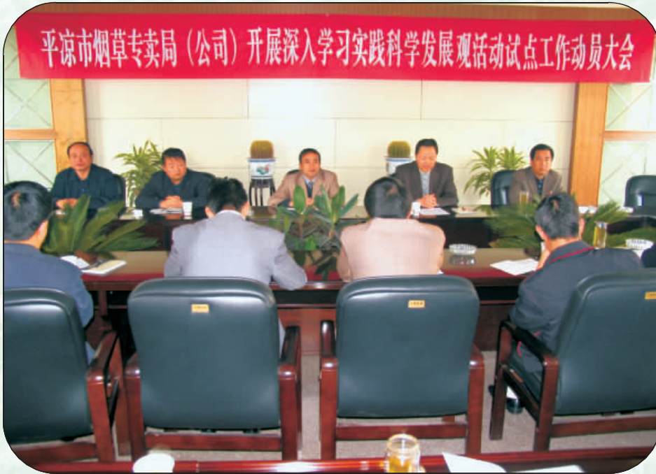
深入学习科学发展观活动试点工作动员大会