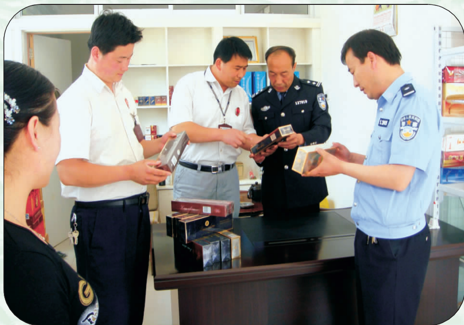
专卖人员与公安人员联合开展市场检查