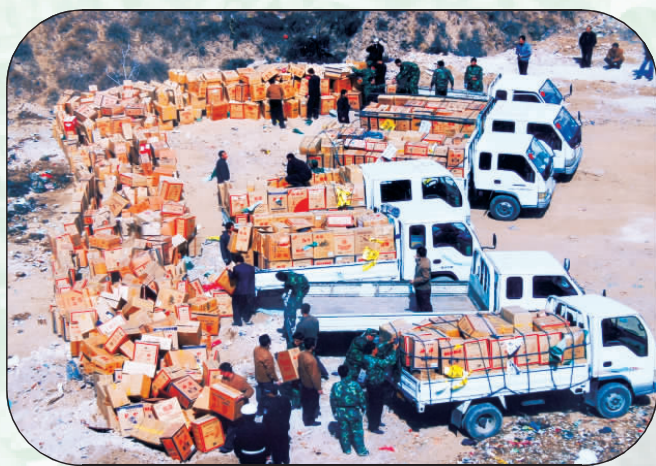
准备销毁的假冒卷烟