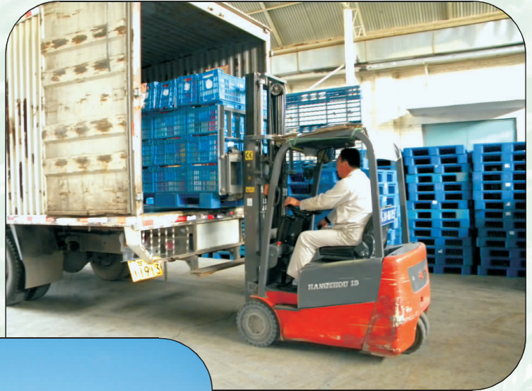
中转车辆装载卷烟