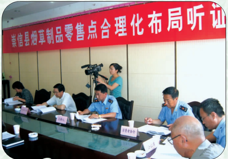
卷烟零售户合理化布局听证会