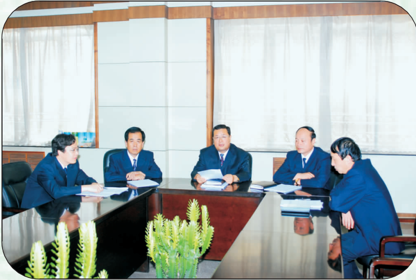
平凉市烟草专卖局(公司)班子成员研究部署全年工作