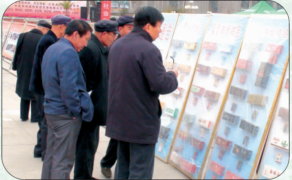
消费者观看假冒卷烟样品