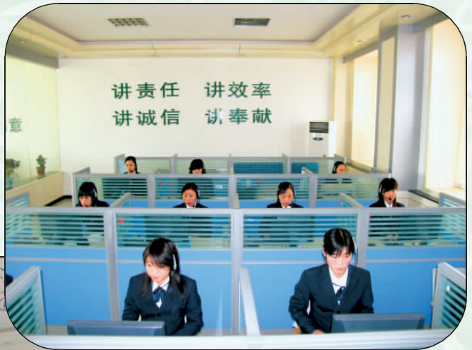
卷烟电话订货服务