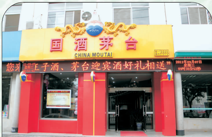
平凉欣大公司国酒茅台专卖店