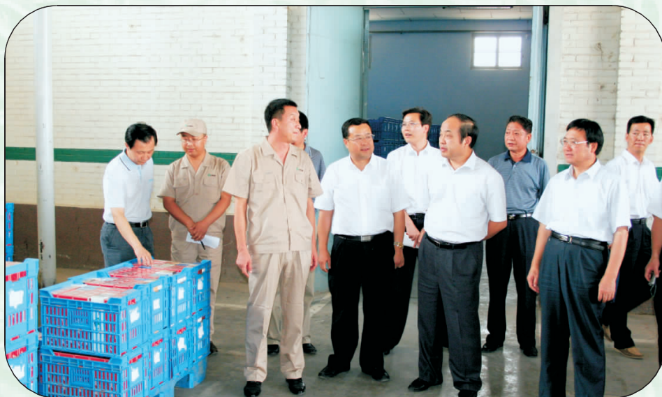
2009年8月4日,国家烟草专卖局副局长何泽华(前排右二)检查平凉市烟草专卖局(公司)配送中心。后排右二为甘肃省烟草专卖局(公司)副局长周孝贤,后排左一为甘肃省烟草专卖局(公司)副总经理张威,前排右一为中共平凉市委常委、平凉市副市长邓晓龙