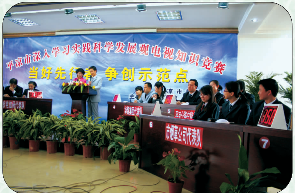
参加平凉市科学发展观电视知识竞赛