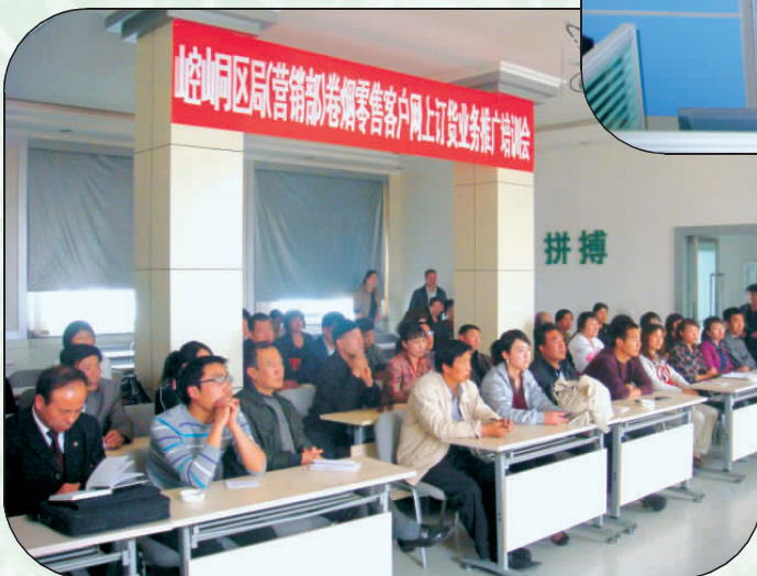
卷烟零售户网上订货培训