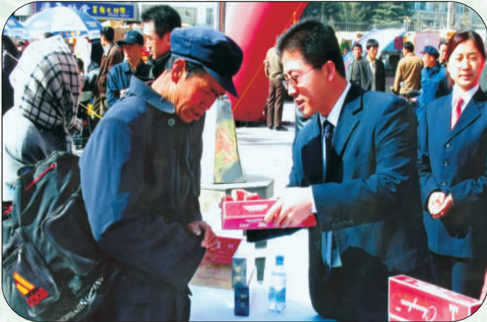
专卖人员讲解假冒卷烟的识别方法