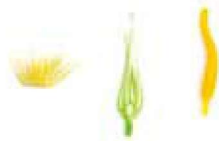
● 睡莲、马蹄莲、 百合花蕊