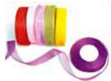
● 2cm 雪花丝带