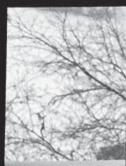
古楼外的现代与繁华