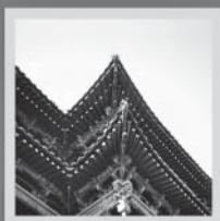
城市风景线上的风景：清远楼·镇朔楼·拱极楼