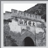
张家口：宣化曾经的草根城市