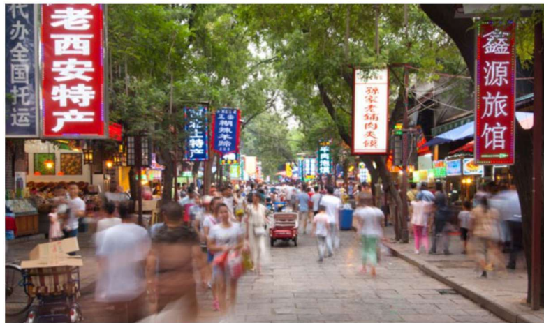
○ 回民街景