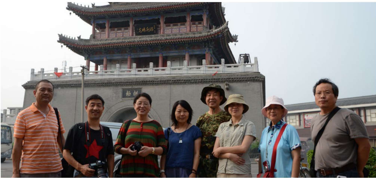
○ 我们的团队从户县钟楼下出发

收回视线，我的眼眶有些湿润，为了那百十年前的离别，为了一群农家子弟破茧式的寻求而激动。