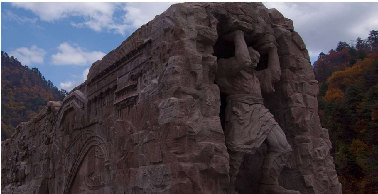
○ 秦岭休息站的石雕