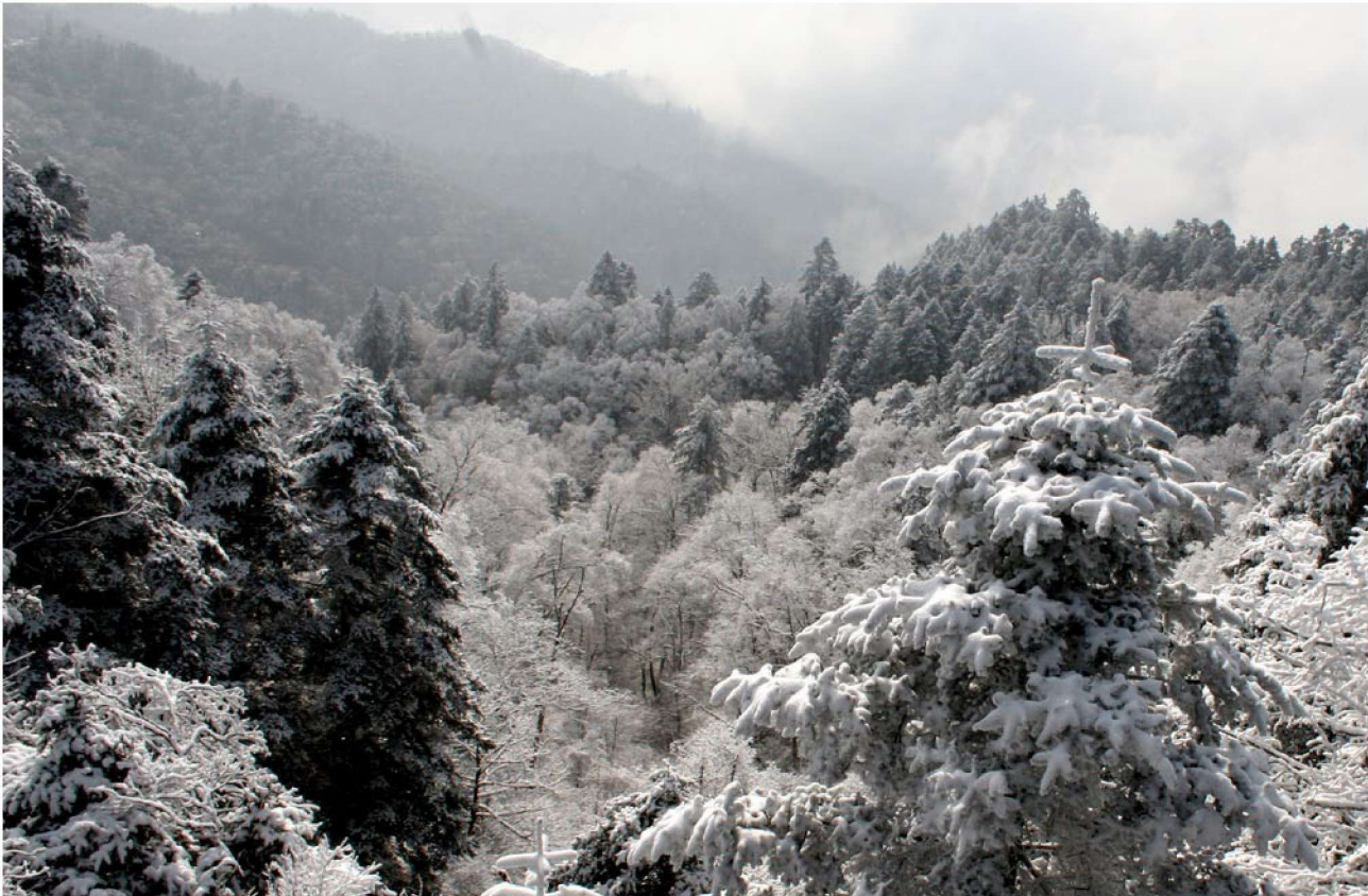
○ 秦岭冬景

然更为着李白、杜甫、岑参、贺之章，为着那“斗酒诗百篇”“骑马似乘船”的状态。有位爱好美食的朋友说，在回民街吃半个月，大概不会重样。超越岁月的热闹不唯是吃，还有看。入夜，灯火辉煌中，在鼓楼“文武盛地”大匾的罩护下，西北特产、服装饰物、文物古玩、工艺小件，各类物品，让千万人留恋于此，“夜市千灯照碧云，高楼红袖客纷纷”，分明是进入了大唐盛世，走不动了。