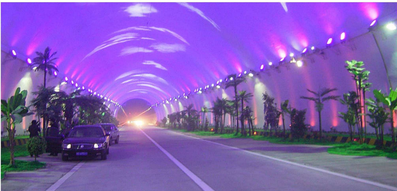
○ 秦岭 18 公里长的亚洲第一隧道