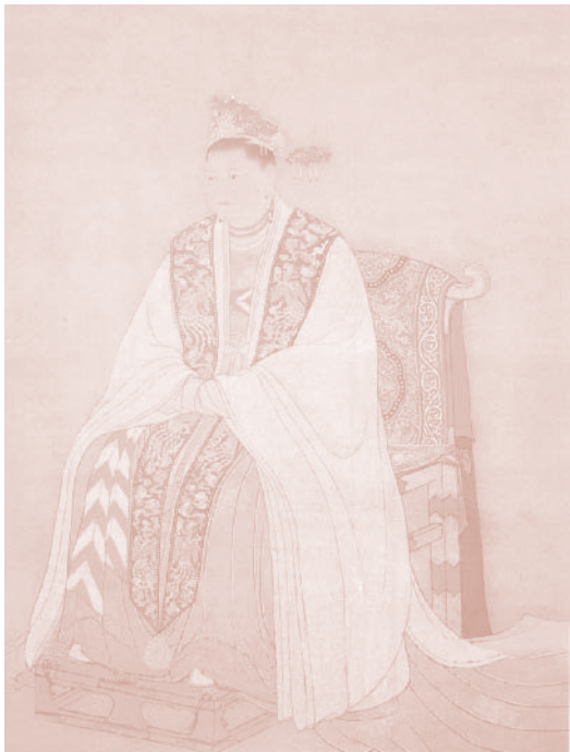
◆宋太祖赵匡胤之母杜太后像

尽管如此，在赵匡胤抓周之后，赵弘殷的心也还是几乎提到了嗓子眼儿。好在他这种担心是多余的。一年过去了，两年过去了，三年也过去了，赵匡胤在茁壮地成长着。而且，自满周过