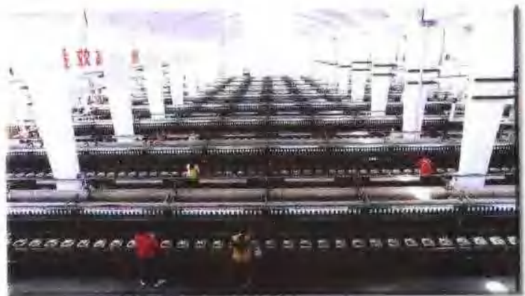
嘉兴制丝针织联合厂