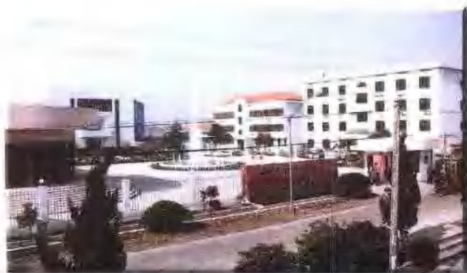
嘉兴中华化工总厂（乡镇企业）