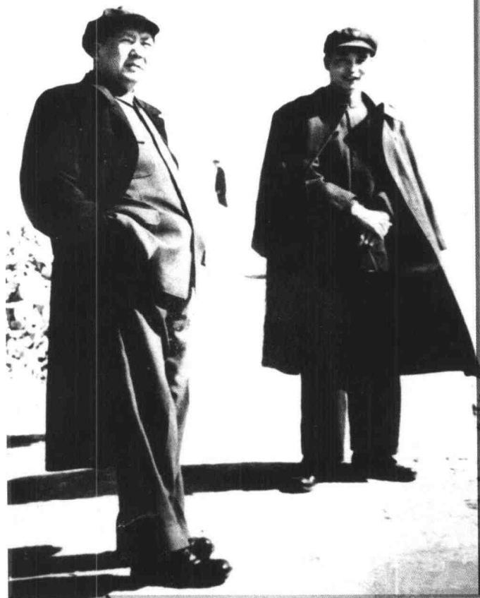
毛泽东1954年在 盐官七里庙海塘观潮

十年磨一剑，霜刃未曾试。 今日试锋刃，气色何其壮。 可怜报国心，不得报主将。 男儿生世间，及贵天所降。 壮气横宇宙，浩气隘八荒。 男儿当横行，横行当横行。 男儿当横行，横行当横行。