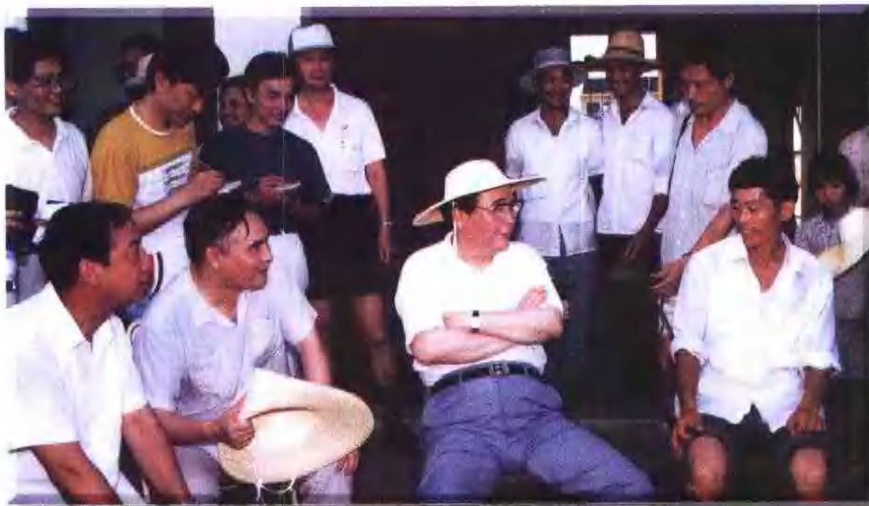
李鹏 1991 年视察嘉兴农业时与农民座谈