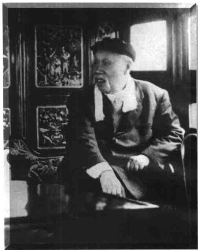
董必武1964年参观南湖革命纪念馆

经年不放酒杯宽， 晓夜正寒，有尔嘉话大上正。 感时怒马向域中看。 柳易冠，痛矣狂吹俱未足， 河山谁逐试边。 体比仙儒与生成才时 周至朱