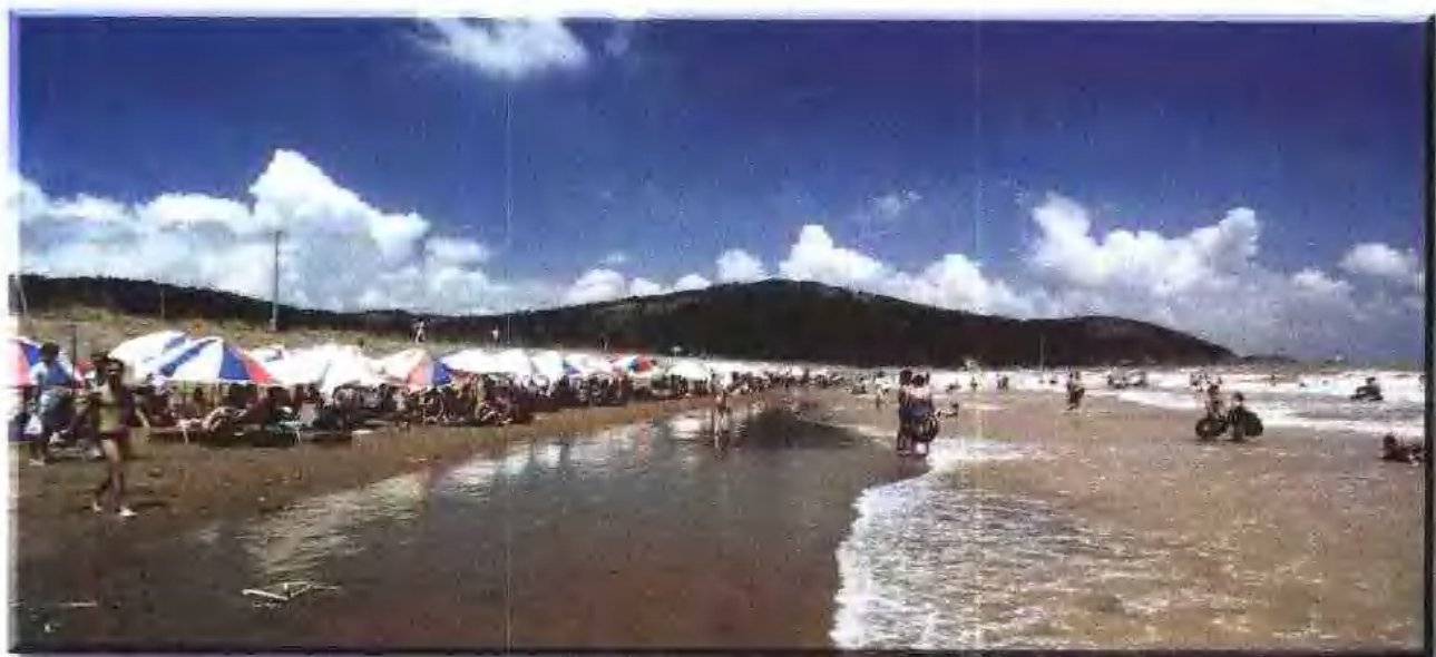
平湖 九龙山海滨浴场