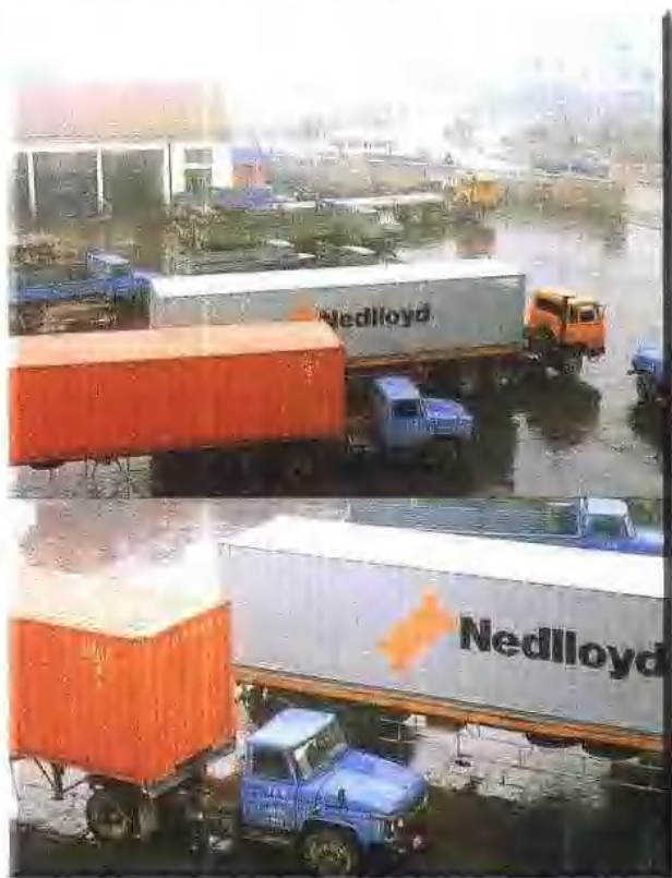
嘉兴国际集装箱运输中转站