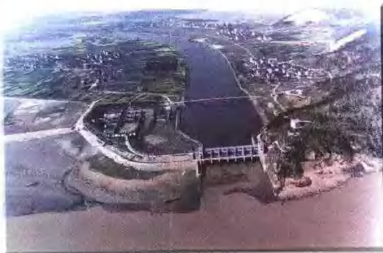
南排出海工程长山闸