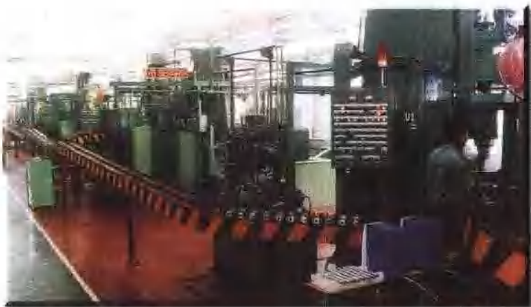
中外合资加西贝拉压缩机有限公司