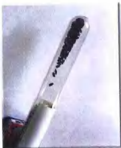
罗家角出土的距今七千年的 古代稻谷