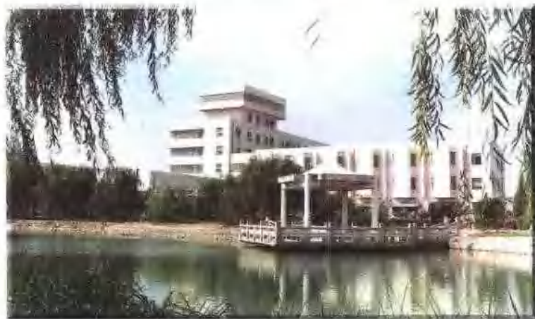
电子工业部第36研究所