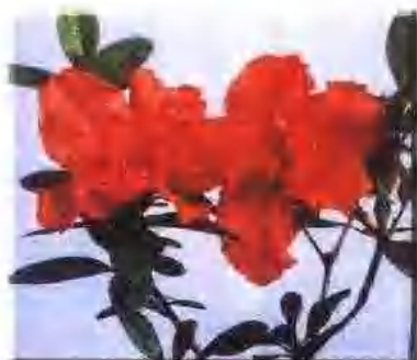
市花 杜鹃花、石榴花