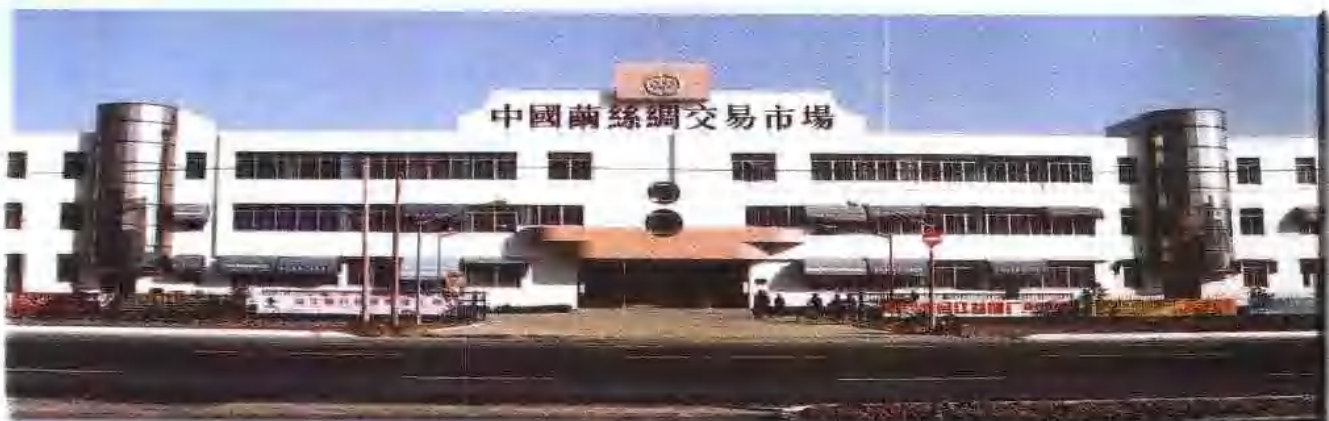
中国茧丝绸交易市场