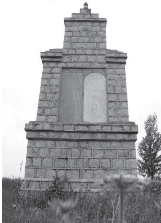
石梁河暴动遗址纪念碑