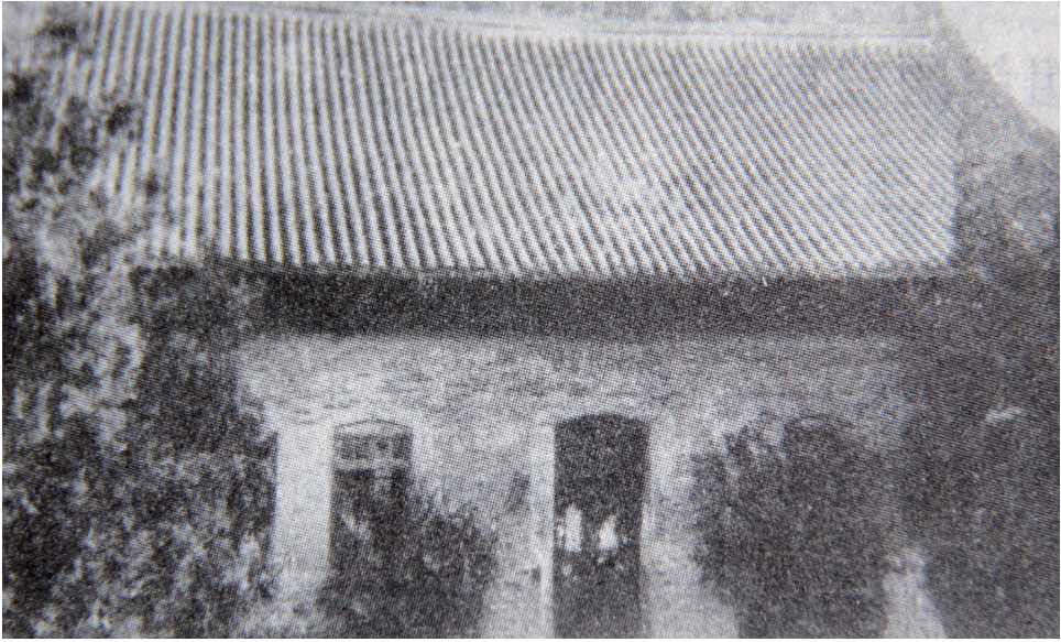
宿迁农民武装暴动指挥部旧址