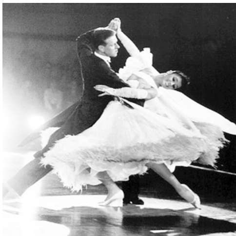
体育舞蹈之标准舞(华尔兹舞)

“体育舞蹈”具有广义和狭义之分，广义的“体育舞蹈”通常是泛指有一定健身功能的各种表现形式的舞蹈，例如健身民族舞、交谊舞、流行舞蹈等；而狭义的“体育舞蹈”是指具有西方文化内涵的、由英国皇家舞蹈教师协会整理规范的、具有较强竞技性、国际性的双人舞蹈。