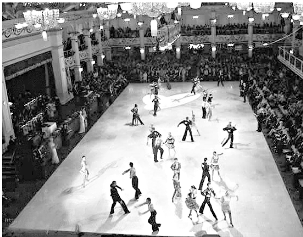
英国黑池舞蹈节现场

育舞蹈高手们将在此汇聚,一起进行比舞、切磋和交流。其中除了为期一周的体育舞蹈比赛以外,还包括了黑池前的多场热身赛,大师研讨会、世界性国际标准舞会议、舞蹈服装以及舞蹈用品汇展等。它是体育舞蹈界的最大盛会,同时也代表了世界体育舞蹈的最高水平。因此,英国的黑池已成为体育舞蹈的圣地。