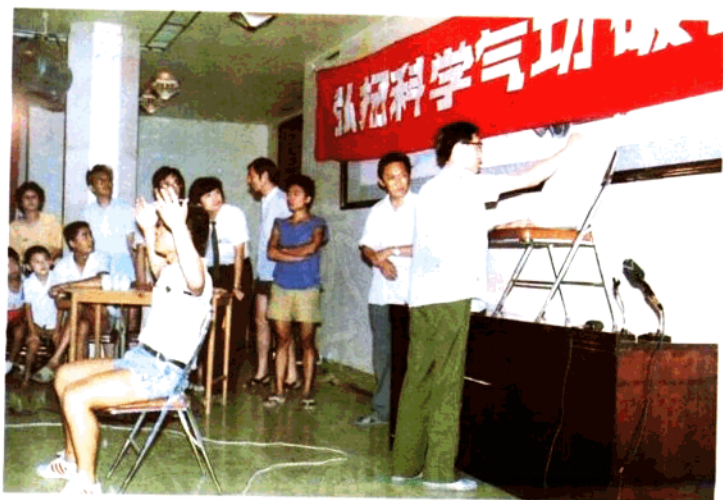
司马南在弘扬气功科学破除封建迷信报告会上表演“传心术”——意念感知黑板上的信息。