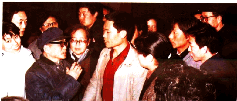
作者与气功学员切磋技艺