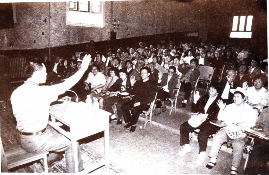
司马南向笃信气功外气的朋友讲解心理暗示的道理。