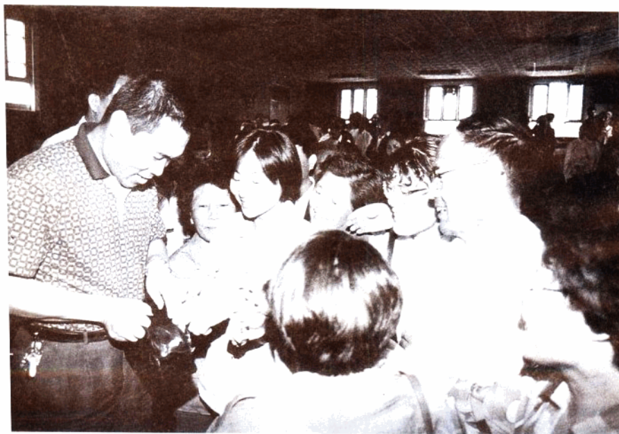
司马南一再说明自己没有神功，气功圈里的朋友对他依然抱有浓厚的兴趣，总觉得有点神异。