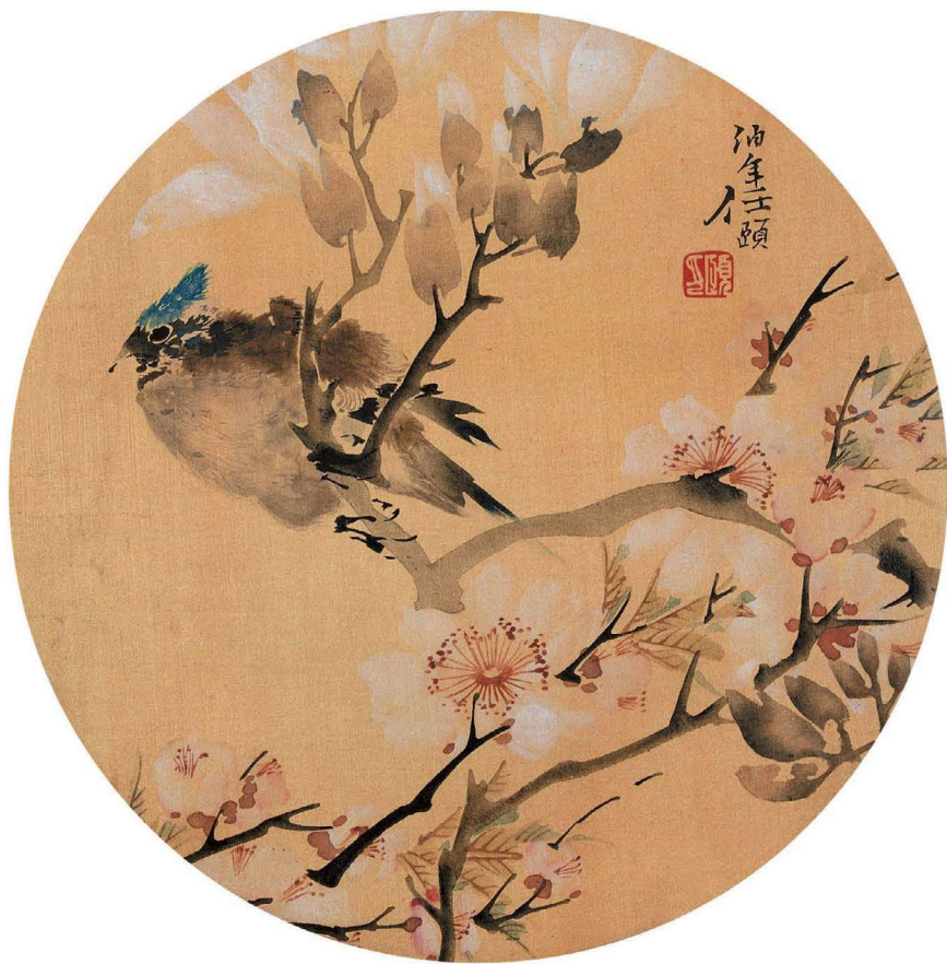
菊花 玉兰春禽 镜心