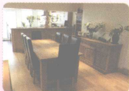
5 dining room 餐厅