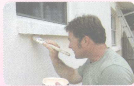
12 paint [peɪnt] (v.) 粉刷 (n.) 油漆