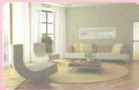
4 living room 客厅