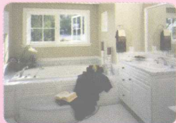
7 bathroom ['bæθru:m] (n.) 浴室