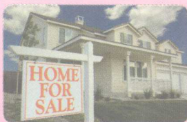
3 for sale (房子) 待售