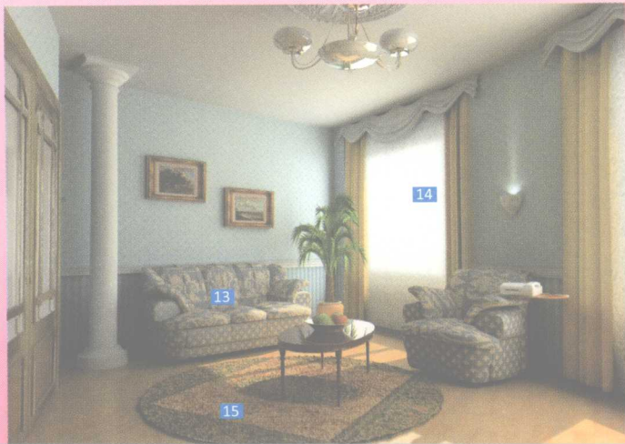
15 carpet ['kɑ:pɪt] (n.) 地毯