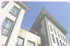
1 apartment [ə'pɑ:rtmənt] (n.) 公寓(英式为 flat)