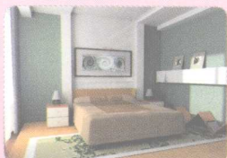
6 bedroom ['bedru:m] (n.) 卧室