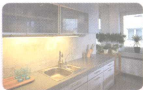
9 kitchen ['kɪtʃən] (n.) 厨房