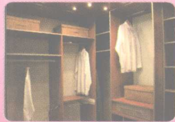
8 dressing room 更衣室