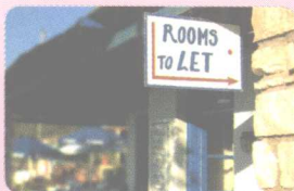
2 rent [rent]/let [let] (v.) 出租