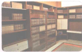
11 bookcase ['bʊkɪs] (n.) 书架; 书柜