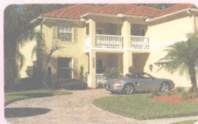
10 yard [jɑ:rd] (n.) 庭院