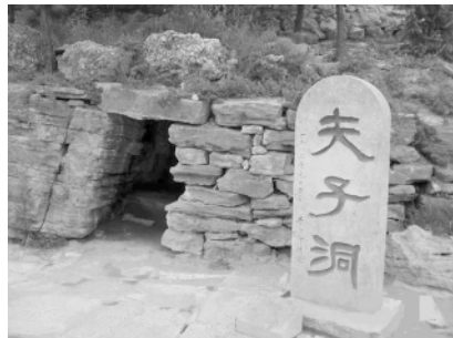
图为山东泗水尼山孔子诞生地

孔子出生时家境已经没落，但由于他刻苦好学，又喜欢琢磨思考，“我非生而知之者，好古，敏以求之者也”，“三人行，必有我师焉，择其善者而从之，其不善者而改之”，所以很年轻的时候就以博学闻名了。孔子身处“礼崩乐坏”的社会大变革时期，他的“仁政”思想与“克己复礼”的政治实践，在当时都没有获得当权者的认可。