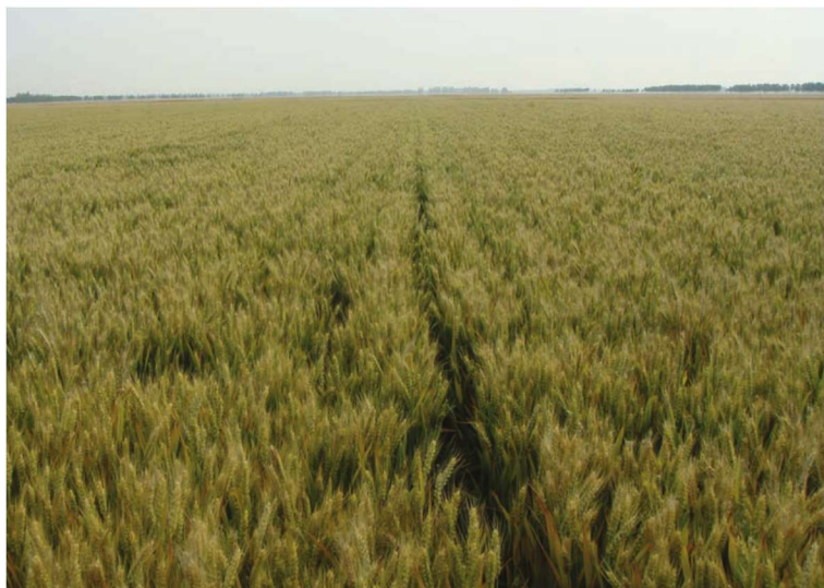
山东省郯城县整县建制小麦高产创建示范田 品种济麦22