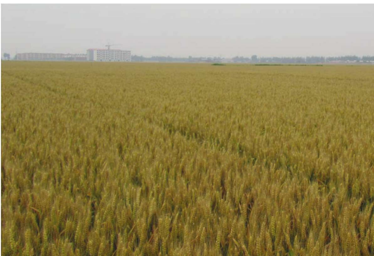
河北省临漳县整县建制小麦高产创建示范田 品种邯6172 马永安提供