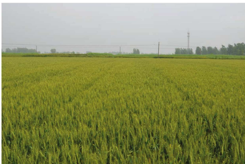
江苏省高邮市小麦高产创建示范田 品种扬辐麦4号