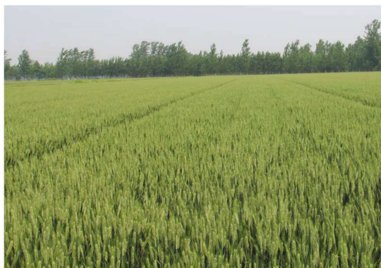
山东省曹县整县建制小麦高产创建示范田 品种泰农18