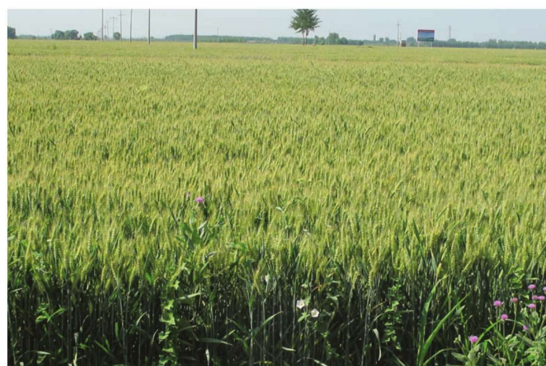
河北省献县南河头乡小麦高产创建示范田 品种良星99