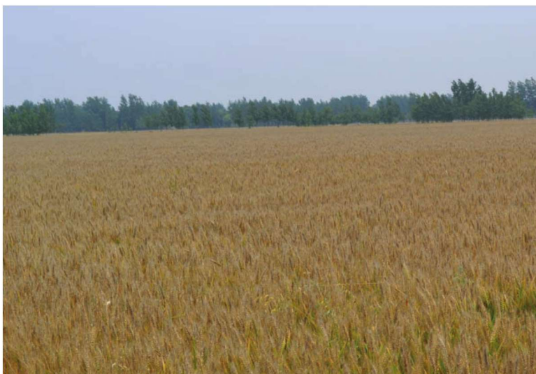
河南省郸城县整县建制小麦高产示范田 品种国麦0319