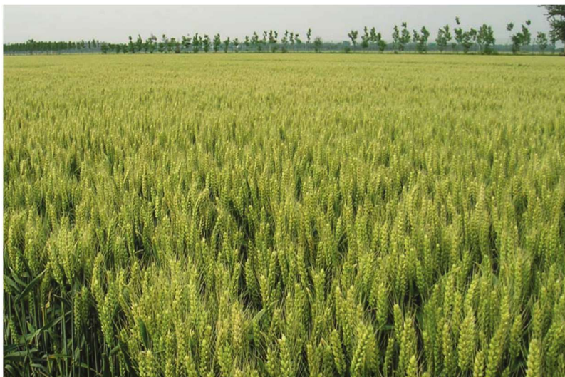
河北省景县整县建制小麦高产创建示范田 品种衡观35