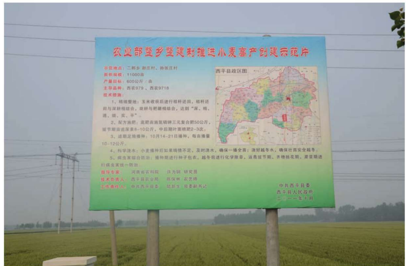
河南省西平县小麦高产创建示范田 品种西农979