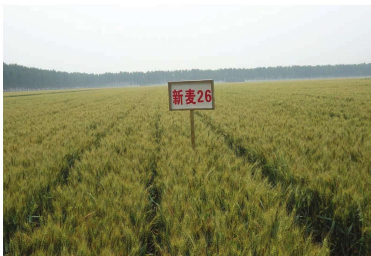
河南省延津县整县建制小麦高产创建示范田 品种新麦26