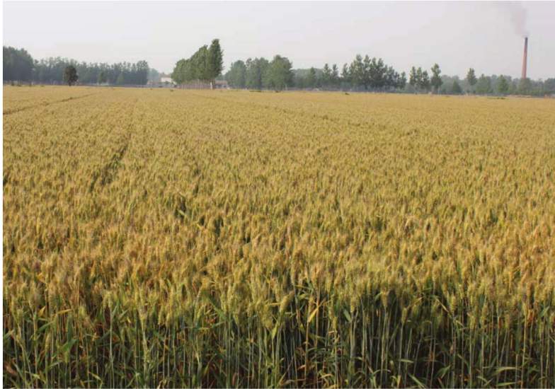
河南省濮阳县小麦高产创建示范田 品种濮麦9号