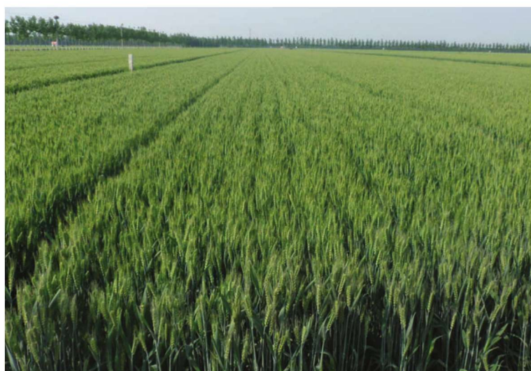
山东省宁阳县整县建制小麦高产创建示范田 品种济麦22