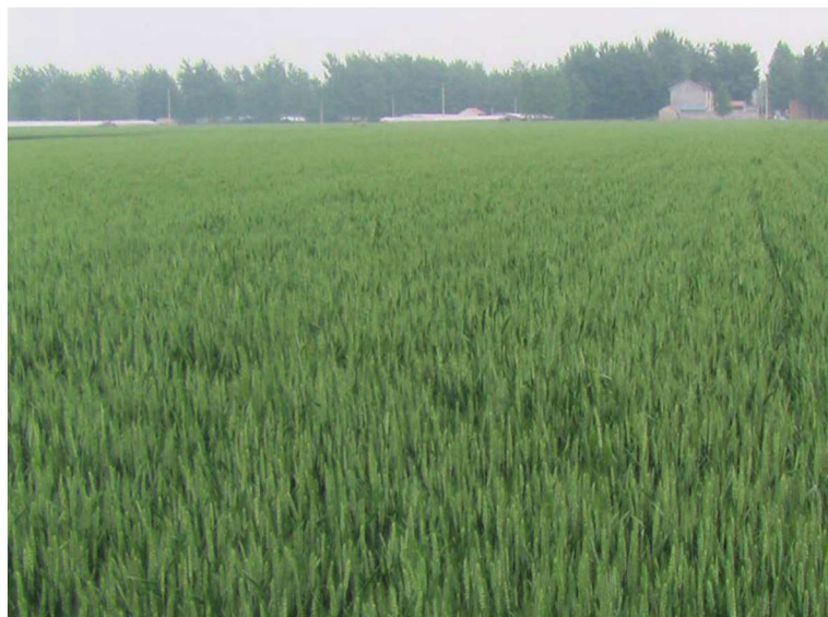
江苏省丰县整县建制小麦高产创建示范田 品种小麦30