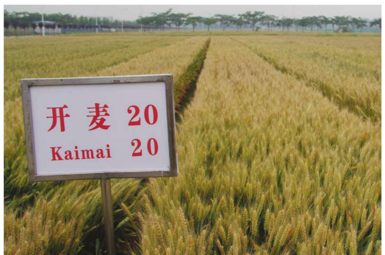
河南省通许县整县建制小麦高产创建示范田 品种开麦20