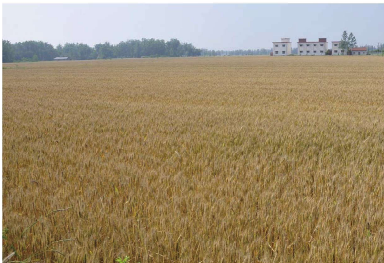
河南省潢川县毛围子村小麦高产创建 示范田 品种豫麦70-36