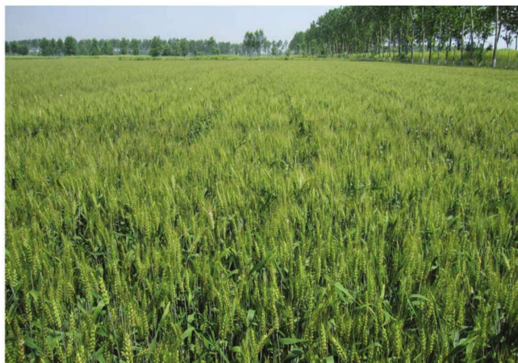
江苏省兴化市整县建制小麦高产创建示范田 品种宁麦14号