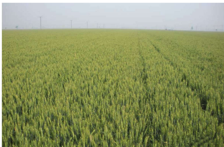
河北省藁城市整县建制小麦高产创建示范田 品种石麦18