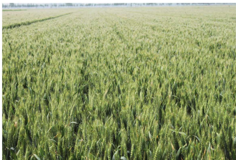
山东省茌平县整县建制小麦高产创建示范田 品种济麦22