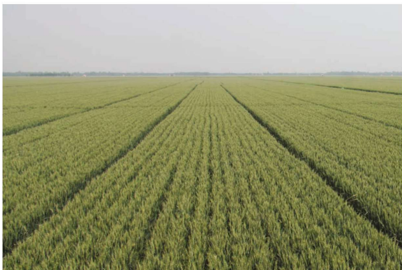
山东省齐河县整县建制小麦高产 创建示范田 品种济麦22