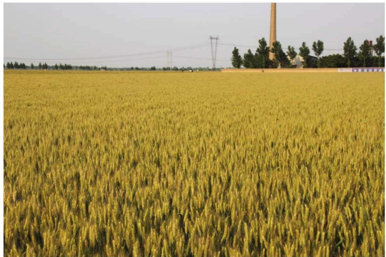
河北省任县整县建制小麦高产创建示范田 品种邢麦7号