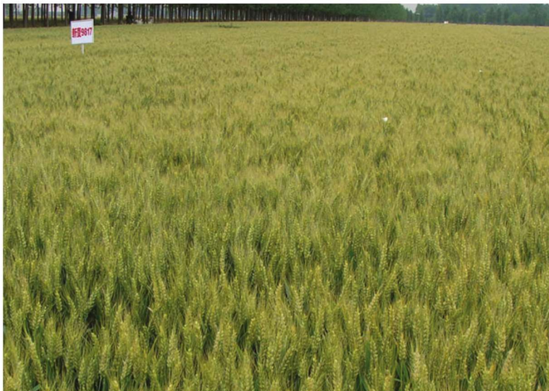
河南省方城县整县建制小麦高产创建示范田 品种新麦9817