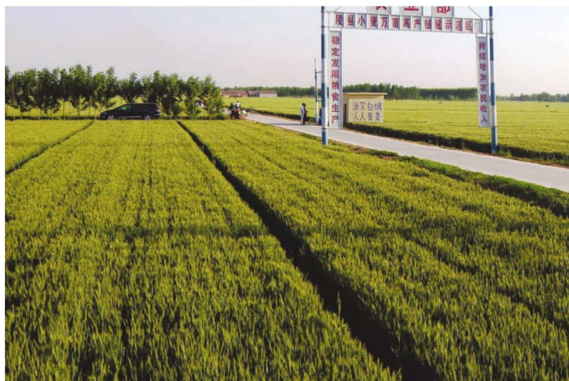
山东省陵县整县建制小麦高产创建示范田 品种济麦22