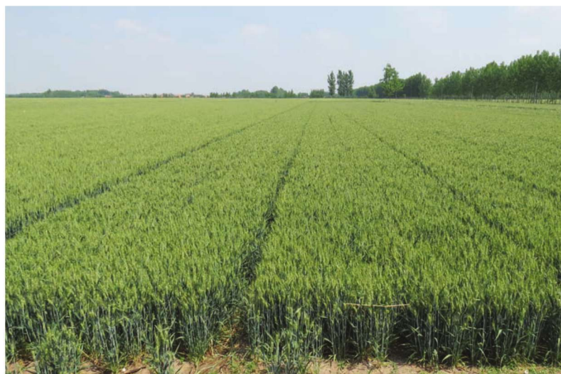
山东省诸城市小麦高产创建示范 田 品种济麦22