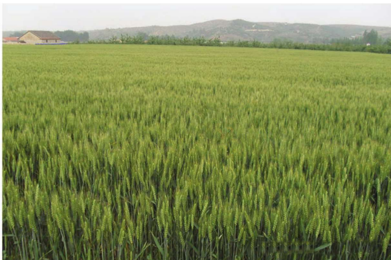
山东省牟平区整县建制小麦高产 创建示范田 品种烟农5158