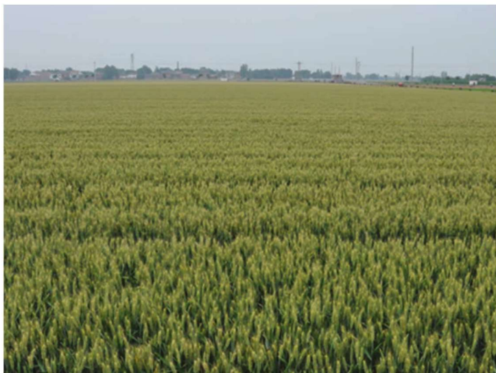
河南省温县整县建制小麦高产创建示范田 品种平安8号 郭天财提供