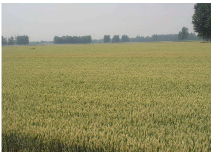
河南省安阳县整县建制小麦高产创建示范田 品种周麦22