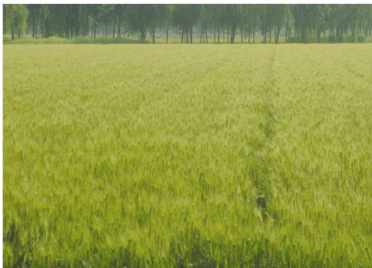
江苏省姜堰市小麦高产创建示范田 品种扬辐麦4号