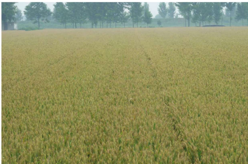
河南省偃师市小麦高产创建示范田 品种平安7号