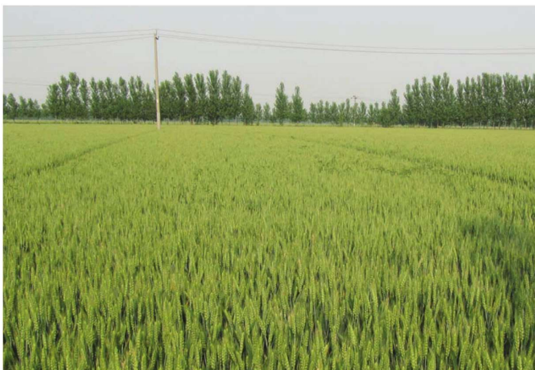
山东省博兴县整县建制小麦高产创建 示范田 品种黑马2号 耿爱民供稿