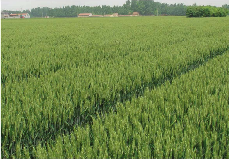
河北省栾城县整县建制小麦高产创建示范田 品种科农199 李俊明提供