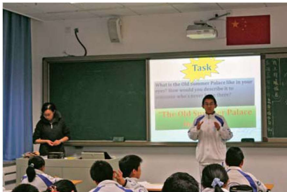
图 1-2 就提供的任务单与学生进行交互式的教学

(2) 在进行英文授课前发给学生一张学科术语英语表达预习任务单。该任务单上面列出一些下节课要用到的学科英文术语的中文,需要学生通过查询工具书或在线词典等方式将其英文表达找出来并标上国际音标且进行记忆。例如,下节课要对刚听过的建筑学讲座内容进行英文授课,那么,任务单上会列出与建筑学相关的常用专业用语,诸如“建筑”“传统的”“西方的”“东方的”“拱形”“廊柱”“哥特式”等。这样让学生提前自主预习生词的做法是为了下节英文授课的听力、讨论以及写作提前扫清生词障碍,为这些活动的顺利进行打好基础。