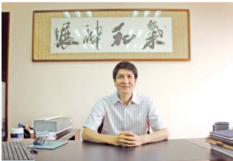
柳北区人民政府区长

柳北区首部全彩色印刷的《柳北年鉴·2014》卷公开出版了。这是柳北区经济文化建设中的一件大事,是柳北区36年来编史修志工作的新突破,是继《柳北年鉴·2013》卷荣获第五届全国年鉴出版质量评比县区级综合年鉴二等奖和第八次广西地方志优秀成果二等奖后,又一部反映柳北区经济和社会发展基本情况、重大成就和深刻变化的新成果。