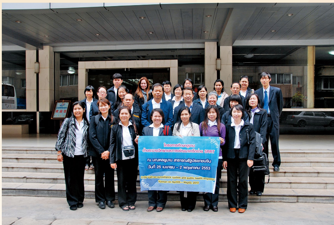
4月26日，泰国卫生部流行病学局考察团到访中心合影