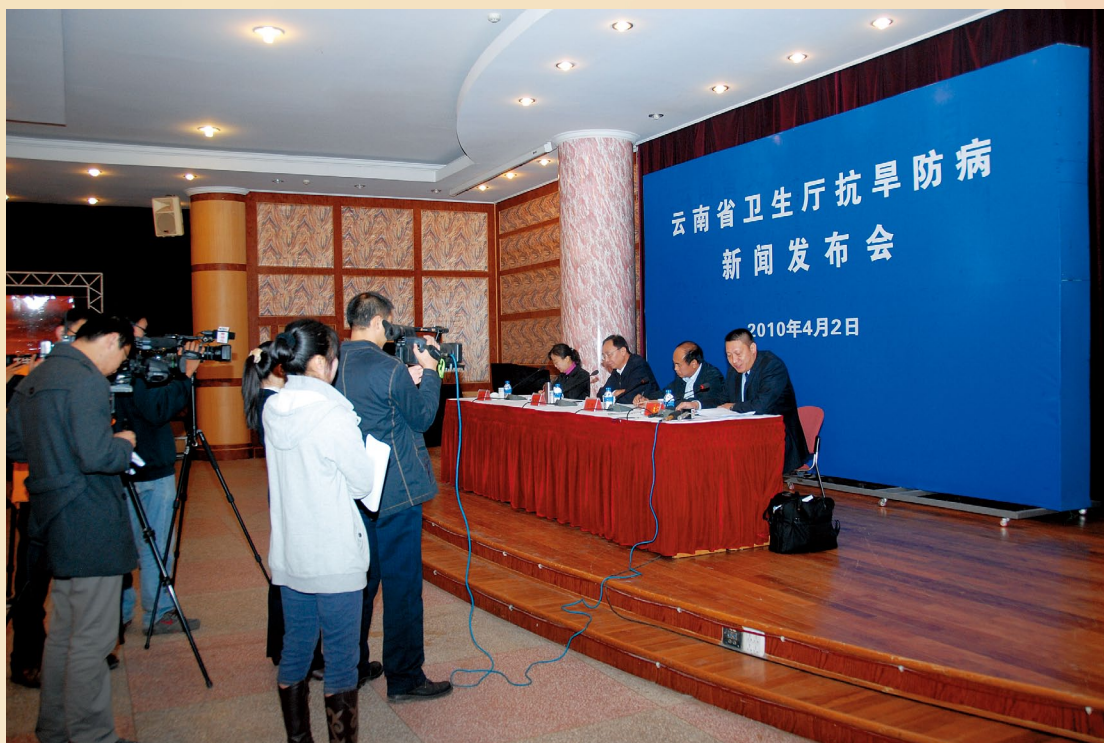
4月2日，省卫生厅在中心召开抗旱防病新闻发布会