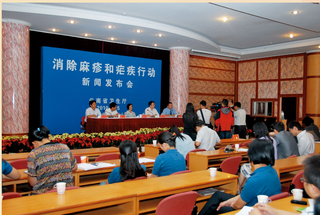
8月25日，省卫生厅在中心召开消除麻疹和疟疾行动新闻发布会