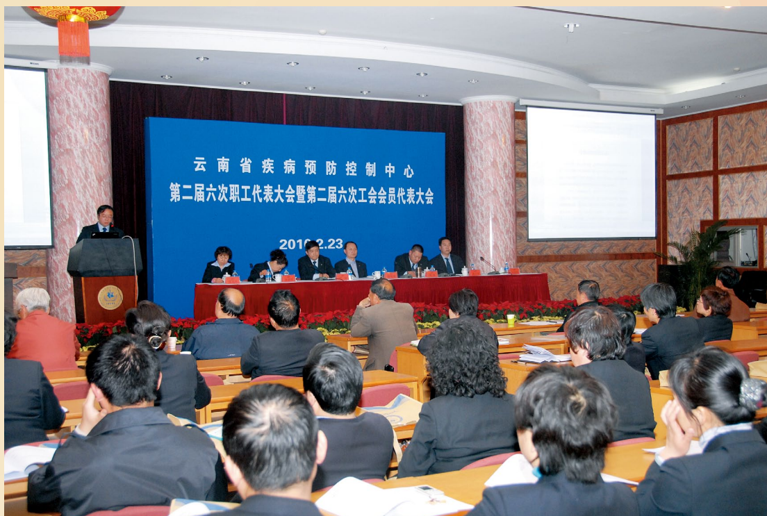
2月23日，中心第二届六次职工代表大会暨第二届六次工会会员代表大会