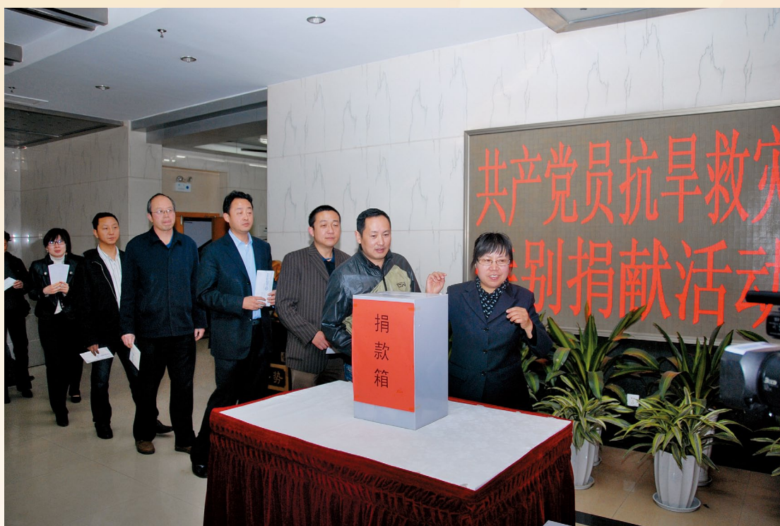
4月1日，中心党员抗旱救灾特别捐献活动