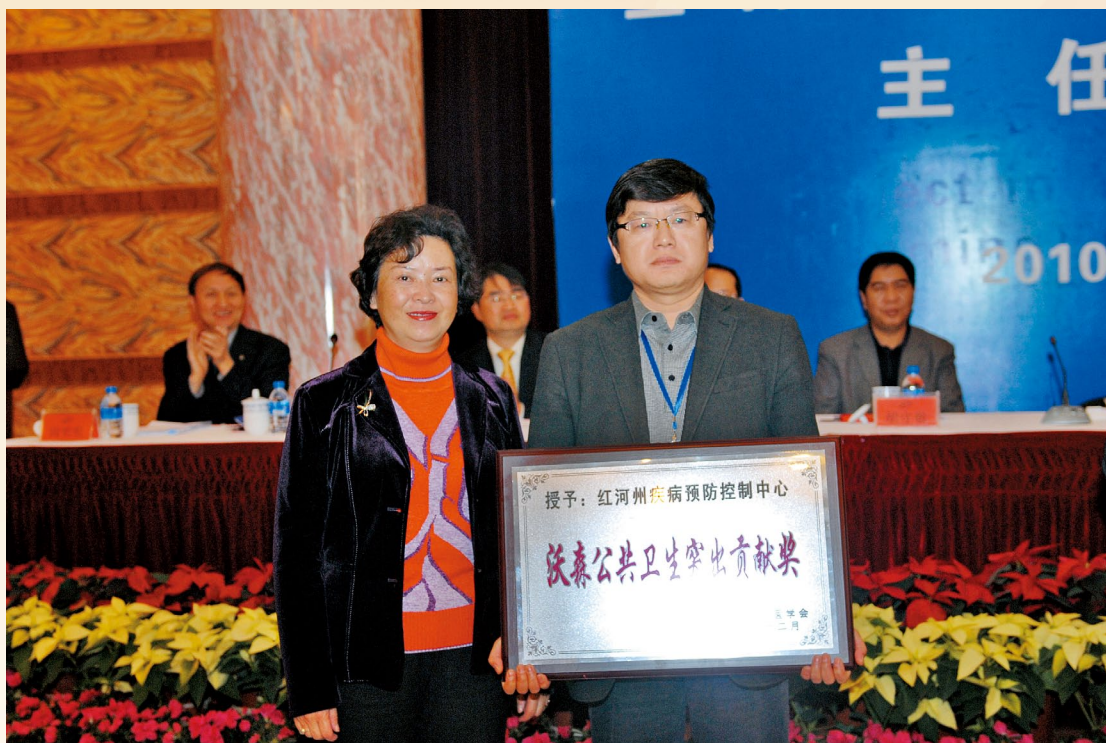
12月18日“2010年疾控中心主任年会”，省卫生厅杜克琳副厅长向获得云南省预防医学会沃森公共卫生突出贡献奖的红河州疾控中心颁奖