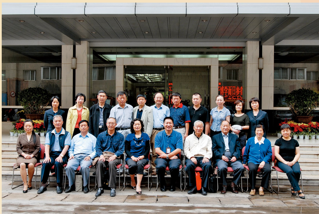
5月26日，防痨协会常务理事会参会理事合影