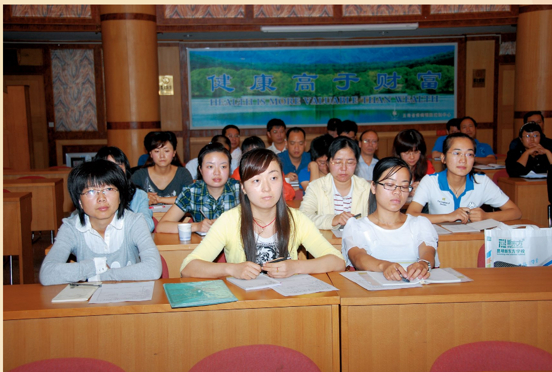
7月26日，2010年新进员工入职培训开班