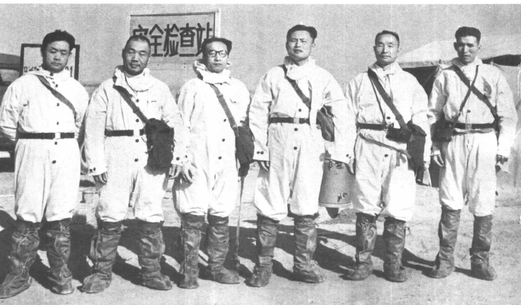
第一颗原子弹试验前线部分指挥人员(左起:苑化冰、张蕴钰、刘柏罗、刘西尧、张爱萍、毕庆堂)