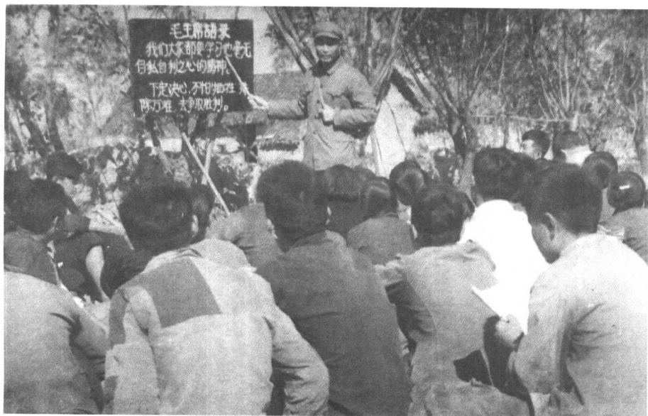
1965年3月，在邗江县方巷大队参加社会主义教育运动