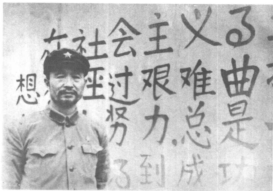
1966年12月，在文化大革命初期被红卫兵关押后放出时