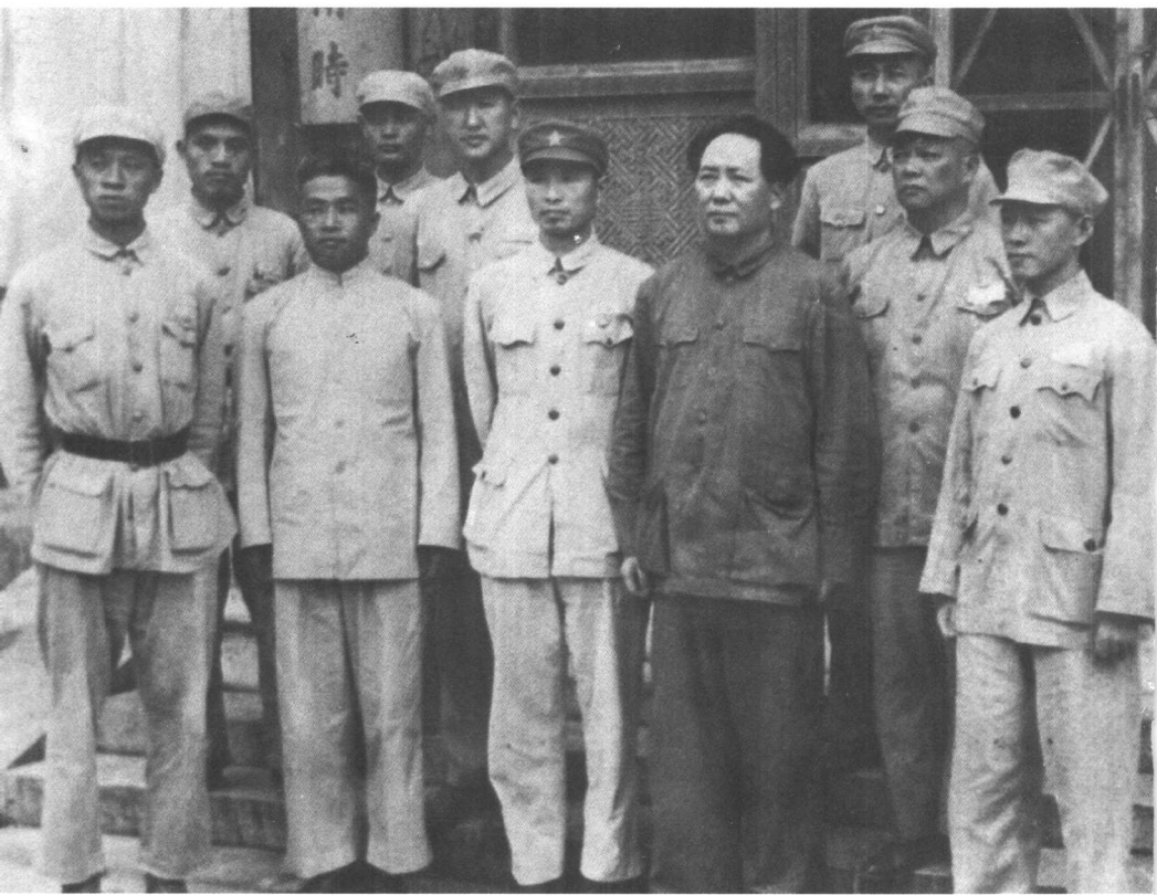
1949年8月28日，毛泽东主席在中南海接见海军初创人员(左起：黄胜天、蒋成玉、徐时辅、王真、薛伯青、张爱萍、毛泽东、金声、曾国晟、林遵)