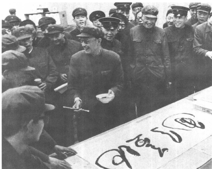
1984年4月，于北京同步地球卫星接受站