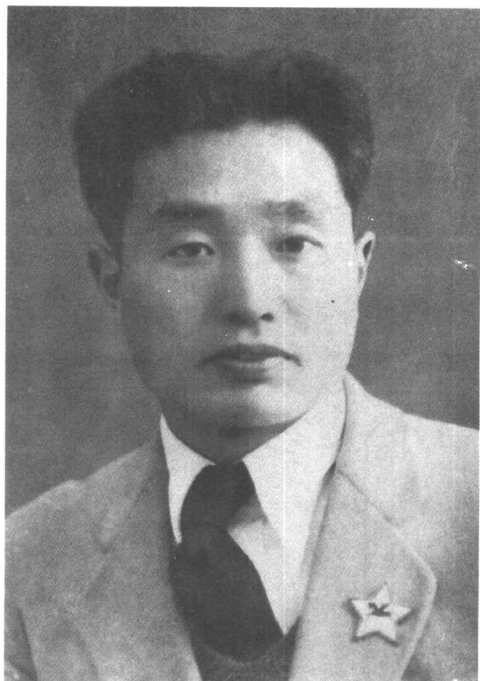
1937年,于上海任江浙省委 军委书记