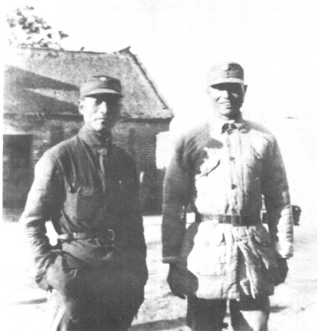
1943年,与彭雪枫在 敌后抗日根据地半城