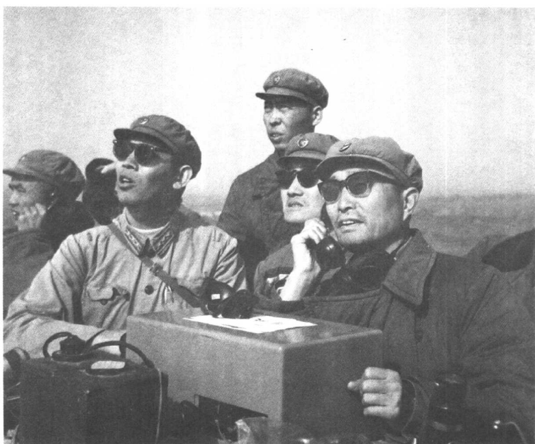
1964年10月16日,我国第一颗原子弹爆炸成功,张爱萍在试验场向周恩来总理报告