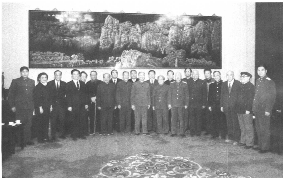
1989年，同在国防科技工作中作出重大贡献的老专家在一起