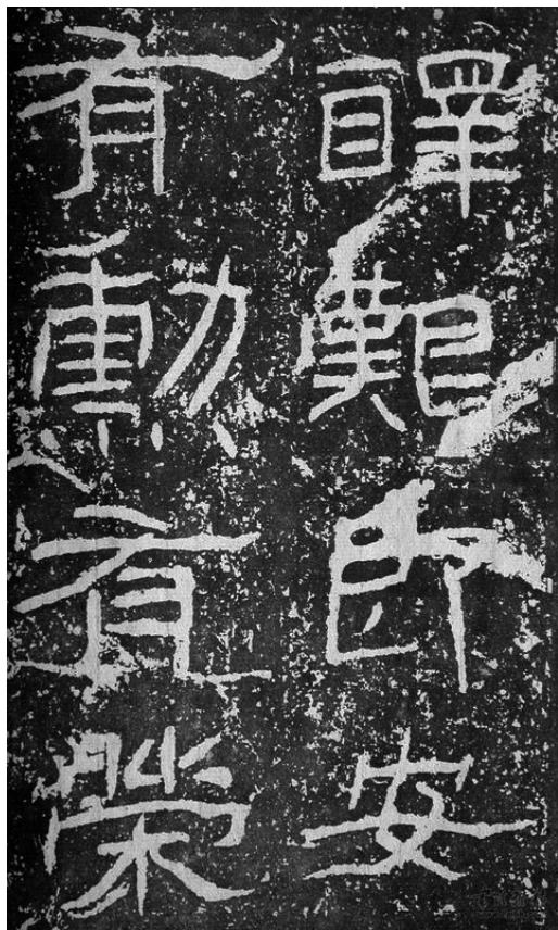
图 1-7 汉代《石门颂》(局部)

草书在西汉产生,至东汉广泛流行。草书分为章草和今草,章草又由草隶演化而成。现能见到最早的章草作品是西汉元帝时期史游所作的《急就章》。今草是在章草的基础上演化而来的。今草去隶意加流转,更加连绵流畅,今草在汉末魏晋时期成熟并广泛地流行起来。