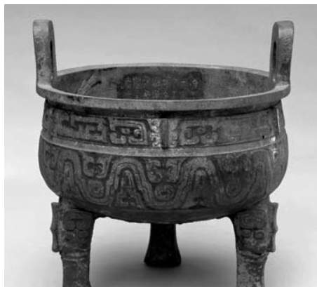
图 1-3 西周小克鼎

西周中期是金文的繁盛期。这一时期,青铜器数量猛增,铭文普遍加长,鸿篇巨制增多,金文笔画线条渐趋匀称规整,块面状笔画基本消失,字的大小渐