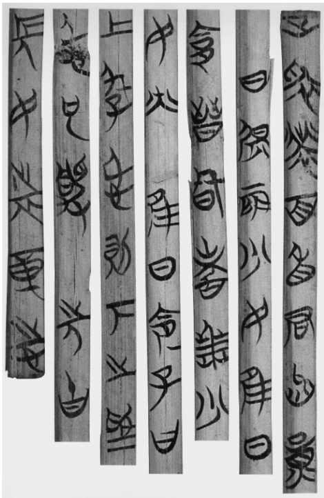
图 1-5 战国竹简(局部)

《石鼓文》在初唐时期被发现,“石鼓”是因文字刻于十个鼓形的石头上而得名。《石鼓文》具有极高的书法艺术价值,其笔法娴熟,笔画流畅中凝重,结构严谨,法度森严,字形方