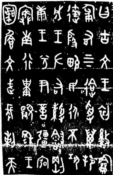
图 1-4 墙盘铭文拓片

趋一致,章法整齐平正,法度增强,标志着金文走向成熟,达到鼎盛,体现出了金文浑朴敦厚、庄重肃穆的风格。