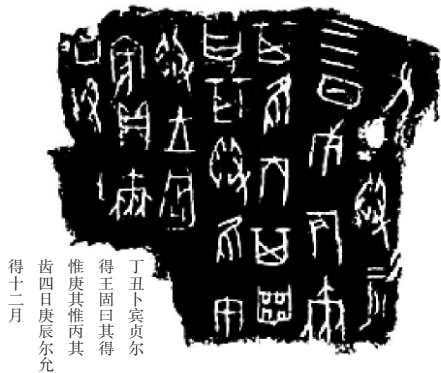
图 1-2 甲骨文拓片

甲骨文又称卜辞，是商、西周时期刻在龟甲、兽骨上用于记录占卜内容的文字。甲骨文的内容主要是占卜。殷人不论祭祀、征战、田渔、出入、收成、风雨、疾病等都要占卜，并且把占卜的时间，占卜者的姓名，占卜事情的结果、应验情况等用刀刻在龟甲或牛骨上面。因为多是与占卜有关的文字，因此甲骨文亦称“卜辞”或“龟甲”文字。