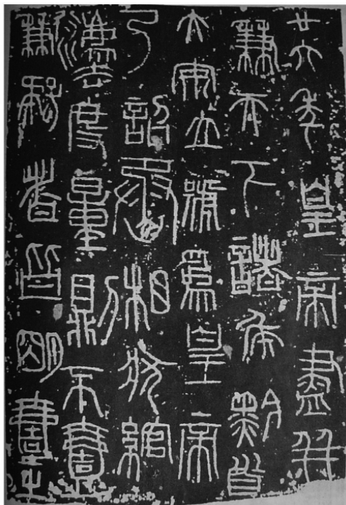
图 1-6 秦诏版(局部)

除了小篆为正统的官方字体以外,秦代规定使用的字体有八种。《说文解字·序》说:“秦书有八体,一曰大篆,二曰小篆,三曰刻符,四曰虫书,五曰摹印,六曰署书,七曰殳书,八曰隶书。”基本概括了此时字体的面貌。从考古发掘出土的资料来看,隶书作为篆书的草体,在战国时期已逐渐萌芽,在秦始皇时期发展迅速,这反映在秦系简牍墨迹中,比如《青川木牍》《云梦睡虎地秦简》《里耶秦简》等。简牍、帛书一直作为俗体文字随着正体字的发展而发展,同时又促进着正体