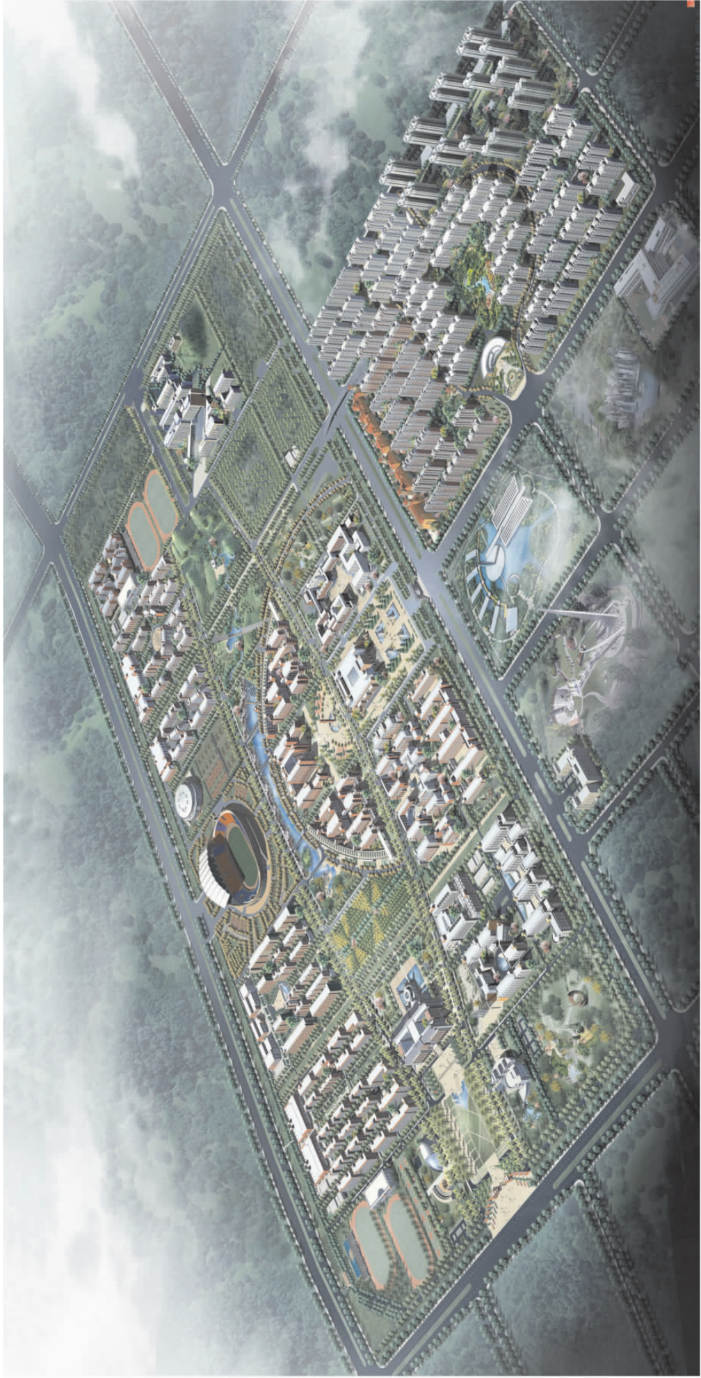
郑州大学新校区最新区最新鸟瞰图