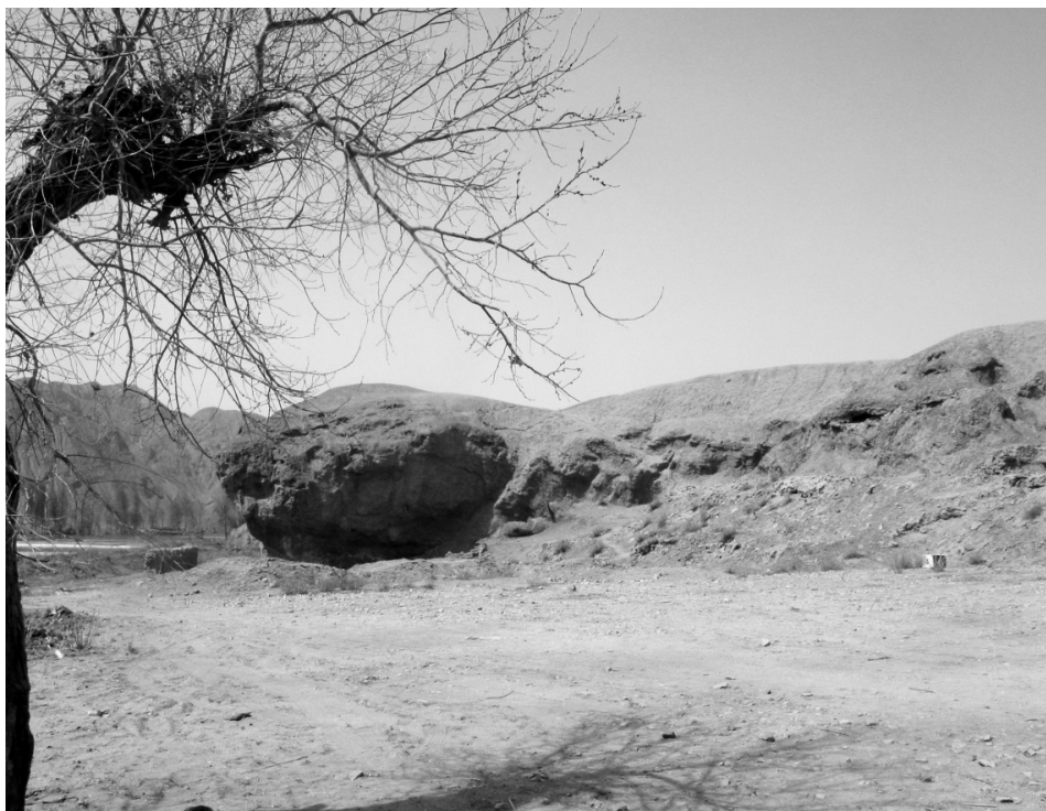
正义峡“金龟点水”景点

在峡中,奇峰怪石,千姿百态,形成了一处处天然奇观,民间冠以各种形象的名称:鹁鸽仙洞、晚翠山屏、大腹弥勒、二僧拜佛、镇水神石、神禹斧痕、亢家银洞,并由此形成了吸引八方游客的“镇夷十景”。从正义峡口进入峡内,四山环抱,弱水明流,山清水秀,鸟语花香,很