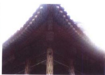
蝠厅房檐细部（椽子头上都绘有“卍”字图案）