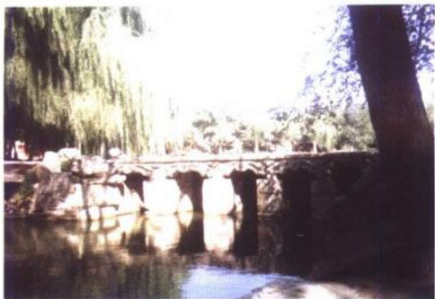
石桥之一（桥下之水流往未名湖）