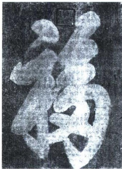
康熙书写的“福”字及篆刻