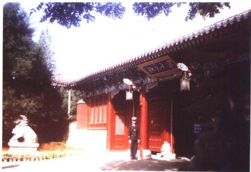
大门（现北京大学西校门）