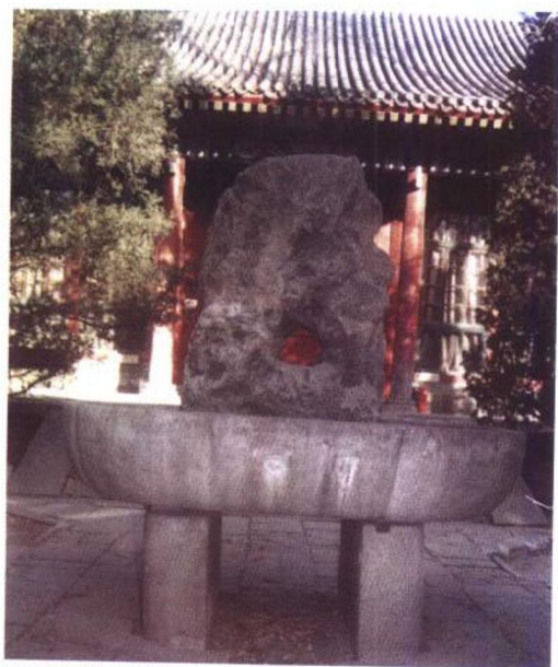
锡晋斋院中的石盘和太湖石