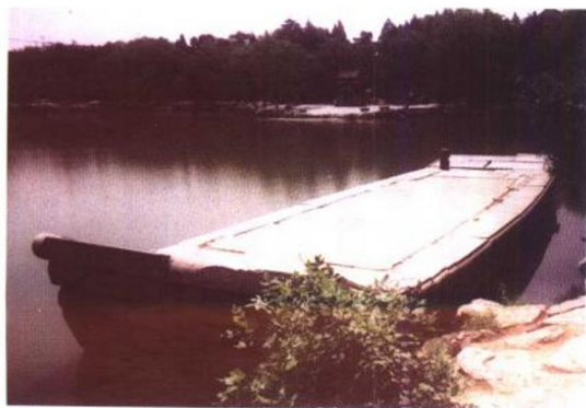
未名湖上的石舫 (现只剩下底座)