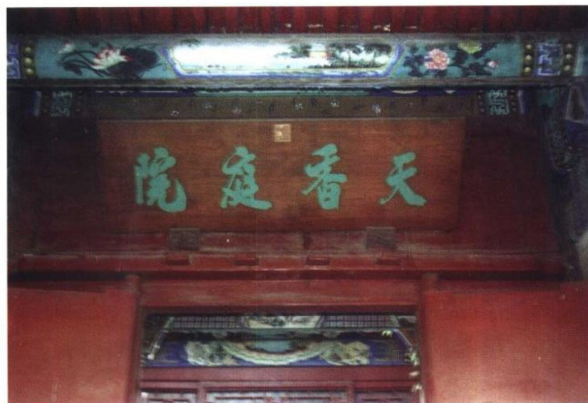
面对“锡晋斋”大门内慎郡王所题“天香庭院”四字