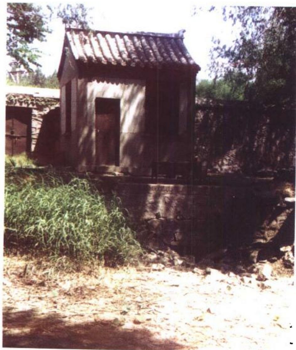
· 此小房在花园的西北角。 · 外河之水自小房下流入