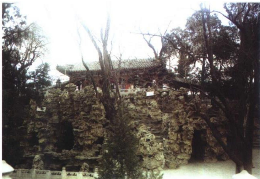
置放“福”字碑的洞府