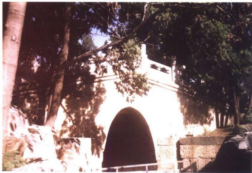
石桥之二（未名湖水自此桥下流出）