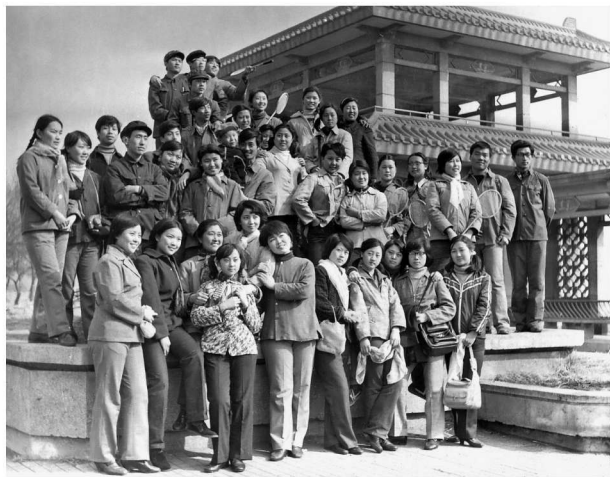
在师范学校做班主任时带学生去北陵过周日

7年后的1980年，学校搬迁回城，校名改为“沈阳师范学校”，校舍是小河沿旁原东北军的一座旧军营。小河沿一带曾是张作霖、张学良父子的辖地。这里有张氏帅府多