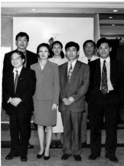
与参加“沈阳未来与发展——’97中青年经济文化论坛”的专家和组织者合影

1996年初，我从市委宣传部文艺处处长的位置调到市文联任专职副主席，五年后，55岁的我又任主席和党组书记。这两个位置都是市管领导干部，工作相对宏观，因而参与市里各项活动和撰稿的时候少了。但是，这段时间对全市的总体文化建设有了更深一步的思考，也出了一些分量相对较重的文化方面的作品。