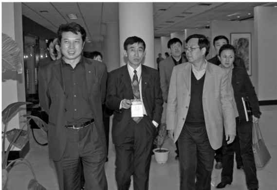
陪中国文联领导参观世园会上举办的“东北三省名家书画展”