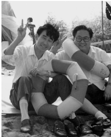
与电视剧《五爱街》的编剧、原著作者

作为市委的文艺官员，任职这段时间涉猎了大量反映沈阳的电视片、电视剧的创作和拍摄工作。1991年，我应邀为沈阳市电化教育电视专题片《勿忘“九一八”》撰稿，1995年为沈阳电视台电视专题片《沈阳，我的故乡》撰文。这期间，沈阳市推出两部重量级电视剧。一部是反映日本军国主义强占东三省的历史题材长篇电视连续剧《远东阴谋》，一部是反映改革开放初期沈阳小商品市场名噪全国的现实题材长篇电视连续剧《五爱街》。《远东阴谋》在中央电视台黄金时段播出，引起巨大反响，给日本右翼势力的猖狂反华行为以有力回击。该片获全国电视剧飞天奖。《五爱街》在全国特别是在辽沈地区引起强烈反响，在中央电视台播出，亦获得国家 and 省的奖