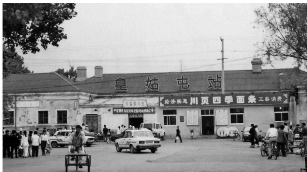
儿时住所及学校附近的皇姑屯火车站已有百年历史

我祖籍是山东，出生在辽宁营口。一岁多一点的时候正赶上辽沈战役，解放军为控制国民党军队南撤的通道，与其在营口展开拉锯战，双方军队几进几出。营口难以居住，兵荒马乱中，爸爸妈妈带着我和三岁的姐姐，乘小舢板，顺渤海岸逃难到锦西（现称葫芦岛市）。后辗转半年多，到了阜新，又由阜新搭坐大板车，来到刚刚解放的沈阳，其时正是1948年的11月。作为难民，全家落脚在皇姑区沙子沟。刚出生时的我因为长得肥壮，小名唤作