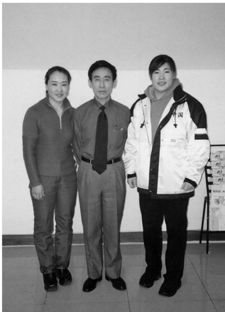
与奥运女子柔道冠军李忠云和袁华

这不是我的第一部著作。我的第一部书是2001年由辽宁美术出版社出版的《瞬间永恒——摄影记者与抗美援朝战争》。这部书是