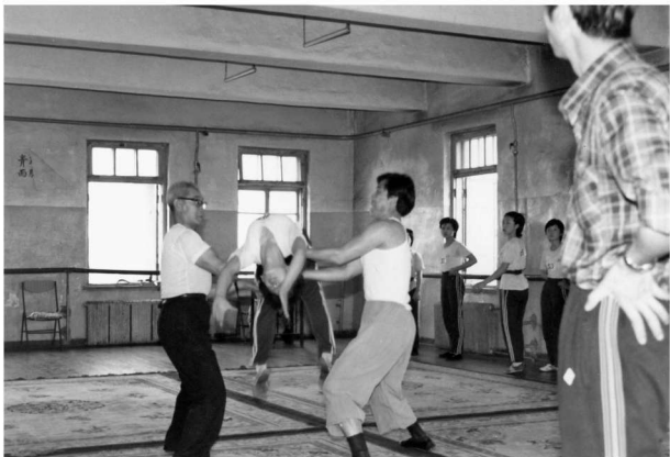
在艺校时看评剧班的武功课

调到市文化局是1984年。市文化局在八一公园附近，这里上班方便，机关的工作也规整，但舒服的日子并不长，很快我就因教师的经历调离了机关，被派到