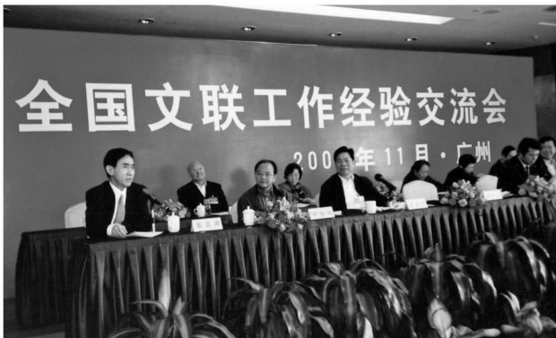
在全国文联工作经验交流会上作典型发言

2004年，根据市委要求，沈阳市文联对所属事业单位进行改革，改革十分艰难但获得了成功。改革的做法受到中国文联的关注，当年举行的全国文联工作会议邀我介绍经验。在会上，我作了《积极推动改革 创新文联工作》的发言，这次发言生动实际，引起参加会议的全国文艺界五六百位代表的强烈反响。会后，这一发言在中国文联简报上摘要发表。同年，受韩国仁川市邀请，我率中国沈阳艺术家代表团赴韩进行文化交流。