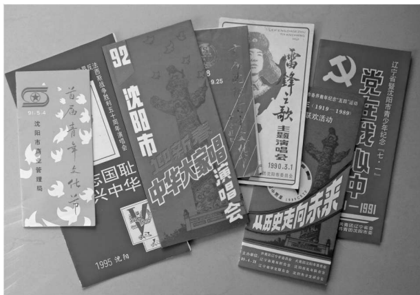
为团市委和政府大型活动撰稿

这次纪念活动取得了巨大成功，受到省市领导的充分肯定。这次活动的成功是多方面努力的结果，但连接词的作用得到了特殊的赞誉，以至于事隔16年后，我去看一位已经是市领导的当年团市委书记时，他从书架中取出那次活动印制的宣传册，激动地对我说：“周老师，您当初为我们写的大作，我还在珍藏，那次活动搞得太成功了，感谢您的帮助。”那次活动确实激动人心，就是现在读起当时的那些文字，仍让人心潮澎湃。而那时我已经43岁，是那些热心青年激发了我的青春