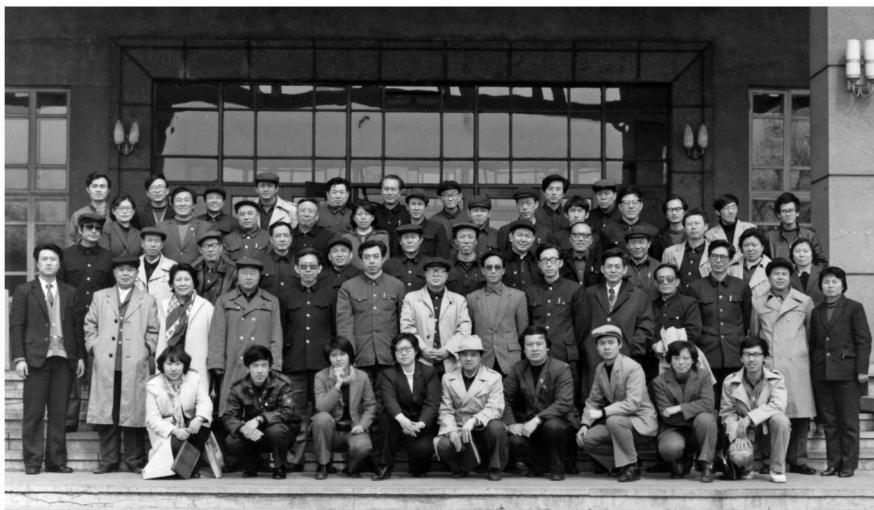
1986年3月，参加沈阳市艺术走向研讨会