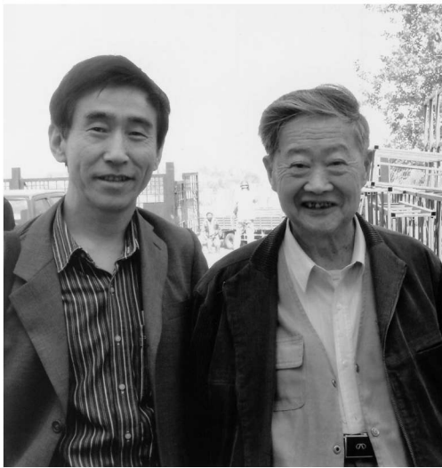
与著名古建筑专家罗哲文在一起

“两陵”如何申报世界文化遗产的事宜，罗先生提示，应以与北京故宫等清遗址世界遗产捆绑的方式申报。经罗先生提示，亦经相关领导同意，我为市里代拟了申报的文件。三年后的2004年，沈阳“一宫两陵”世界文化遗产的申报终获成功，而当初向罗先生的请教正是这一工作的最初启动。