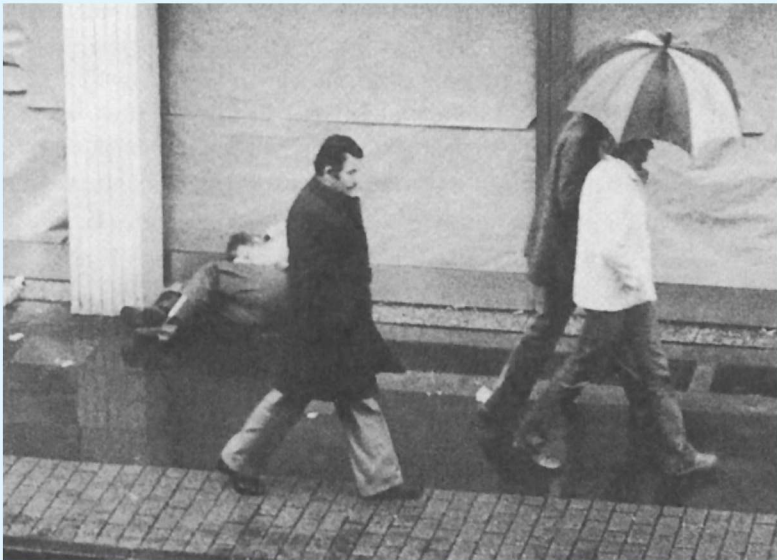
插图 1.1 不愿给人提供帮助，用现代化的大都市的人的“麻木不仁”和“漠不关心”就能解释吗？

日常生活中在心理学上具有重大意义的问题。人在与环境的斗争中会反复遇到一些无法轻易解决的问题。有些问题应当给予回答，比如，孩子为什么不愿意做作业？有些人为什么觉得解数学题很困难，而有些人则毫无困难？许多人本想记住的东西却很快就忘记了，原因何在？有些人为什么总是很容易跟人发生争吵，而有些人却能待人亲热，跟人产生亲密友好的感情？有些人在急需他人帮助的时候却孤立无援，如何解释？ (9)