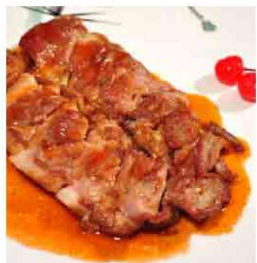
红梅香草汁伴香煎鹅扒