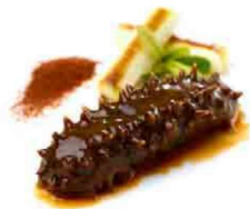
虾子干烧北海道 60 头刺参