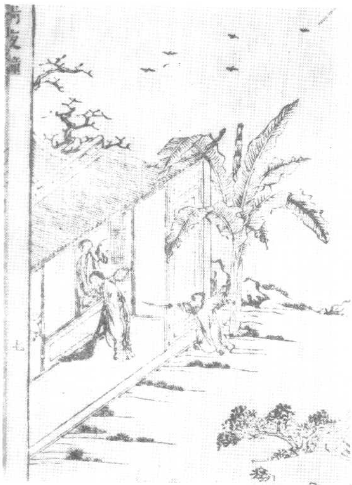
明末隆武年間刻本《清夜鐘》第七回插圖