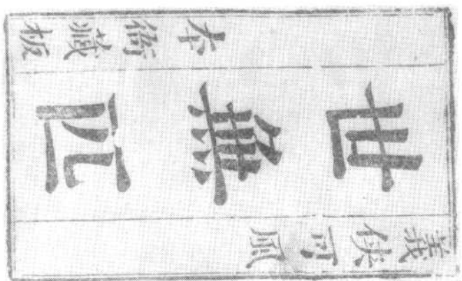
清康熙年間刻本《世无匹》扉页