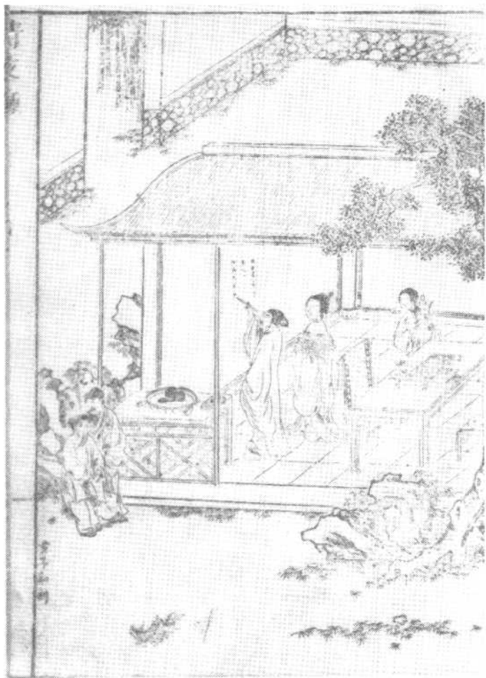
明末隆武年间刻本《清夜钟》第一回插图