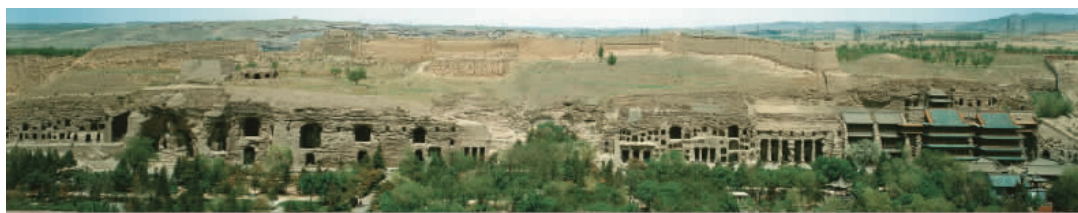
图 1-4 云冈石窟中部窟群

公元 4 世纪末期，控制了黄河流域以北大部分地区的拓跋鲜卑建立了北魏王朝。道武帝拓跋珪天兴元年(398)从盛乐(今内蒙古和林格尔一带)迁都平城(今大同市)，到孝文帝拓跋宏太和十八年(494)再迁都洛阳，大同作为北魏封建统治的中心近一百年之久。云冈石窟就是在北魏王朝的最繁荣时期(460—524)开凿的。