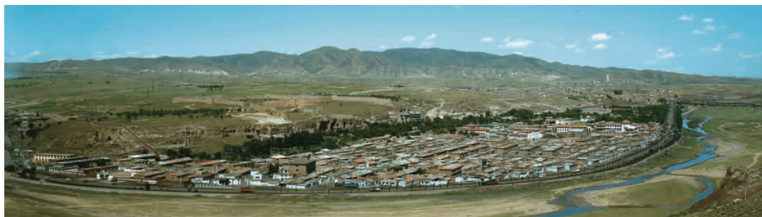
图 1-3 云冈石窟地处武州川

云冈石窟距大同市约 16 公里，从市区出发向西沿云冈路至十里河进入武州山川，约 30 分钟的车程，就达云冈石窟。石窟位于武州山南麓，武州川的北岸。洞窟依山开凿，东西绵延约 1 公里，现存编号洞窟 254 个，雕刻面积达 18000 多平方米，大小造像 59000 余尊，最大的高 17 米，最小的仅有 2 公分(图 1-3)。它是世界著名的艺术宝库和文化遗产，也是我国最大的古代石窟群之一，与我国其他石窟艺术一道，是研究中国社会史、佛教史、艺术史的珍贵资料。1961 年 3 月，国务院公布为第一批全国重点文物保护单位(图 1-4)。