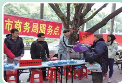
局机关党员上街道开展为民服务工作