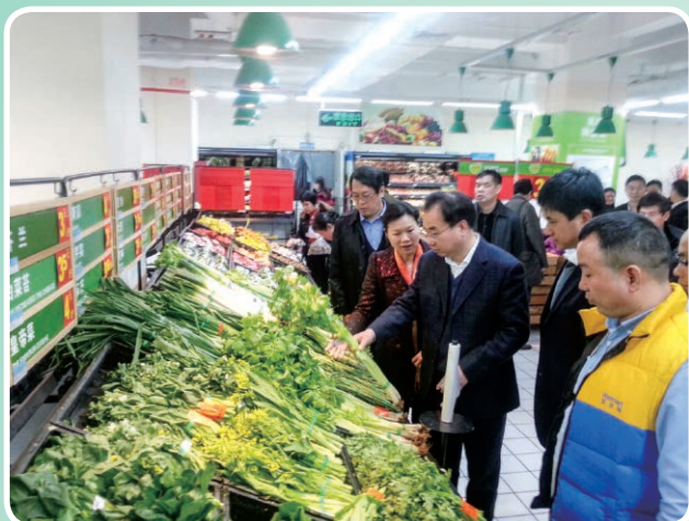
市长朱学庆（前中）在局长梁冰（前左二）的陪同下调研节日农贸市场供应情况

2014年，市商务局按照稳中求进的总基调，围绕目标任务，迎难而上，主动作为，扎实做好商务领域稳增长、促改革、调结构、惠民生的各项工作，商务工作实现平稳较快增长。全市社会消费品零售总额为328亿元，同比增长12.3%；全市外贸进出口12.49亿美元，出口在全球经济严峻的情况下，仍然逆势而上，完成5.08亿美元，同比增长1.7%；全市商贸流通项目完成投资110.52亿元，同比增长17.3%；全市建设特色街区项目完成投资11.01亿元，同比增长17.5%；全市商贸流通产业招商项目累计到位资金60.44亿元，同比增长58.5%。