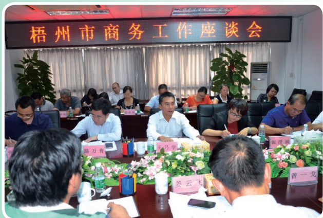
自治区商务厅厅长王乃学到市局调研指导商务工作

2014年，市商务局按照稳中求进的总基调，围绕目标任务，迎难而上，主动作为，扎实做好商务领域稳增长、促改革、调结构、惠民生的各项工作，商务工作实现平稳较快增长。全市社会消费品零售总额为328亿元，同比增长12.3%；全市外贸进出口12.49亿美元，出口在全球经济严峻的情况下，仍然逆势而上，完成5.08亿美元，同比增长1.7%；全市商贸流通项目完成投资110.52亿元，同比增长17.3%；全市建设特色街区项目完成投资11.01亿元，同比增长17.5%；全市商贸流通产业招商项目累计到位资金60.44亿元，同比增长58.5%。