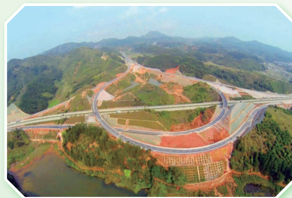
梧贵高速洞心段互通俯览图