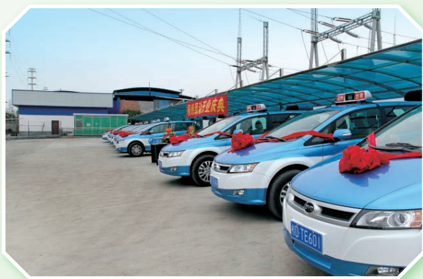
2014 年新投放运营纯电动出租车 60 辆