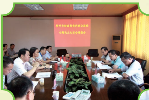
2014年8月5日，召开党的群众路线专题民主生活会通报会