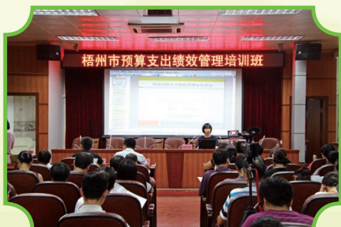
2014年8月12日，开办预算支出绩效管理培训班