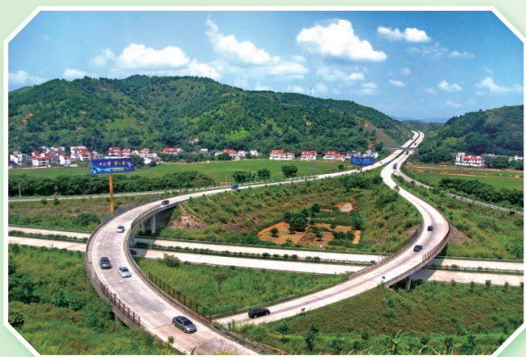
日渐完善的梧州高速公路网络