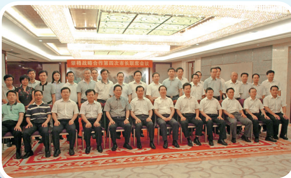
肇梧战略合作第四次市长联席会议

(二) 大力推进重大基础设施建设。柳肇铁路柳梧段等14个重大交通基础设施项目进展顺利；加快编制新能源示范城市建设实施方案。