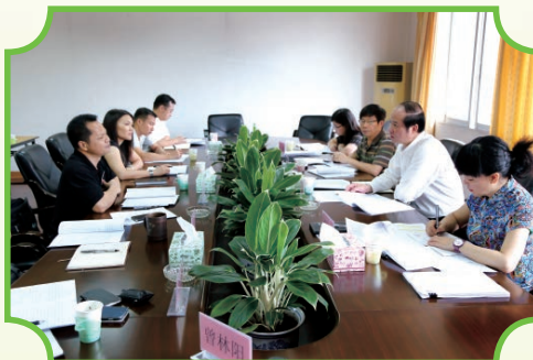
2014年6月12日，自治区财政厅厅长黄伟京（右二）到局督查2014年上半年财政支出情况