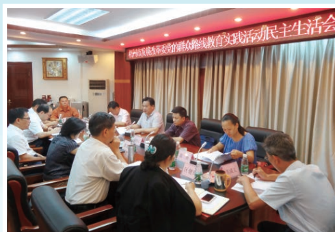
召开党的群众路线教育实践活动民主生活会