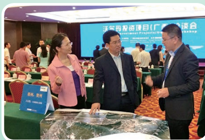
局领导在沃尔玛投资项目洽谈会上积极推介梧州