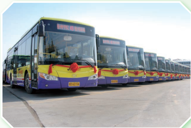
2014 年新投放运营梧州珍宝巴士 42 辆