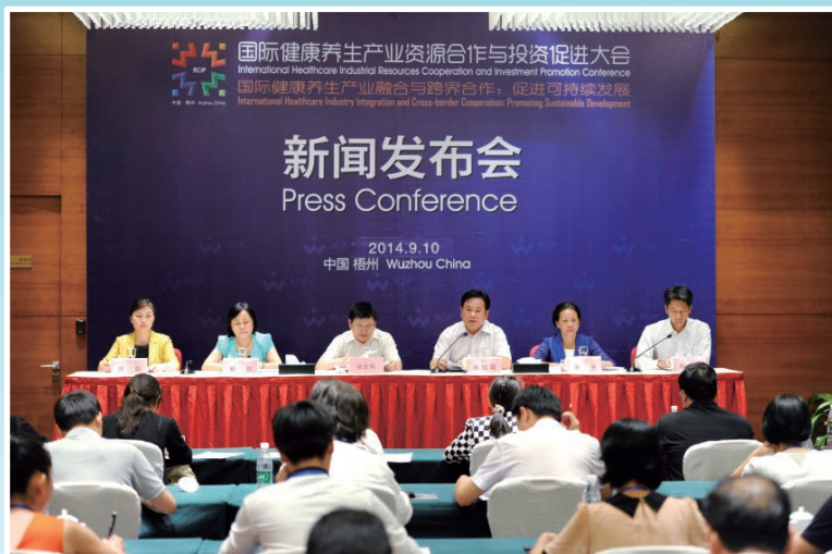
梧州国际健康养生与投资大会新闻发布会

(四) 主动服务企业。全市新增规模以上工业企业 18 家，规上工业实现利润增长 34.8%。抓好重点农业项目实施。推进农业基础设施建设，扩大粮食播种面积，发展特色优质养殖，推进生态和民生林业建设。