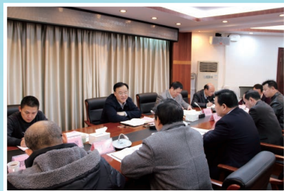
市委书记黄俊华到委调研

(一) 狠抓项目前期、包装和投资管理。实行市领导联系重大项目(事项)制度，全市1057个重点项目完成投资827亿元，列入自治区层面统筹推进重大项目36项，完成投资69亿元。