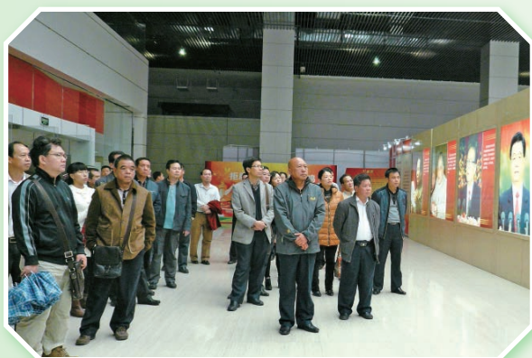
领导班子率干部职工参观自治区党风廉政警示教育展梧州巡展