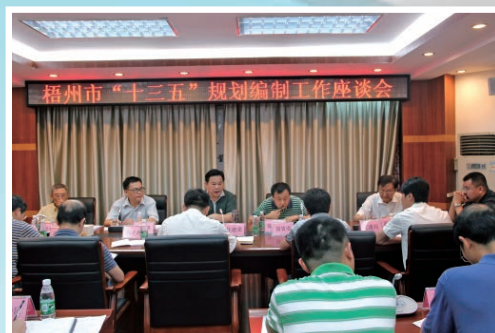
梧州市“十三五”规划编制工作座谈会

(三) 突出发展循环经济和推进节能减排。积极为 12 个重点循环经济项目争取上级专项资金 8608 万元，6 个节能技术改造项目获得自治区节能技改财政奖励资金支持。