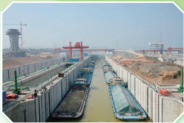
长洲水利枢纽三四线船闸年底主体完工，三线船闸试水调试，年底初步具备通航条件