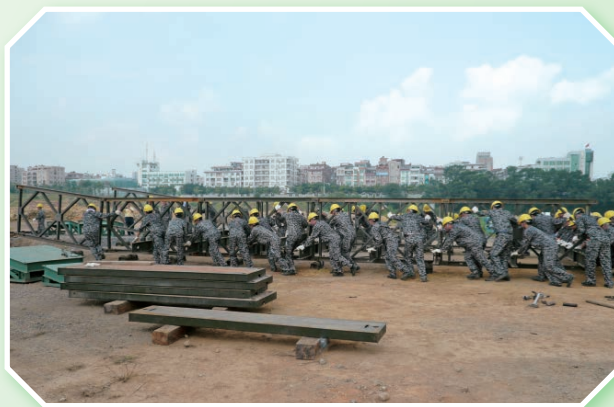
2014 年梧州市国防交通路桥应急保障演练