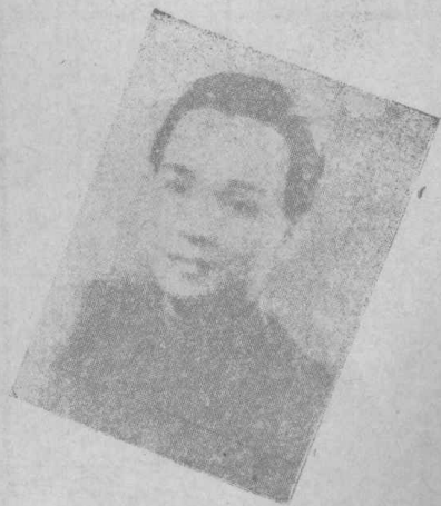
大前程劇團台柱近照