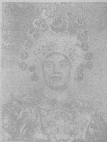
大前程劇團台柱近照