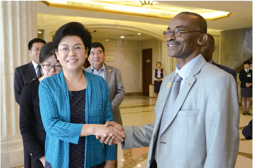
自治区主席刘慧与科摩罗副总统穆哈吉话别