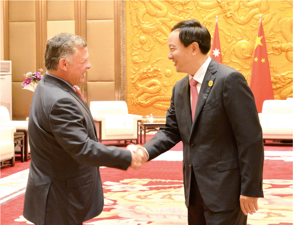
自治区党委书记、人大常委会主任李建华会见约旦国王阿卜杜拉二世