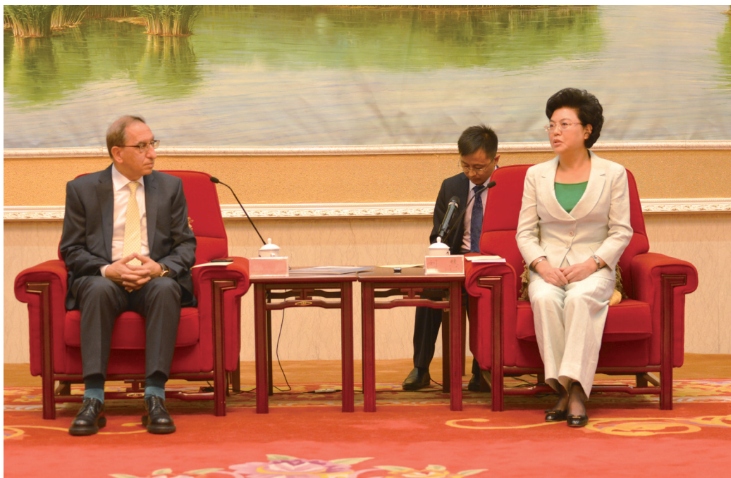
自治区主席刘慧会见约旦高教与科研大臣拉比卜·赫达拉