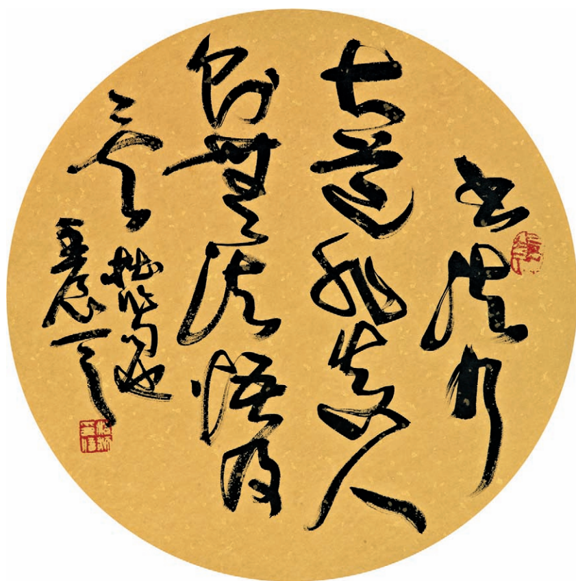
劉浩然 草書 扇面