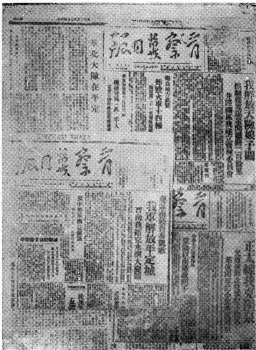
《新华日报》、《晋察冀日报》登载有关平定解放的喜讯。