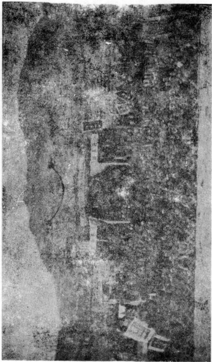
为了支援全国解放，平定（路北）县组织大批民工支前参战。这是支援太原战役时的担架队。