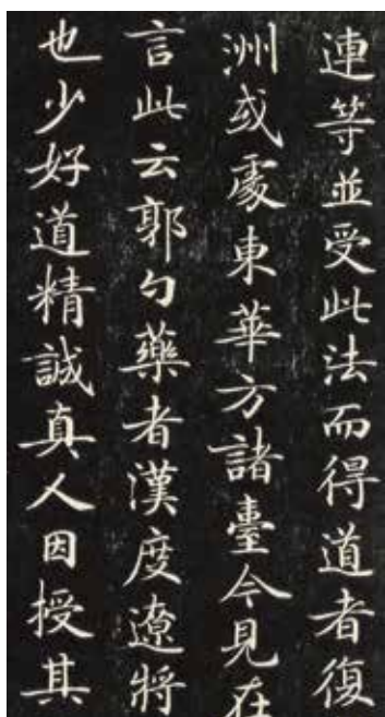
滋蕙堂帖本《灵飞经》 (局部)

海宁陈氏抽扣的四十三行墨迹，在清代后期到了常熟翁氏家中，到翁同龢时已经历了三代，这在他的《瓶庐丛稿》中有记载。后来几经流散，《灵飞经》的纸本四十三行墨迹便流失到了美国，现藏纽约大都会博物馆。