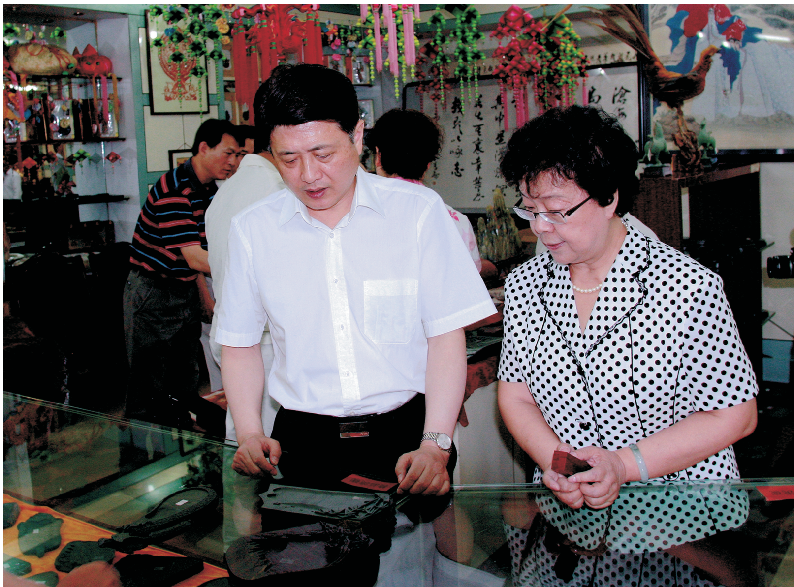
甘肃省省长刘伟平，甘肃省人大常委会原副主任、甘肃省工艺美术协会名誉会长杜颖视察省工艺美术企业