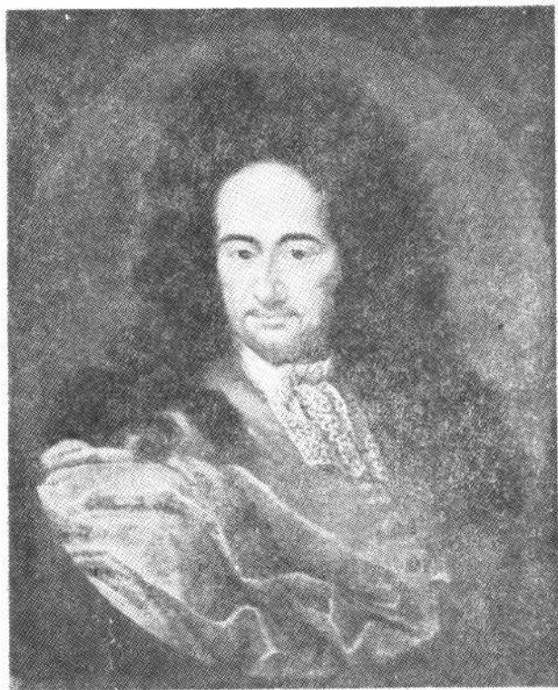
哥特弗利德·威廉·莱布尼茨 (1646—1716)