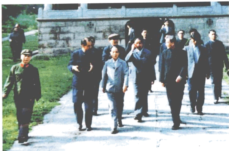
1984年5月，胡耀邦(前排左二)、胡锦涛(三排左一)在省委书记毛致用(前排右一)陪同下视察南岳大庙。