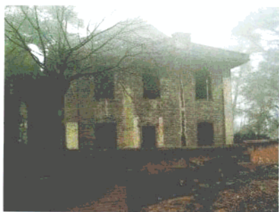
南岳圣经学校，1939年曾为南岳游击干部训练班所在地，周恩来、叶剑英、胡志明曾在此工作。