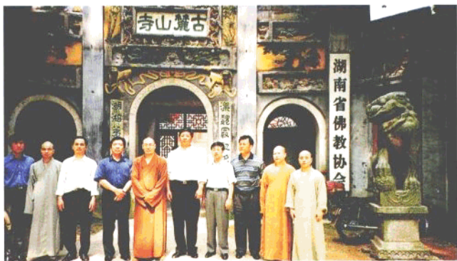
国务院宗教事务管理局局长叶小文(右五)视察麓山寺。