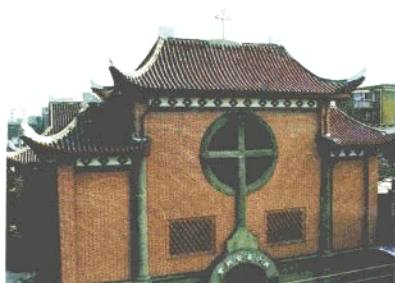
长沙基督教堂全景