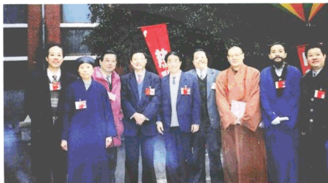
省委副书记储波、省政协主席刘夫生、副省长唐之享与宗教界省政协委员合影。