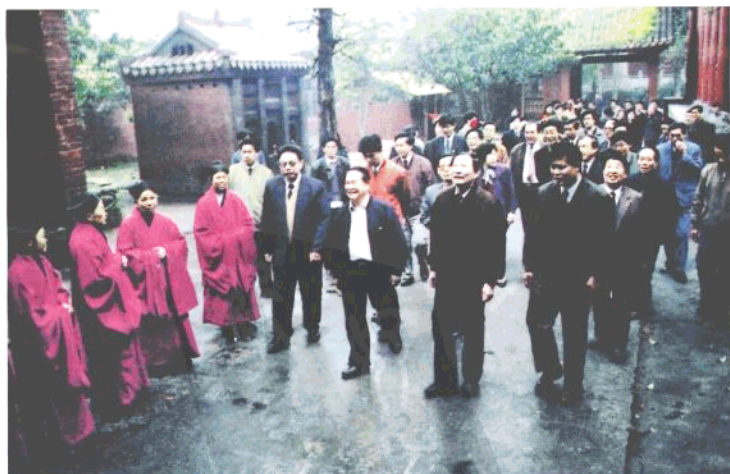
1993年4月，朱镕基(前排右二)在省委书记熊清泉(二排右一)、省长陈邦柱(前排左二)陪同下视察南岳大庙。