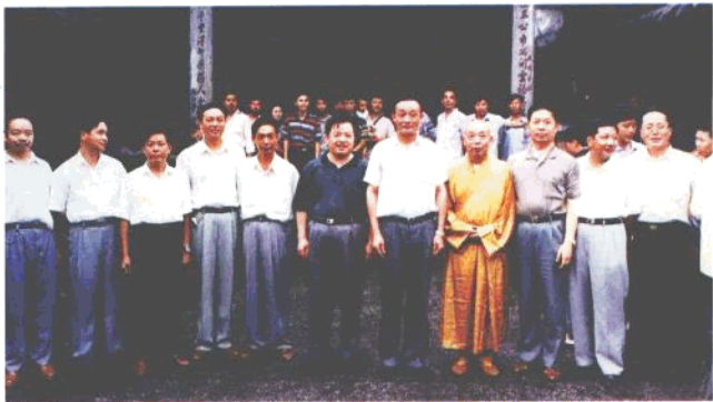
吴邦国副总理(左七)在周伯华副省长(左六)陪同下视察祝圣寺。