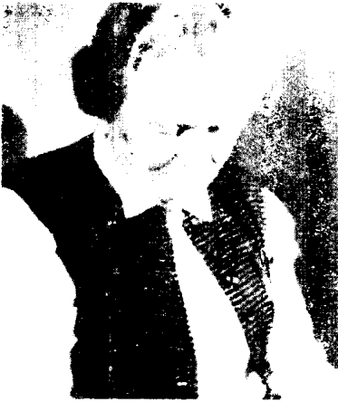
希特勒最小的妹妹保拉翻阅家庭影集。(约1950年)