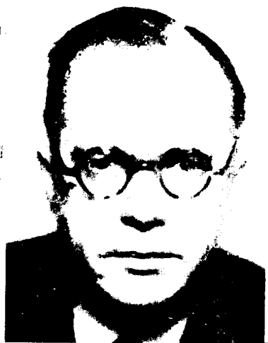
下：第一个为希特勒治疗的精神病医生埃德蒙福斯特医生，1918年10月至11月。