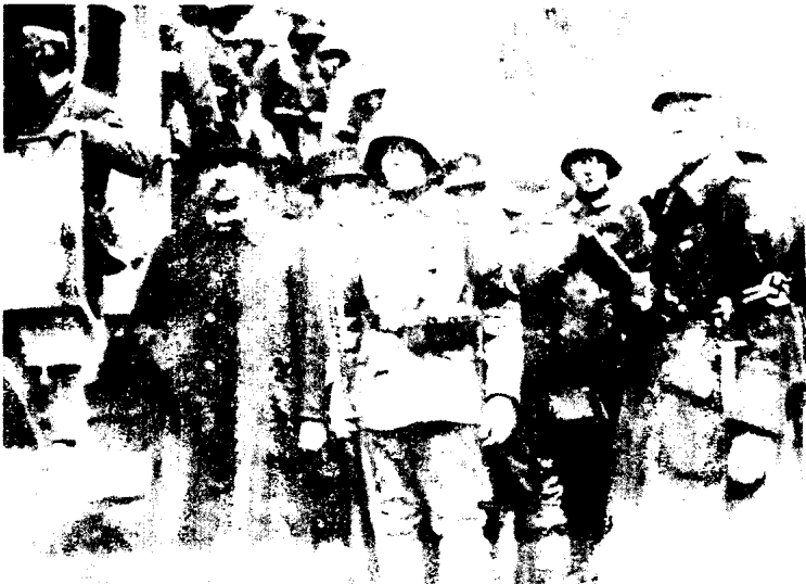
1923年11月9日啤酒馆起义