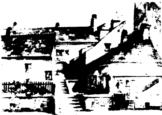
1911年至1912年，希特勒完成的作品——古老的维也纳水影画。