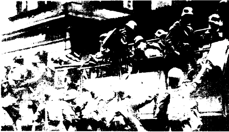
1923年11月9日啤酒馆起义