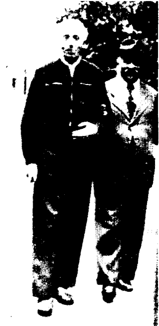
1960年时的库比兹克。右边是他的医生。