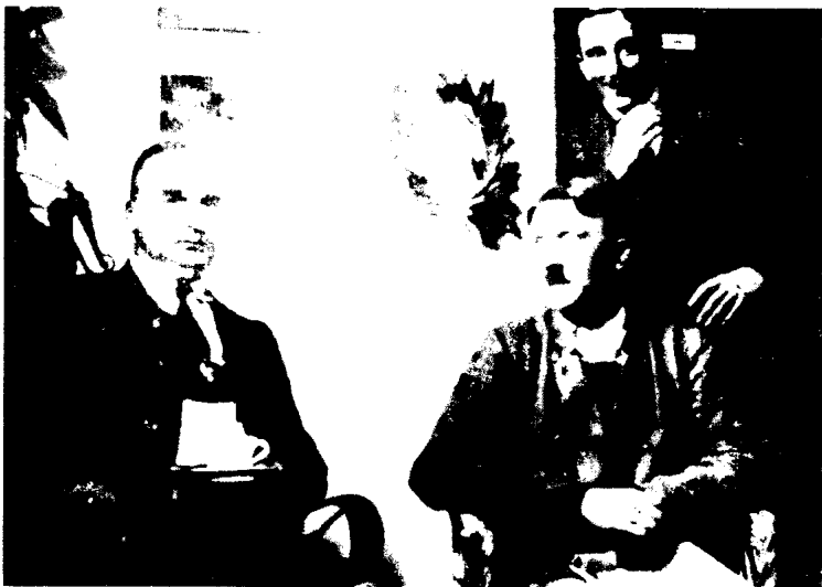
在兰茨贝格的纳粹犯人的普通监舍，希特勒后面是埃米·莫里斯，希特勒的早年同伴和私人司机；左边是科洛内尔·赫尔曼·克里贝尔，啤酒馆起义的军事领导人；由伊尔塞普勒尔和弗兰赫斯先后偷偷带进照相机拍下了这张照片及其他监狱照片。