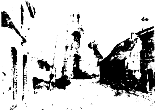
1917年，比利时贝茨里尔废墟。