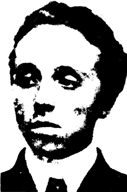
希特勒幼年时期最好的朋友库比兹克。