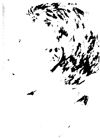
上：弗斯图姆伯格绘制的希特勒十六岁时素描，他是希特勒的同学，现居住在林茨