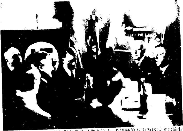
在慕尼黑霍夫布劳赫斯的党的早期会议上。希特勒的右边为格雷戈尔施特拉塞尔，左边为弗伦茨·泽维尔·施瓦茨，党的财政主管；马克思·阿曼党的宣传出版负责人和非雷尔的前上官；乌尔里希·格雷夫，他是希特勒的贴身警卫。1923年，啤酒馆起义将在这里爆发