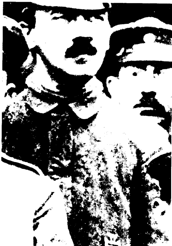
上：佩带铁十字勋章的希特勒。