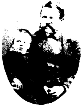
左：阿洛伊斯·希特勒和 儿子阿洛伊斯·吉列。