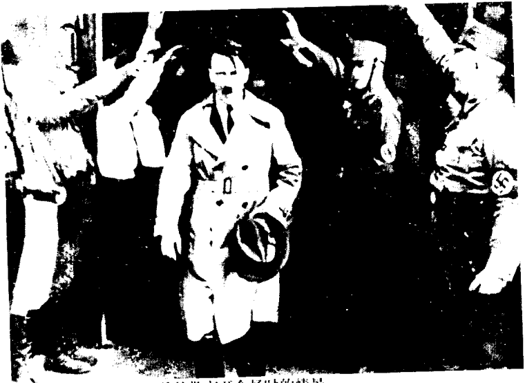
希特勒离开会场时的情景。