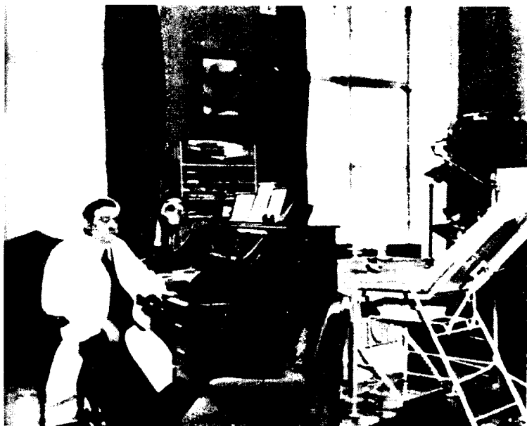
下：治疗希特勒母亲癌症的布洛赫医生在他的位于林茨的办公室里，该照片是应鲍曼的要求为菲雷尔的“个人影集”而拍摄的