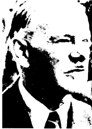
阿洛伊斯·希特勒·古列。 (约1950年)