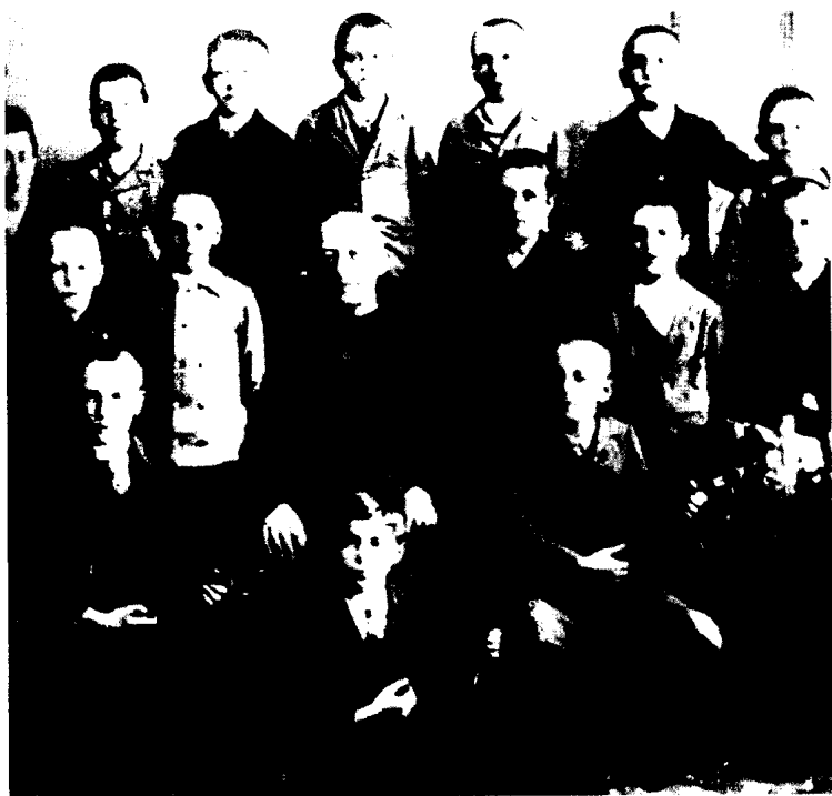
上：希特勒在修道院的圣歌学校学唱歌。 (约1899年，上排右起第二为希特勒)