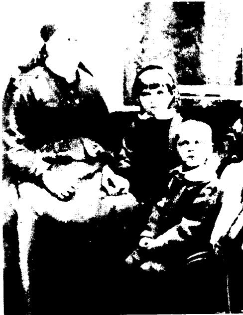
下：希特勒的异父姐姐安格拉，异 父兄弟阿洛伊斯和格兰在一起。