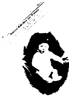
婴儿时期的阿道夫·希特勒