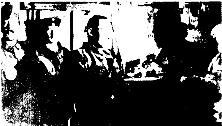
上：希特勒（左）在战壕中