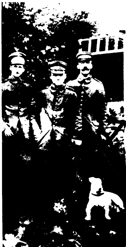
下：从左至右，第一次世界大战中的战友：恩斯特·施密特、萨金特·马克思·阿曼和希特勒及他的爱犬富克斯尔