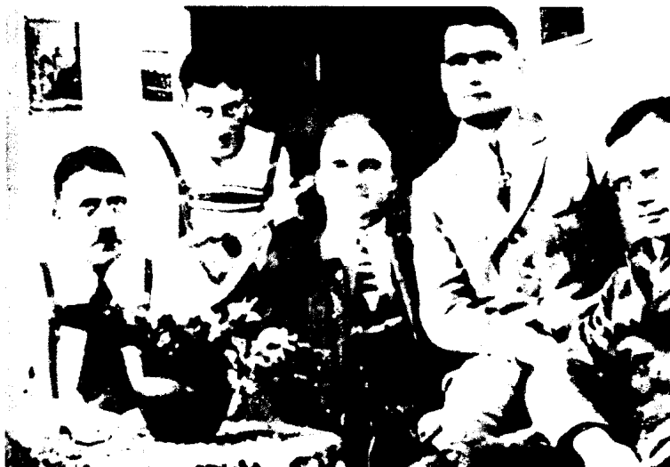
希特勒在监狱里和莫里斯、克里贝尔、赫斯和弗里德里·克韦伯在一起。