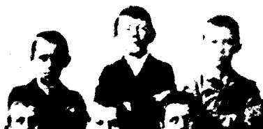
左：1900年，希特勒担任乡村学校的班长。 右：1901年，希特勒在城市学校遭遇失败。