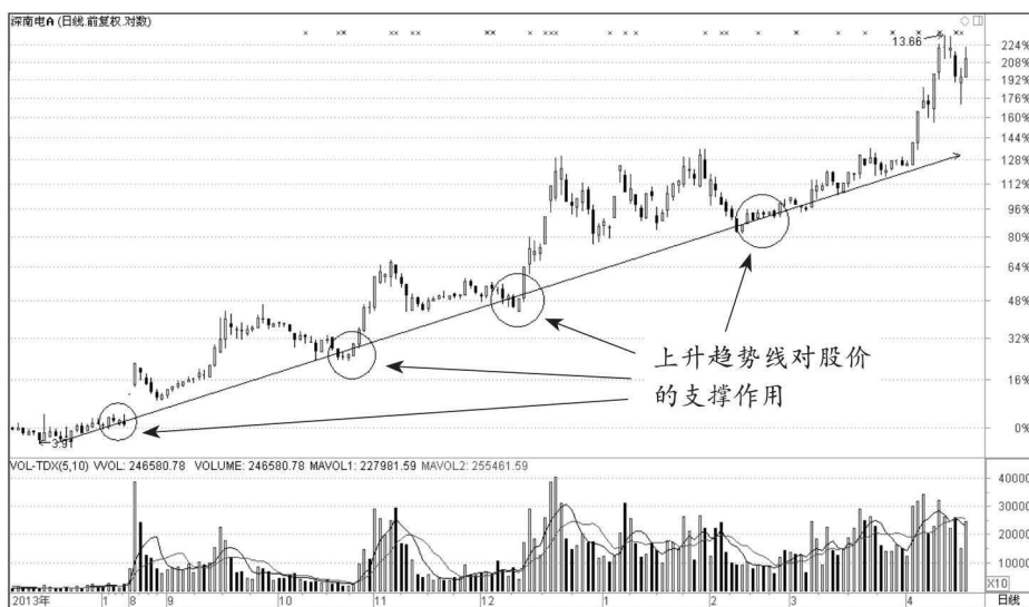
图 1-2 深南电 A (000037) 上升趋势线

上升趋势线是在对数坐标图中将股价波动中明显的低点用切线连接起来。上升趋势线能够显示出股票价格上升过程中波动的支撑位，即趋势线本身即为对股价的支撑。如图 1-2 所示，我们依据股价的波动做出一条上升趋势线，在股价的波动当中，趋势线得到了反复的确认。