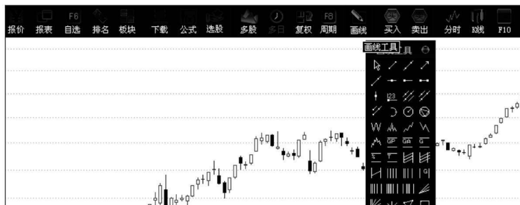
图 1-1 股票交易软件中的画线工具

根据股价在一定时间内的波动轨迹，我们可以在图中直观地看出股价运行的趋势，无外乎有三种：上升、下降和水平。上升趋势中，股价波动的高点和低点都在不断升高；而在下降趋势中，股价波动的高点和低点都在不断降低。以上升趋势为例，只要最近的高点都高于前面的高点，最近的低点也没有跌破前期的低点，上升趋势就是持续的、