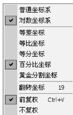
图0-1 对数坐标系的选择

见图0-1，普通交易软件中对数坐标系的选择：在图的纵坐标处点击鼠标右键，选择对数坐标系、百分比坐标（也可以选择等差坐标）。