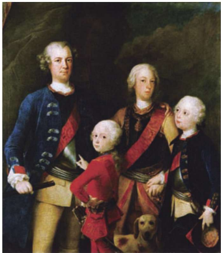
▲上图：“军人国王”腓特烈·威廉和他的家庭

腓特烈·威廉还创建了普鲁士第一支骠骑兵部队，建立了普鲁士的军备产业，并且计划重新列装普鲁士士兵的燧发枪与佩剑。利格制造商弗朗索瓦·赫努尔帮助腓特烈·威廉完成了武器换代。此后，整个18世纪，普鲁士军队的装备几乎都没有再变更过。1718年，普军还引进了一种新的铁制推弹杆。这种推弹杆比欧洲其他国家使用的木制推弹