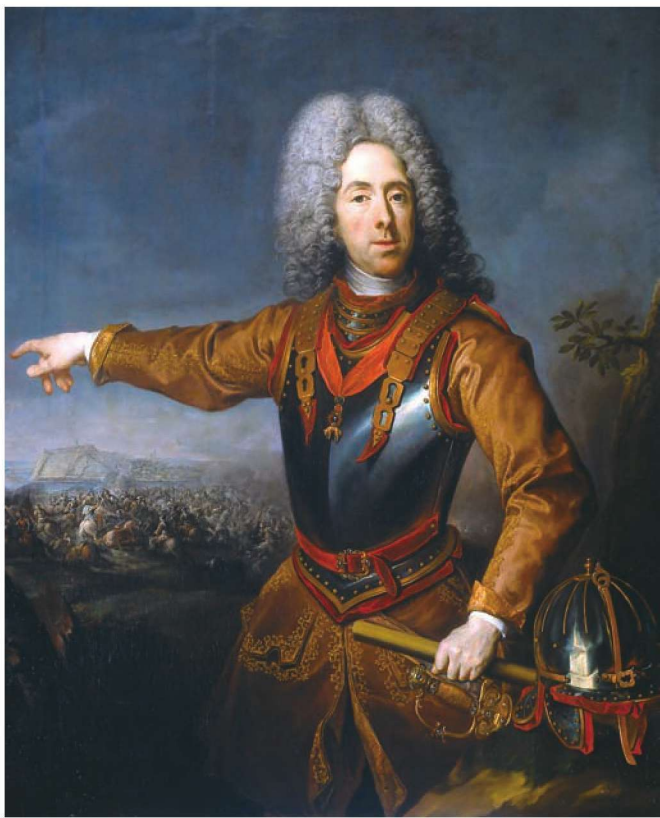
上图： 萨伏伊的欧根亲王。1697年，他在森塔战役中击败了御驾亲征的奥斯曼苏丹穆斯塔法二世的十万大军；九年战争中，他与马尔伯勒公爵协作指挥布伦海姆战役，重创法军；之后，他在意大利歼灭法国军队，极大地扩充了奥地利的势力

的一天。他击退了一队进犯的法军士兵。然后在一次穿越森林的骑马侦察中，他成为法国炮兵的目标，从天而降的炮弹撕裂了他身边的林木，而他依然保持镇定。事后，他的勇气得到了欧根亲王的高度赞赏。晚上，欧根亲王和维滕堡公爵来到这位年轻英雄的营地，同他进行了一次长谈。准备离开时，腓特烈二世给了公爵一个友好的亲吻。欧根亲王立马转过头说道：