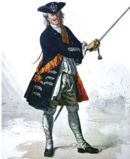
▲上图：安哈尔特-德绍的利奥波德亲王，外号“老德绍”，是普鲁士近代军队的训练者

二世还有一位重要的军事指导人，那就是风度翩翩、仪表堂堂的库尔特·克里斯托弗·冯·什未林。什未林出生在瑞典治下的西波美拉尼亚地区，在荷兰与瑞典军队中服过役。1720年，他作为一名历经沙场的老将加入了普鲁士的军队。就个人品质来说，什未林尊崇法国文化，并且努力保持上流社会的作风。在1741年的战局中，什未林还写信给腓特烈二世道：“我身边的葡萄酒已然告罄，现在只能悲惨地以啤酒度日。陛下，请给我送一桶莱茵河上的葡萄酒过来。您并无缺乏美酒之虞，所以想必不知道没有它时的苦楚。只要一桶葡萄酒，我就能与我英勇的战士们畅饮千杯。”