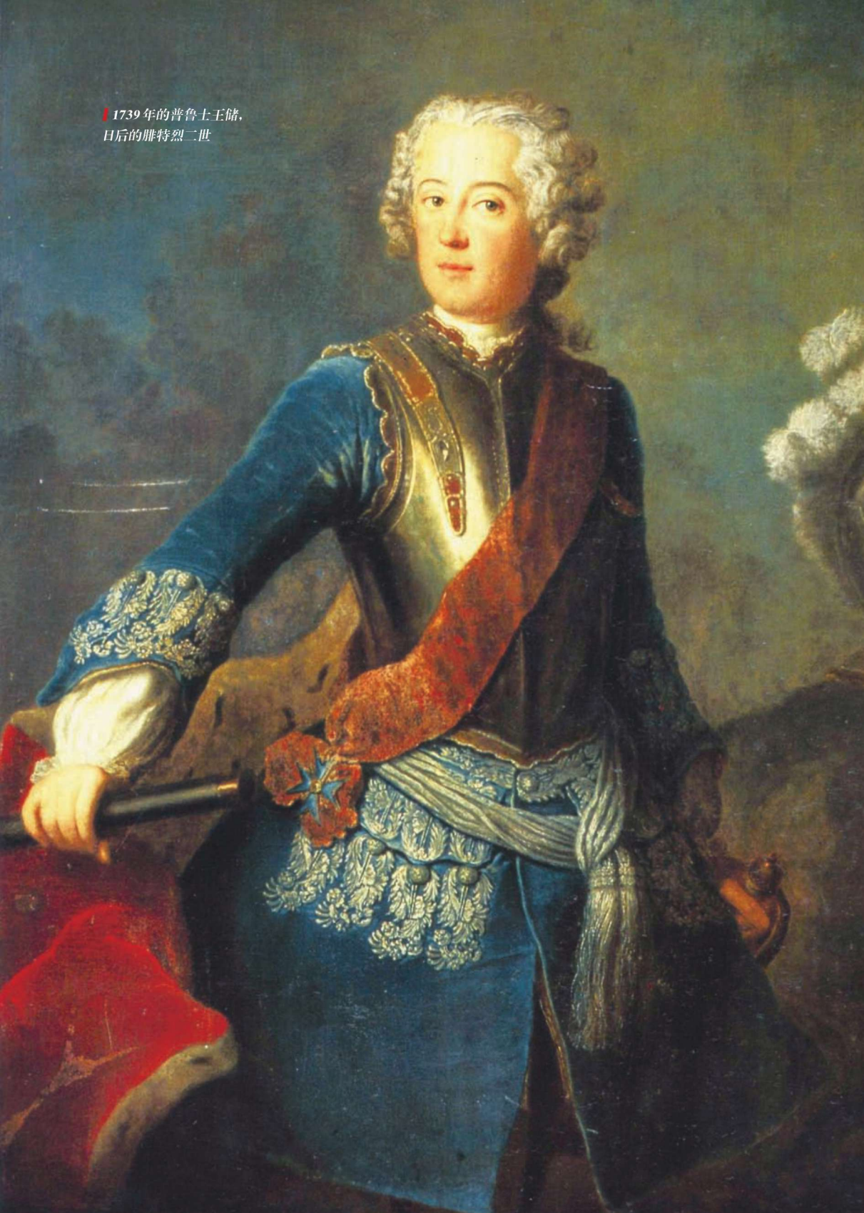
1739年的普鲁士王储， 日后的腓特烈二世