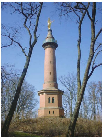
【上图】：勃兰登堡附近哈肯堡的费尔贝林战役纪念碑

17世纪，路德的宗教改革在德意志地区导致分裂，并引发了三十年战争。勃兰登堡-普鲁士公国当时的统治者是大选帝侯腓特烈·威廉，他十分厌恶普鲁士因几乎毫无反抗能力而在战争期间任由瑞典军队在领土上自由进出。腓特烈·威廉确信，一支强大的武装军队是御敌于国门之外，不受轻侮的基础。从那时起，他就有了一种雄心，要建立欧洲大陆上名列前茅的军事力量。