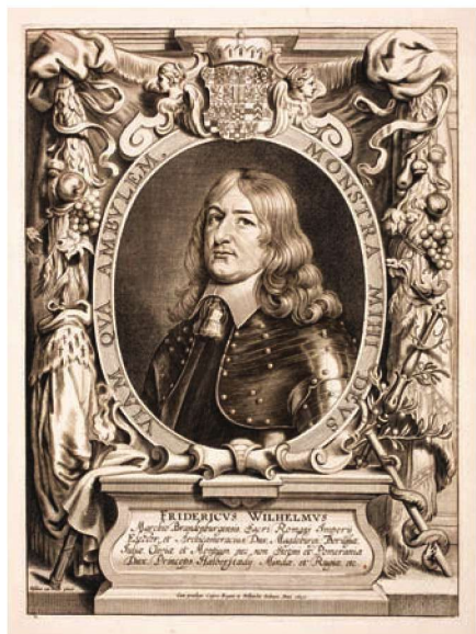
【上图】：大选帝侯腓特烈·威廉，勃兰登堡-普鲁士的中兴者