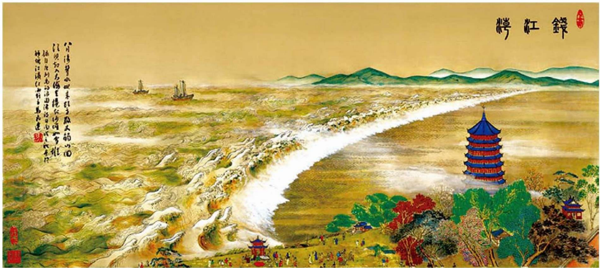
1-1-1 织锦画 钱江潮