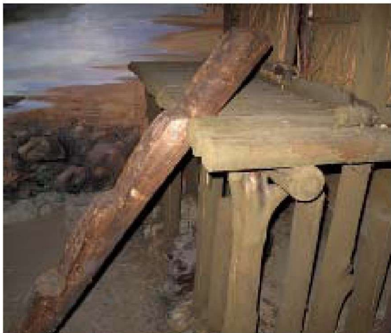
1-2-2 独木梯由原木劈半制作，直径15厘米，独木梯斜靠在地面和干栏建筑的楼层之间，共上下踩踏用，是一种原始的楼梯。

桥遗址位于萧山城区西南约4公里的城厢街道湘湖村。遗址西南约3公里为钱塘江、富春江与浦阳江三江的交汇处，在此形成曲折之形，往北再折向东流入东海。古跨湖桥人沿江而下，带着已经萌芽的农业文化传统，迅速繁荣发展起来，创造出一支具有地域特色的史前文化。