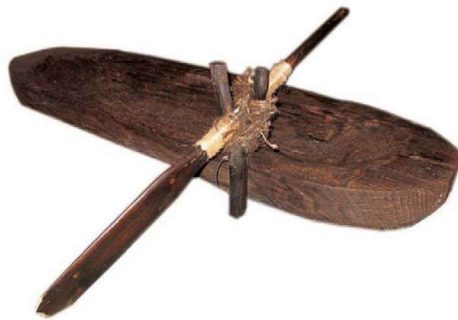
1-2-1 跨湖桥遗址发现了迄今中国存世年寿最高的距今8000年的独木舟，有力地证明了中国大陆的东南沿海地区，是发明、使用独木舟最早的地区之一。独木舟由整根松木剖半烧灼后再用石器挖凿加工而成。

浙江地区最早的新石器时代文化分布于浙中山区，人类为了生存，被迫向水源更为充沛的下游转移。跨湖